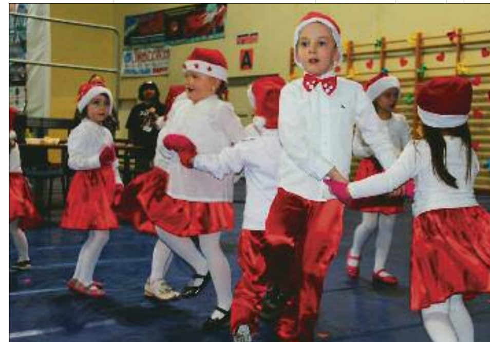
Tłumnie było pod sceną zwłaszcza, gdy tańczyły i śpiewały maluszki z przedszkoli