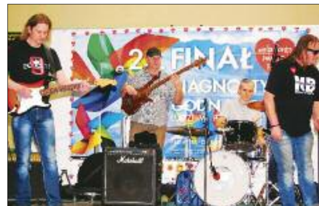
Niezłego „czadu” dali też nasi bluesmani z zespołu No business