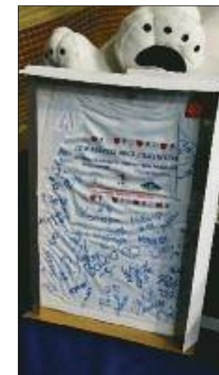
Pamiątkowa koszulka z meczu towarzyskiego, który poprzedził Finał, z podpisami wszystkich zawodników, też trafiła na licytację