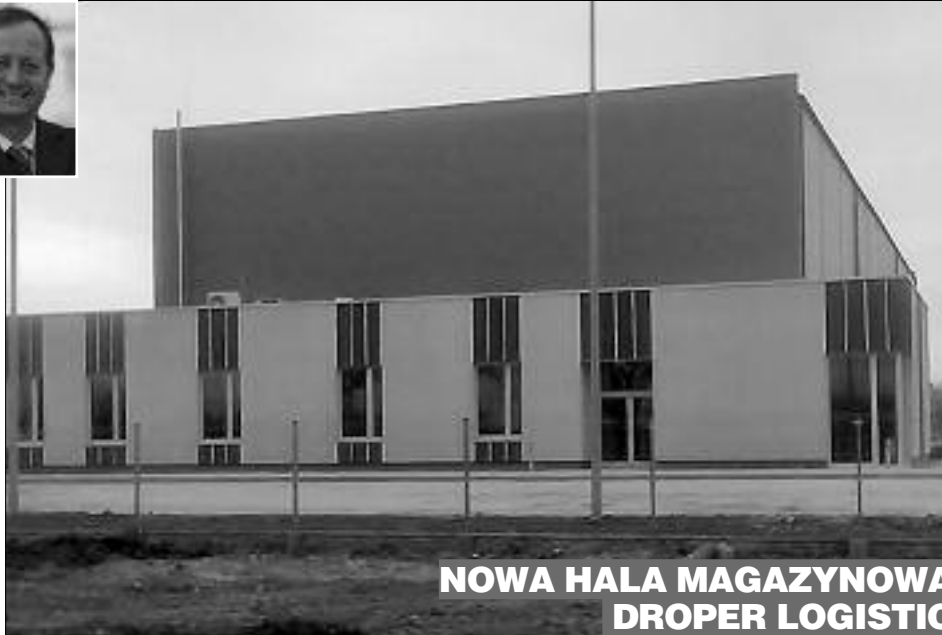
NOWA HALA MAGAZYNOWA DROPER LOGISTIC

Dzięki w Podstrefie Świebodzice kupiło 5 firm, cztery z nich działają: GEA Polska - która jako pierwsza wybudowała zakład i zatrudniła około 75 osób, Sagepo Refa - deklarowana wysokość zatrudnienia to 100 osób, Vasco-Tech (deklarowane zatrudnienie 6 osób) oraz Droper Logistic -15 osób. W sierpniu 2014 roku 0,76 ha gruntu kupiła spółka Enwar, reprezentująca branżę projektowo-metalurgiczną. Firma otrzymała niedawno pozwolenie na budowę zakładu.