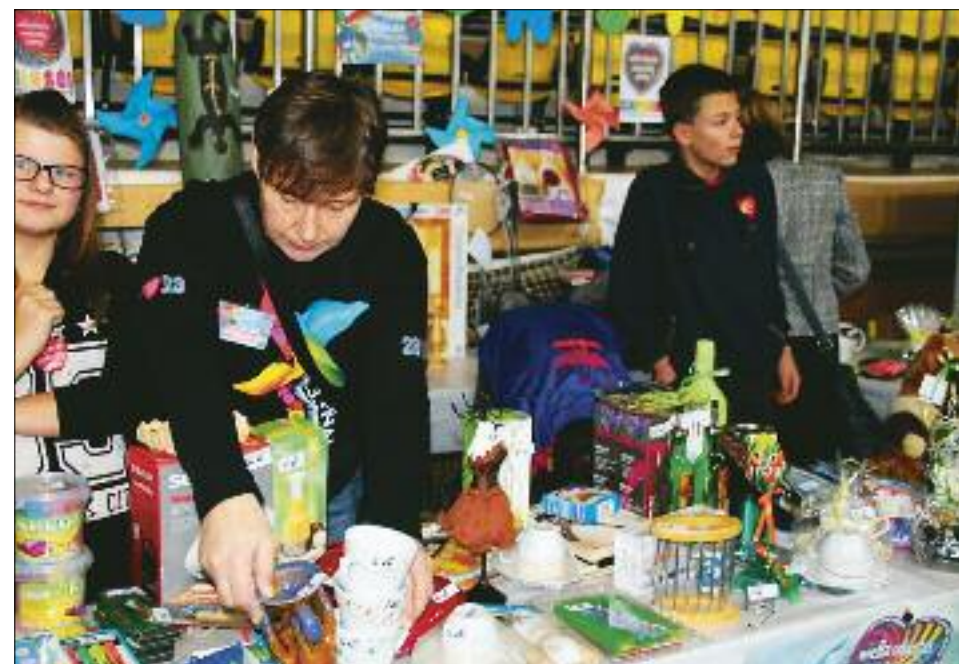
Loterie, sprzedaż rękodzieła, aniołków, bransoletek - dochód z tego wszystkiego też oczywiście wsparł WOŚP