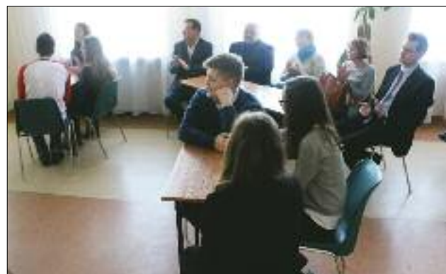
W rozpoczęciu konkursu wziął udział burmistrz Bogdan Koźuchowicz , honorowo patronujący temu przedsięwzięciu

Europejskiej, a nauczycielom-opiekunom dziękujemy za przygotowanie uczniów do niniejszego konkursu. Dzięki tego typu przedsięwzięciom uczniowie mają okazję poczuć się prawdziwymi i równoprawnymi obywatelami świata!