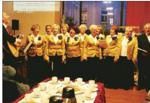
Chór Akord zaprezentował się z nowym dyrygentem