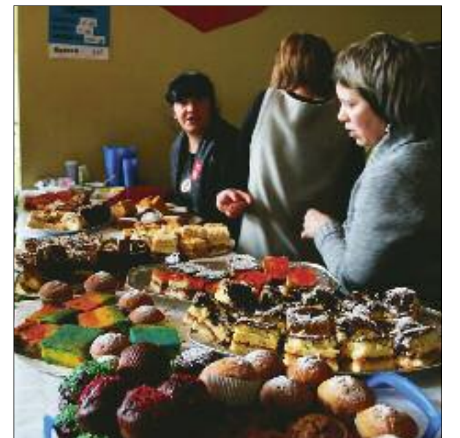
Równie tłoczno było w holu, gdzie można było kupić pyszne ciasta domowe, sałatki, grochówkę i wiele innych pyszności. Mniammmm