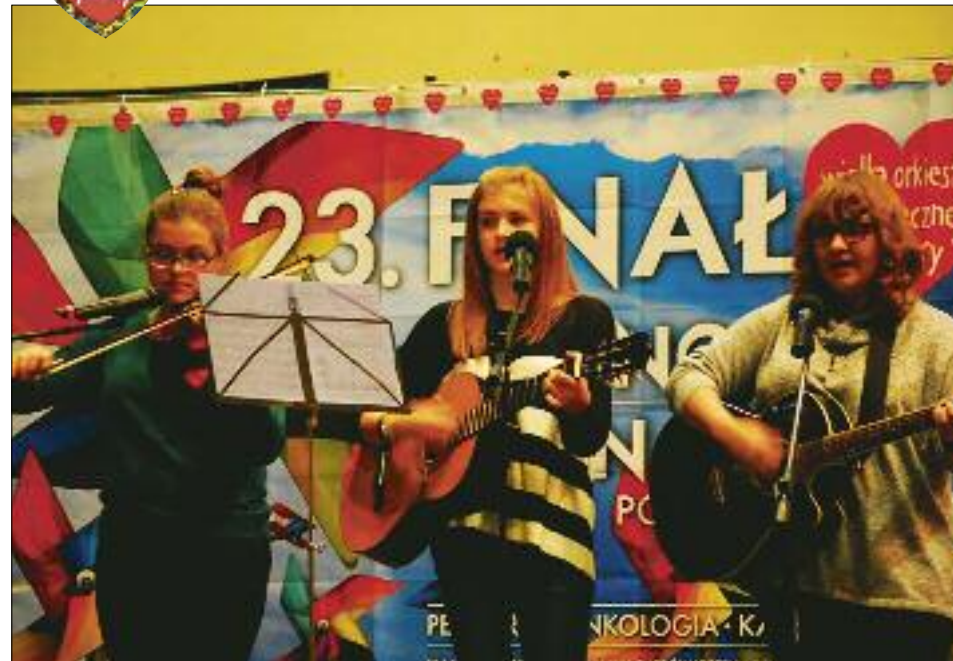
Na scenie głównej niemal przez cały czas trwania Finału występowali młodzi artyści z naszych szkół