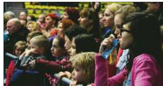
Z godziny na godzinę publiczności przybywało