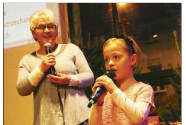
Rodzinne śpiewanie - to idea Kołodowania z Burmistrzem