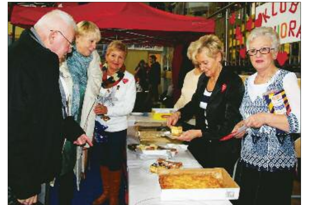
Swoje ciasta serwowały też m. in. panie ze Związku Emerytów, Rencistów i Inwalidów