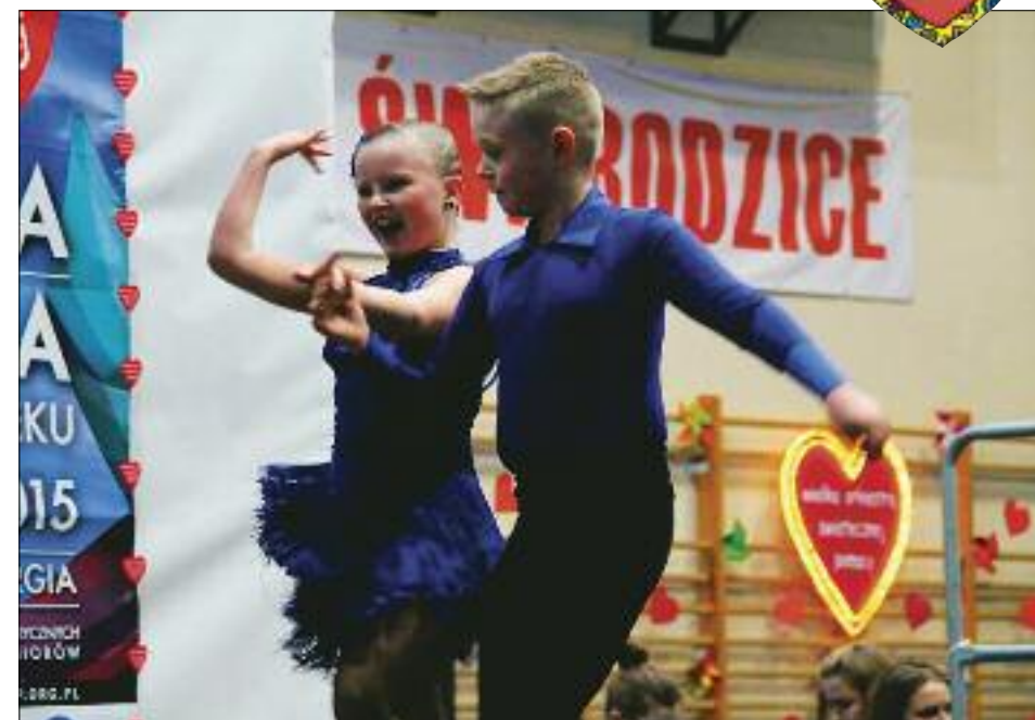
Wspaniałe występy - m. in. młodych tancerzy - były nagradzane równie wspaniałymi brawami