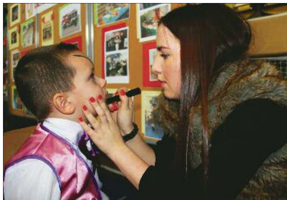
Chętnych do malowania buziek nie brakowało