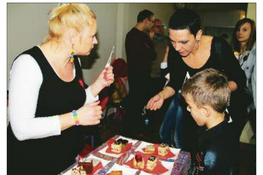
Na stoisku Szkoły Specjalnej można było kupić smakowite wypieki