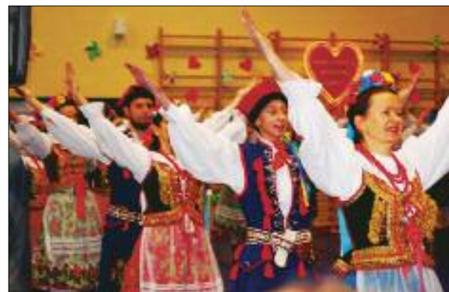
Jedną z gwiazd wieczoru - Zespół Tańca Estradowego i Narodowego Krąg