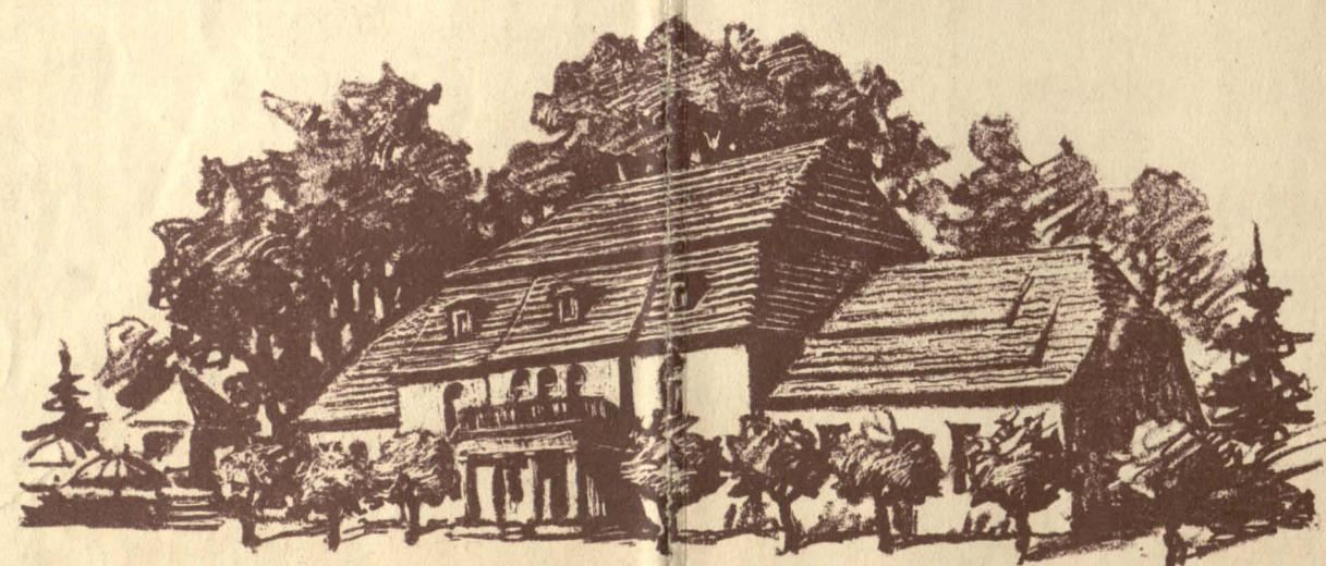
Das ist das „Stammhaus des Echt Stonsdorfer Bitter“!

W. Koerner & Co. Hirschberg-Cunnersdorf, Stonsdorf im Riesengebirge