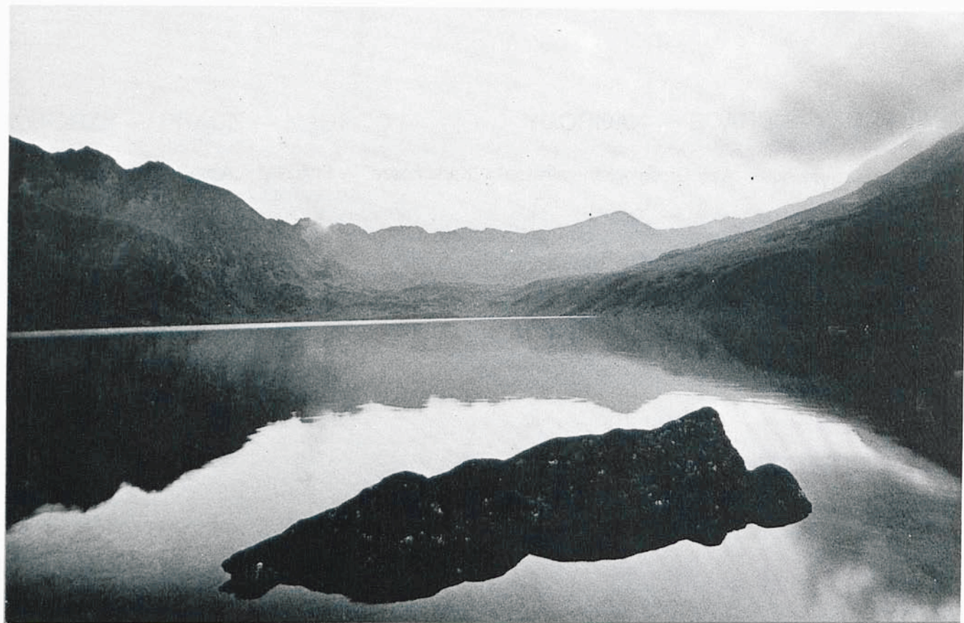
Rafał Swosiński — „Tatry”