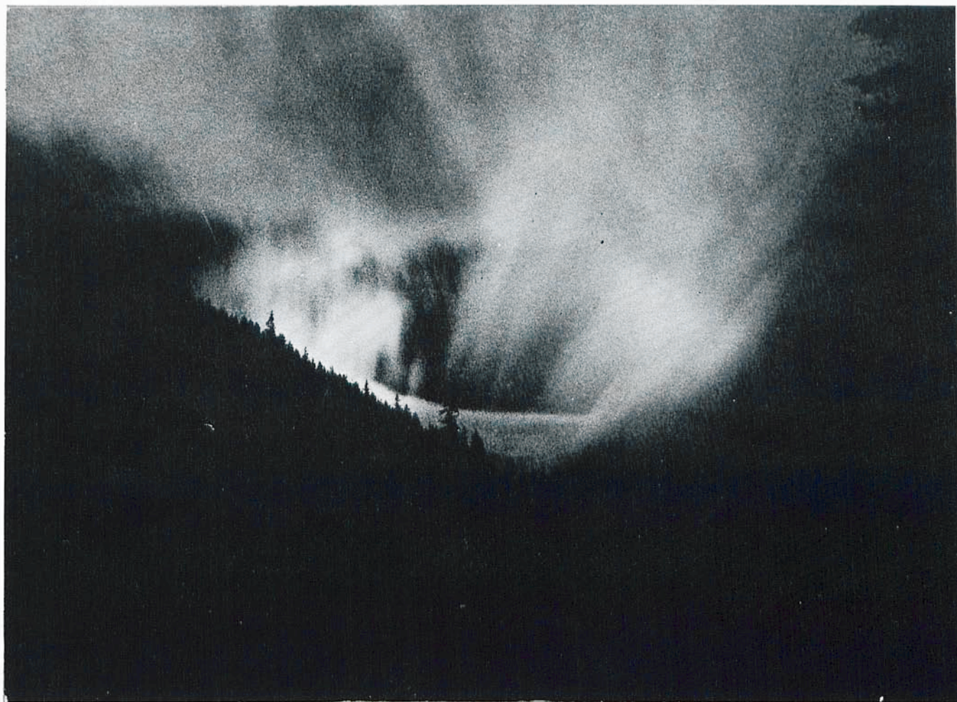
Czesław Odo-Mostowski — „Impresja z ornackiego schroniska”