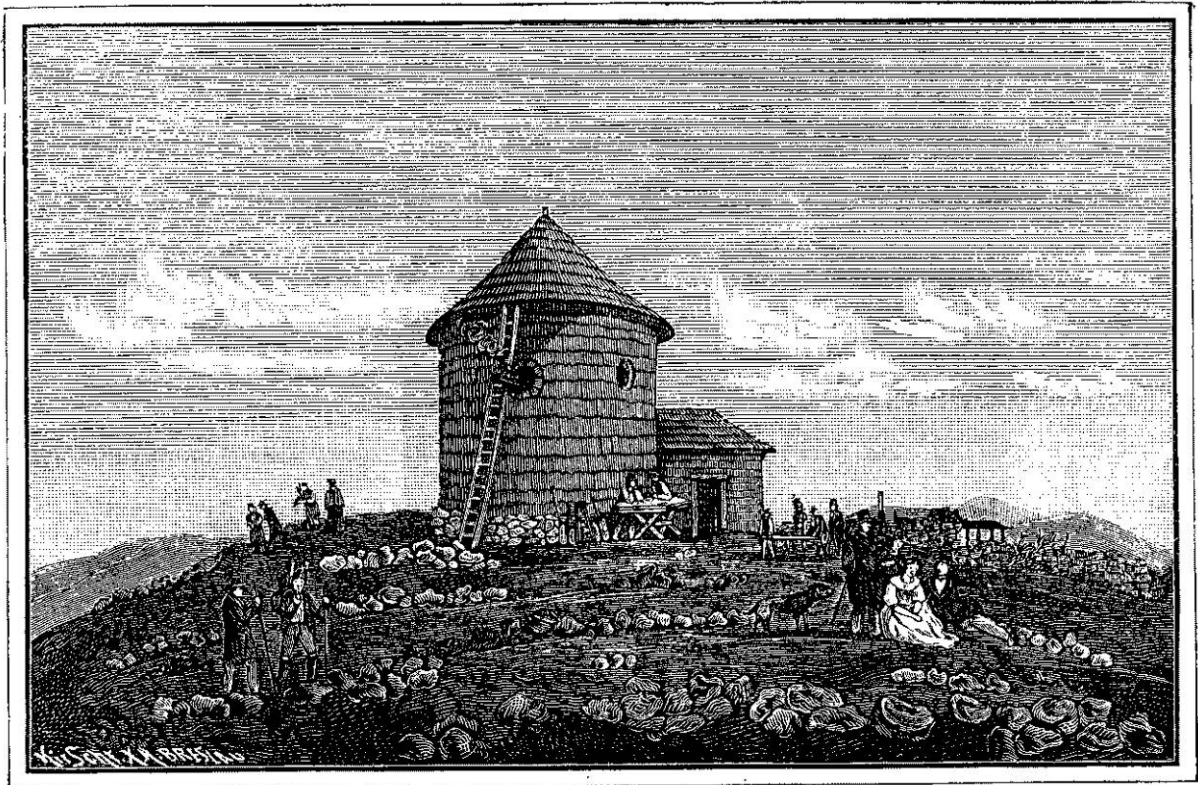
Die St.. Laurentius-Kapelle auf der Schneekoppe.

undzwanzig Leute harreten, die sie auf die Koppe schaffen sollten; trotzdem hätte Mitte Juli, wie zugesichert, die Kapelle geweiht werden können, wenn nicht der Altar wieder gefehlt hätte, der, wie der Prälat von Grüssau schrieb, erst in vier Wochen geliefert werden konnte, dann aber unverzüglich zu Wagen von Grüssau nach Marschendorf und von da durch fünfzig bis sechzig Träger auf die Koppe geschafft werden sollte. Wie es aussah, erfahren wir nur andeutungsweise von Thebesius: 19