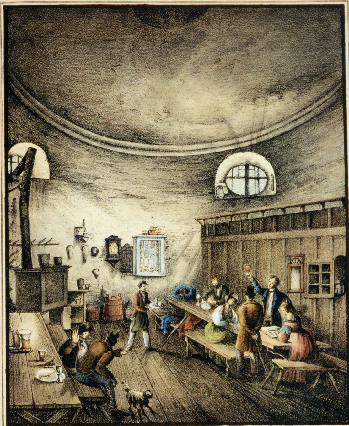
Das Innere der Schneekoppen-Kapelle