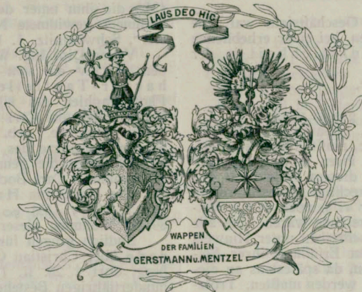
WAPPEN DER FAMILIEN GERSTMANN u. MENTZEL