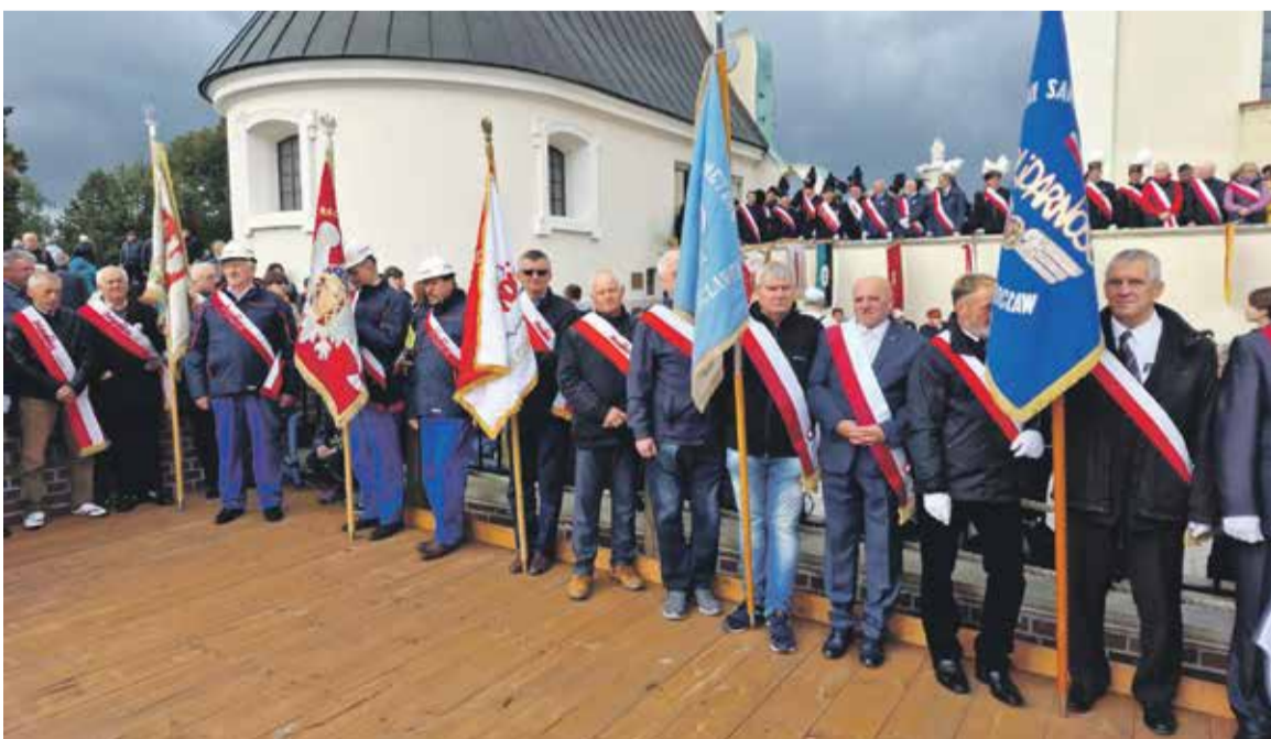
Związkowcy z „S” MPK Wrocław (z prawej)

uka społeczna Kościoła. Wiara, nadzieja, miłość Polsce – to słowa, które zostały wyszyte na naszym historycznym sztandarze Międzyzakładowego Komitetu Strajkowego w Gdańsku w sierpniu 1980 roku. Tu, po mojej prawej stronie stoi razem z naszym poczem sztandarem ten historyczny sztandar. Na nim nie ma jeszcze loga Solidarności, ale jest wizerunek Jasnogórskiej Pani. Stoczniovcy w sierpniu 1980 roku zawierzili ludzi pracy i Solidarność Jasnogórskiej Pani. Już wtedy. Dlatego to jest dla nas tak ważne, aby pracować na rzecz ludzi pracy z Jasnogórką Panią, ale także z Bogiem w sercu. I nie ma innych wartości! – przekonywał Piotr Duda, przypominając, że na każdym sztandarze Solidarności jest wizerunek ks. Jerzego Popiełuszki, Jasnogórskiej Pani albo Świętych. – Bo taka jest Solidarność! To jest nasza siła! – mówił. I dodawał: – To pielgrzymowanie jest bardzo ważnym elementem działalności naszego związku, bo to przecież