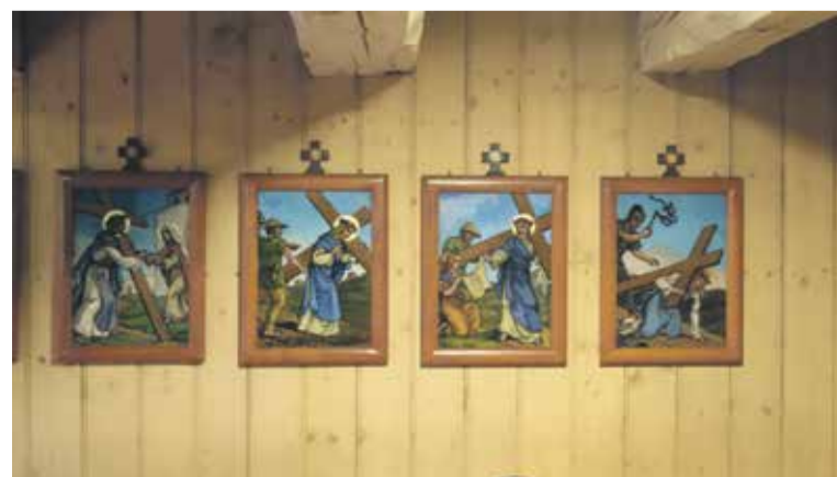
Malowane na szkle stacje Męki Pańskiej