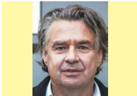
Autor jest reportażystą, felietonistą, powieściopisarzem. Obecnie pracuje w TVP3 Opole i TVP Info.

Natomiast biznesowe rekiny swą energię oraz intelekt kierowały nie na produkt, by go stale doskonalić, lecz na wydeptywanie politycznych ścieżek na skróty oraz na księgowo czary-mary. Dobrze pamiętam to pompowanie kosztów poprzez dopisywanie do wydatków firmy własnych luksusów: Egiptów, kochanek, mercedesów i turnusów SPA w szwajcarskich kurortach. Albo dojenie VAT-u tak obfite, że na pewien czas przestała się w Polsce opłacać nawet produkcja amfy. Lub owe wytworne limuzyny z kratką, która oddzielała część pasażerską od bagażowej, dzięki czemu auta owe mogły robić za dostawczaki, więc być w całości „wrzucane