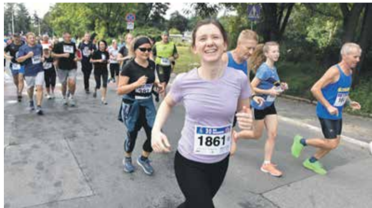
Uczestnicy zawodów okazali radość biegania.