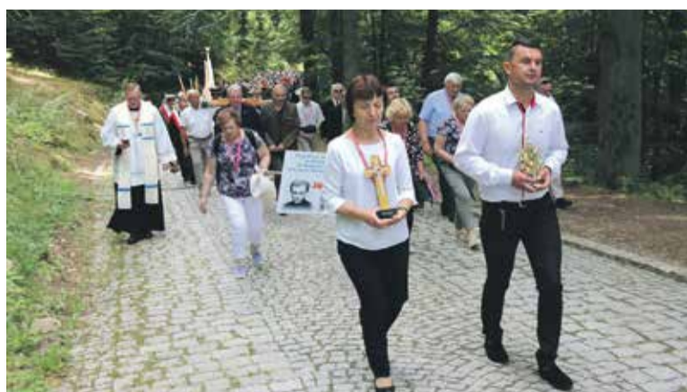
W procesji relikwie błogosławionego wniesiono do świątyni.

W sobotę 20 sierpnia w sanktuarium Matki Bożej na Iglicznej uroczystie wprowadzono do świątyni relikwie bł. ks. Jerzego Popiełuszki i św. Jana Pawła II. W uroczystościach uczestniczyli przedstawiciele dolnośląskiej Solidarności, m.in. z przewodni-