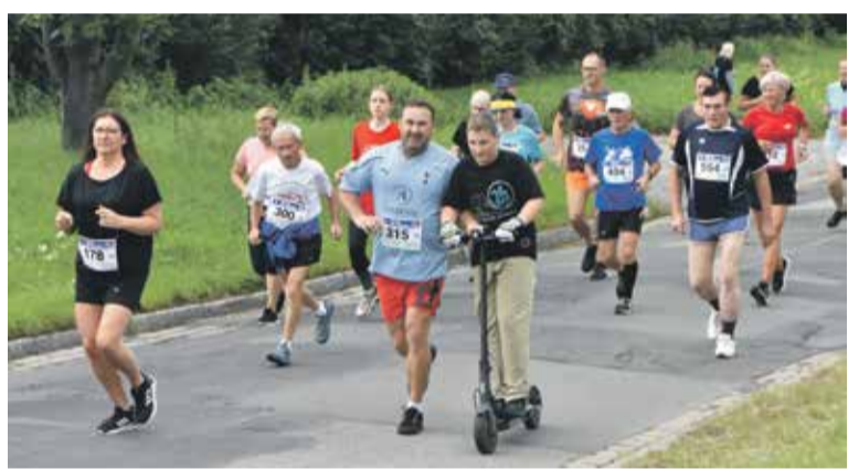
Ojciec z synem (na hulajnodze).