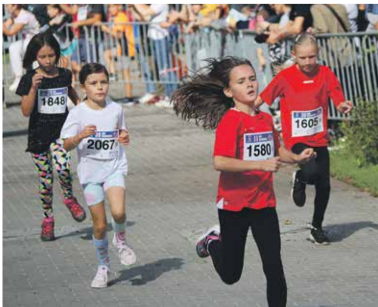
Dziewczynki w kategorii 9-latek.

Do ostatniej chwili organizatorzy, Region Dolny Śląsk wraz Dolnośląskim Stowarzyszeniem Kultury Zdrowotnej i Sportu, drżeli o pogodę. Prognozy na początek września zapowiadały, że w dniu zawodów przez cały dzień będzie padać deszcz. Wprawdzie intensywne opady nad ranem sprawiły, że teren zawodów miejscami był dość grząski, ale słońce przedpołudniowe łaskawie przyświecało zawodom dzieci.