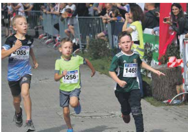
Biegący chłopcy w kategorii 9-latków.