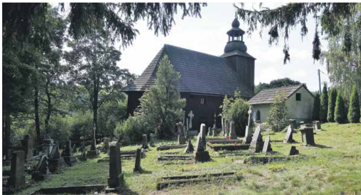
Kamieńczyk. Kościół św. Michała i zabytkowy cmentarz

Kamieńczyk (dawniej Steinbach) to rozrzucona w dolinie potoku Kamionki niewielka wioska, położona na wysokości 500–650 m nad poziomem morza, na trasie z Międzyzlesia do czeskich Petrovic.