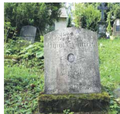
Przylegający do kościoła cmentarz. Najstarsze groby mają po 200 lat

Po 1945 r. mieszkańcy Kamieńczyka musieli opuścić swoją wieś, a na ich miejsce przybyli polscy