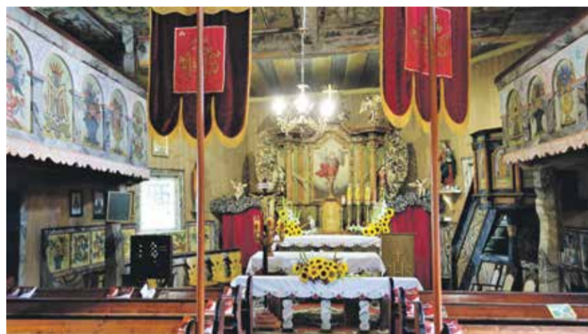
Kościół św. Michała – barokowy ołtarz z obrazem przedstawiającym patrona świątyni

ca. Kiedyś miała swój własny niewielki szpital, młyn, szkołę, nawet schronisko narciarskie, a oprócz gospodarzy uprawiających rolę