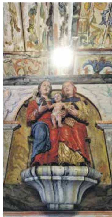
Barokowa Święta Anna Samotrzecia

Ta skromna, jednonawowa świątynia jest dziś najstarszym z czterech zachowanych tego typu obiektów na ziemi kłodzkiej (obok Zalesia, Międzygórza i Nowej Bystrzycy). Reprezentuje typ budownictwa sakralnego wywodzący się jeszcze z czasów renesansu. Podobne w kształcie