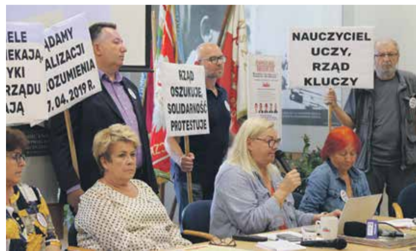
Konferencja prasowa dolnośląskiej Sekcji Oświaty

Jako brzydka, określiła narrację, że w czasie kryzysu i wojny za naszą granicą nauczyciele nie powinni domagać się podwyżek płac. Przypomniała, że wielu nauczycieli otoczyło opieką dzieci, które przybyły do Polski z tere-