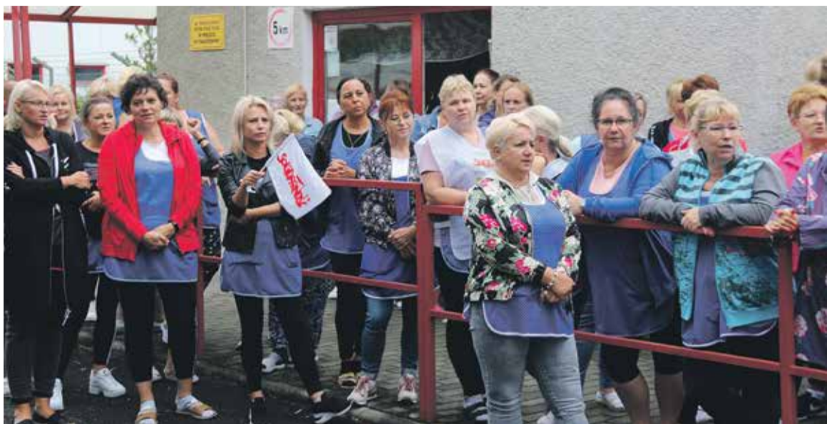
Strajkujące kobiety obserwują przybyłych ze wsparciem związkowców.

Powodem strajku pracowników zakładu obuwniczego W&W Polska w Lubsku była opieszałość pracodawcy związana z wprowadzeniem podwyżki. Zamiast podnieść pensję zaraz po wiosennych negocjacjach, właściciele firmy chcieli to uczynić dopiero od listopada. 23 sierpnia strajkujących wsparli związkowcy z Regionu Dolny Śląsk NSZZ „Solidarność”.