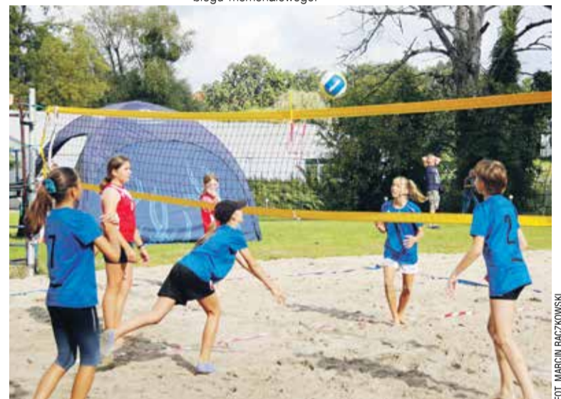
Podczas turnieju siatkarskiego, imprezy towarzyszącej biegowi.