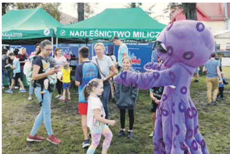
Ośmiornica zachęcała do odwiedzenia pobliskiego Hydropolis.