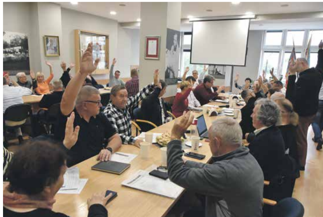
Podczas obrad Zarządu Regionu

Członek Zarządu Regionu, a zarazem dyrektor Biegu Solidar-