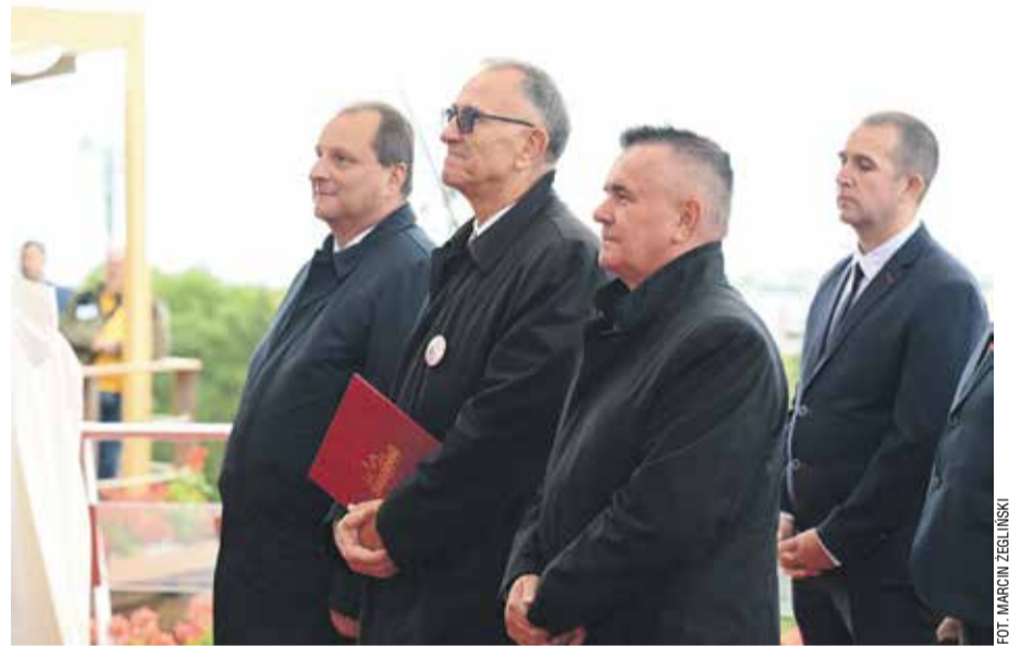
Delegacja dolnośląskiej „S” podczas składania darów ołtarza.