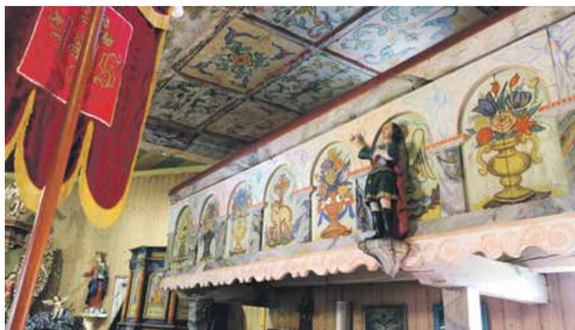
Polichromie na chórze muzycznym

w roku 1710 jako świątynię protestancką, przedpogrzebową. Ulokowano ją na niewielkim wzniesieniu, na którym istniało pierwotne,