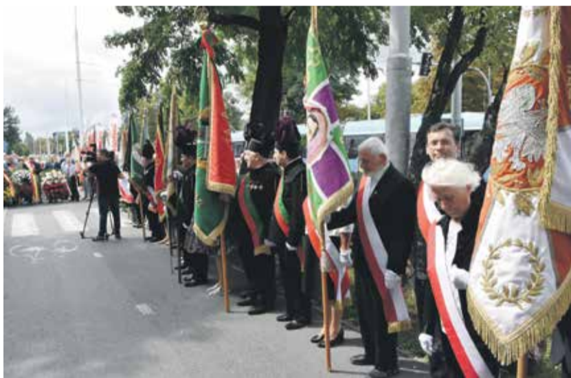
Duma i wzruszenie widoczne u uczestników sierpniowego zrywu