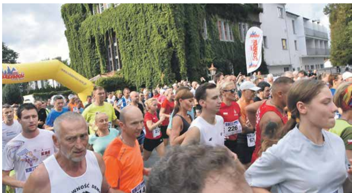
Uczestnicy Biegu głównego wyruszyli spod Hotelu Wodnik