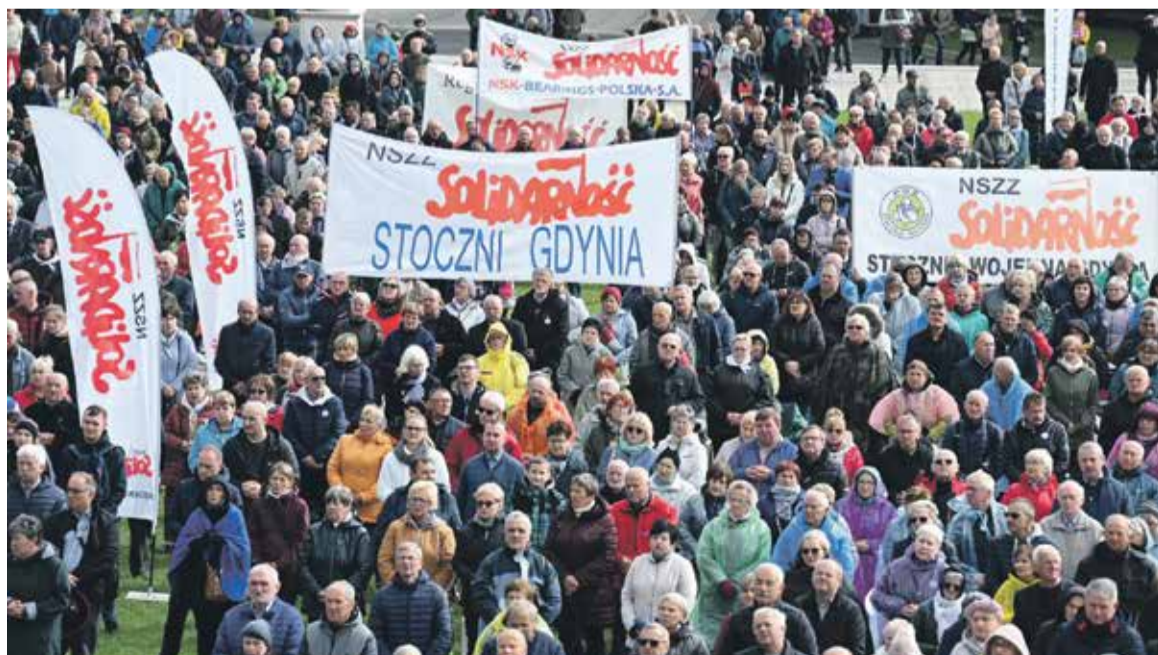
Na mszę przybyli związkowcy z całej Polski