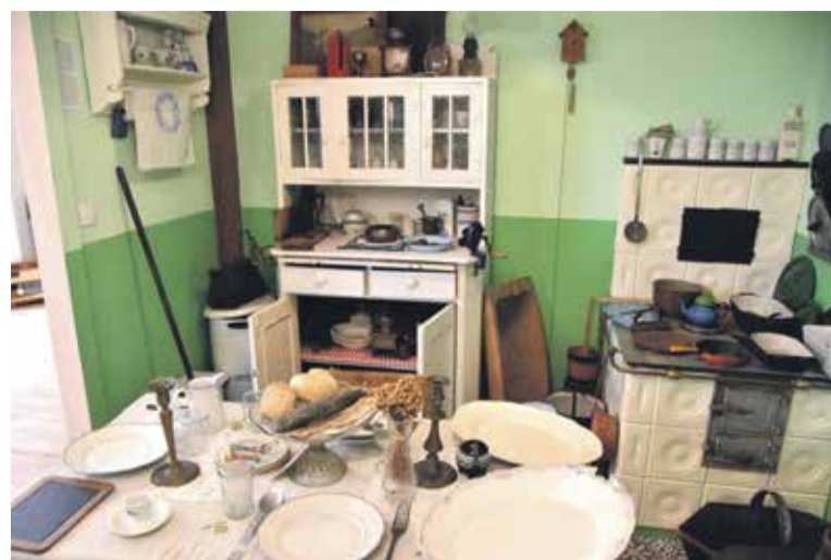
Jedna z ekspozycji w Izbie Pamięci w Kątach Wrocławskich

Projekt zakłada organizację szkoleń dla osób prowadzących izby pamięci, wyposażenie ich w materiały do zabezpieczania zbiorów, opracowanie inwentarzy i centralnej bazy danych dotyczącej zbiorów oraz przygotowania wystaw. To podjęcie realnych działań na rzecz zabezpieczenia i promocji tego niezinventaryzowanego dotąd zasobu dziedzictwa narodowego, kluczowego dla kształtowania lokalnych tożsamości.