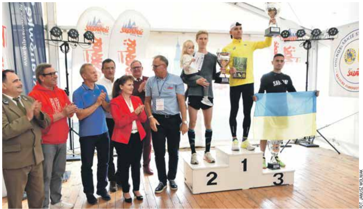
Zwycięzca biegu głównego

Komplet wyników Biegu na www.bieg.solidarnosc.wroc.pl