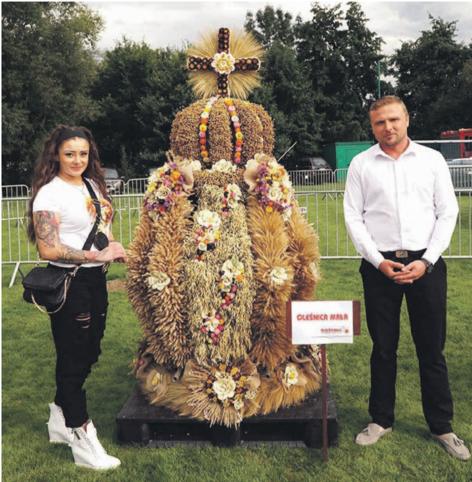
Najpiękniejszy wieniec w tym roku pochodzi z Oleśnicy Małej

Potem powitał wszystkich gości i mówił dalej: - Czas dożynek to nie tylko msza święta, ale również część świecka. Cieszę się, że mimo pandemii udało nam się zorganizować uroczystość dożynkową i nieprzerwanie kontynuujemy wspaniałą tradycję naszych ojców. Obchodzimy dziś święto plonów ziemi gminy Oława. To jeden z najpiękniejszych