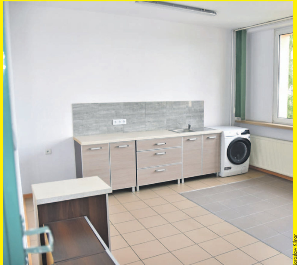
Tak prezentuje się nowe pomieszczenie socjalne, które będzie służyło olawskim ratownikom