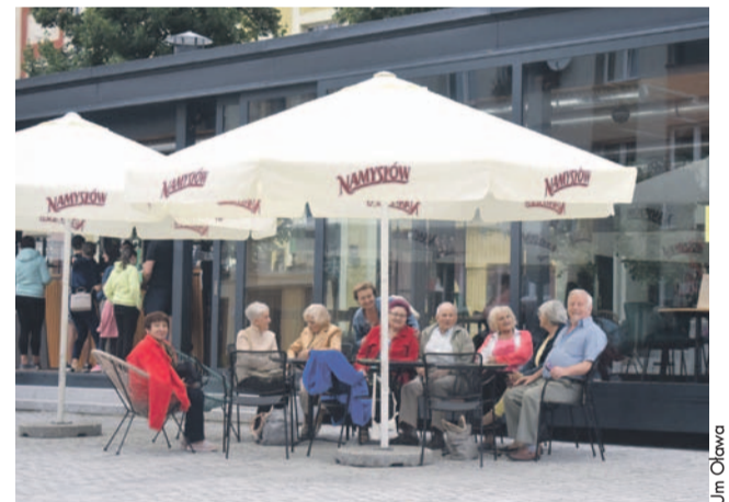
Nowa kawiarenka od początku wzbudziła zainteresowanie mieszkańców