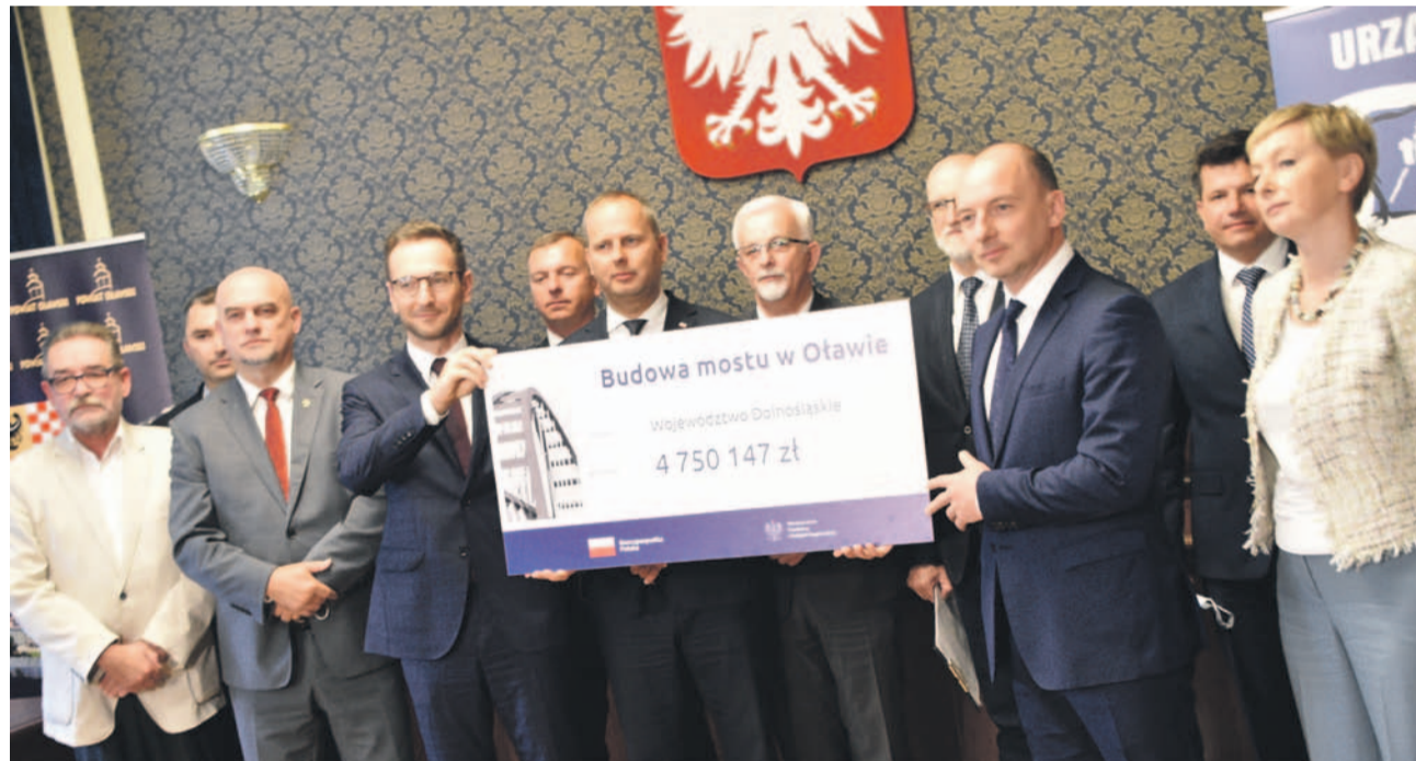
30 sierpnia w sali rajców zorganizowano konferencję prasową

- Obecnie pewne jest, że etap projektowania zyskał finansowanie państwa - odpowiedział. - Te prawie 5 mln złotych to pieniądze rządowe, które zostaną wykorzystane na kontynuację procesu przygotowania całej dokumentacji, by uzyskać pozwolenie na budowę. Nie ukrywam, że nie byliśmy usatysfakcjonowani tym, że nasz pomysł nie znalazł się w programie „Mosty dla Regionów”. Lista rezer-