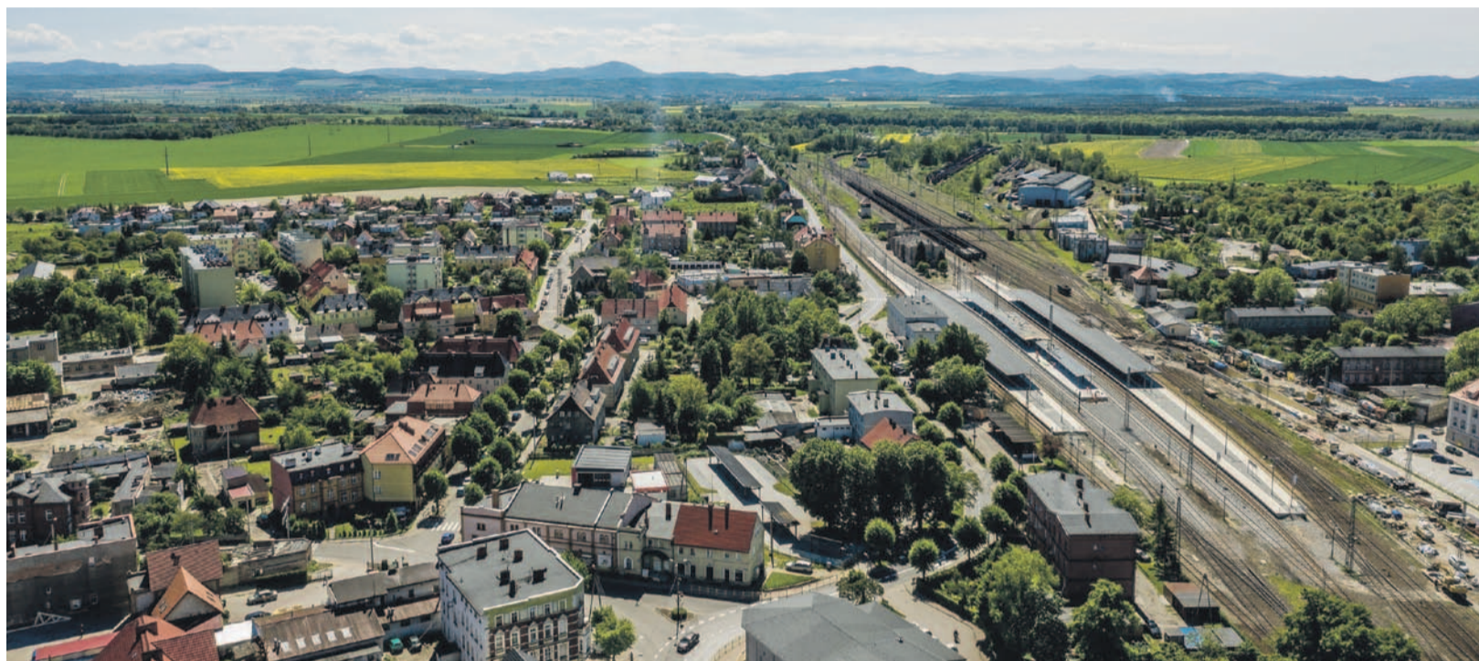
Na inwestycjach skorzystają mieszkańcy regionu, przede wszystkim z małych gmin wiejskich lub wiejsko-miejskich.