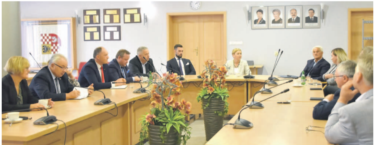
Podczas spotkanie nie brakowało lokalnych tematów