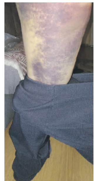
Noga naprawdę nie wyglądała dobrze

Ubezpieczyciel nie chce się wypowiadać w tej sprawie. Gdy „Interwencja” kanału Polsat News zapytała, dlaczego towarzystwo nie przyznało odszkodowania kobiecie, która poślizgnęła się na winogronach leżących nie