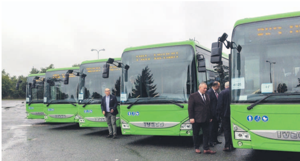
PKS zaprezentował pięć swoich nowych autobusów