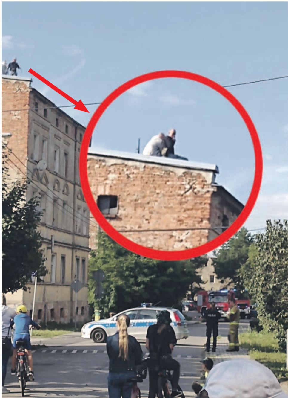
Do zejścia z dachu próbował przekonać 35-latek jego brat. Przyniósł mu piwo i papierosy... Ale to nie poskutkowało