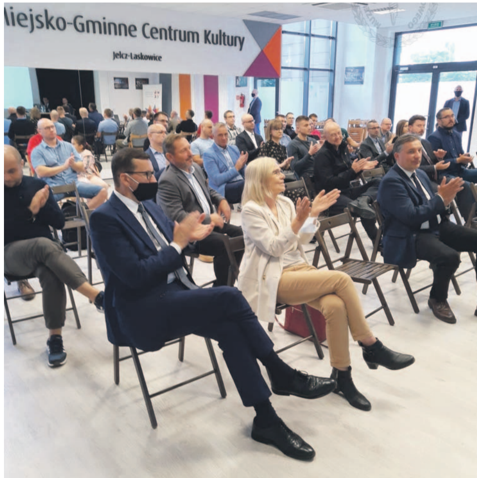
„II Laskowickie spotkanie z historią” wzbudziło duże zainteresowanie. Wśród gości był premier Mateusz Morawiecki