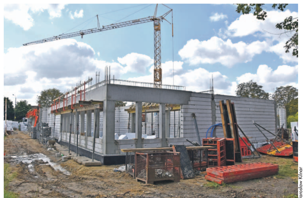
Nowe warsztaty szkolne mają już widoczne ściany parteru