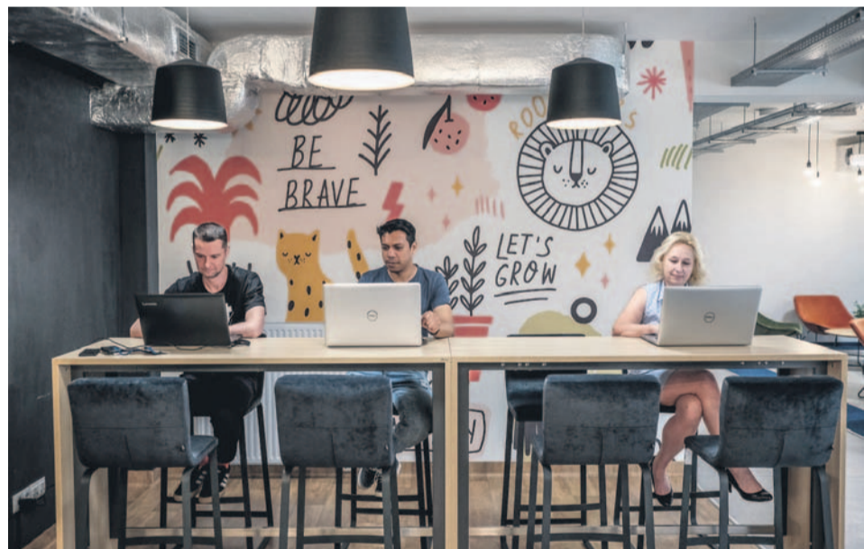
InQUBE przy Uniwersytecie Ekonomicznym we Wrocławiu pomaga przyszłym przedsiębiorcom rozwijać skrzydła