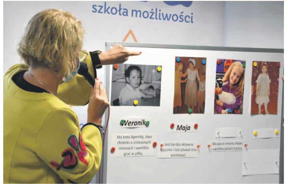
Na tablicy zdjęcia nauczycielek, zrobione w czasach młodości. Dzieci zgadywały, kto jest kim