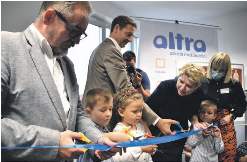
Wstęga przecięta, „Altra” otwarta