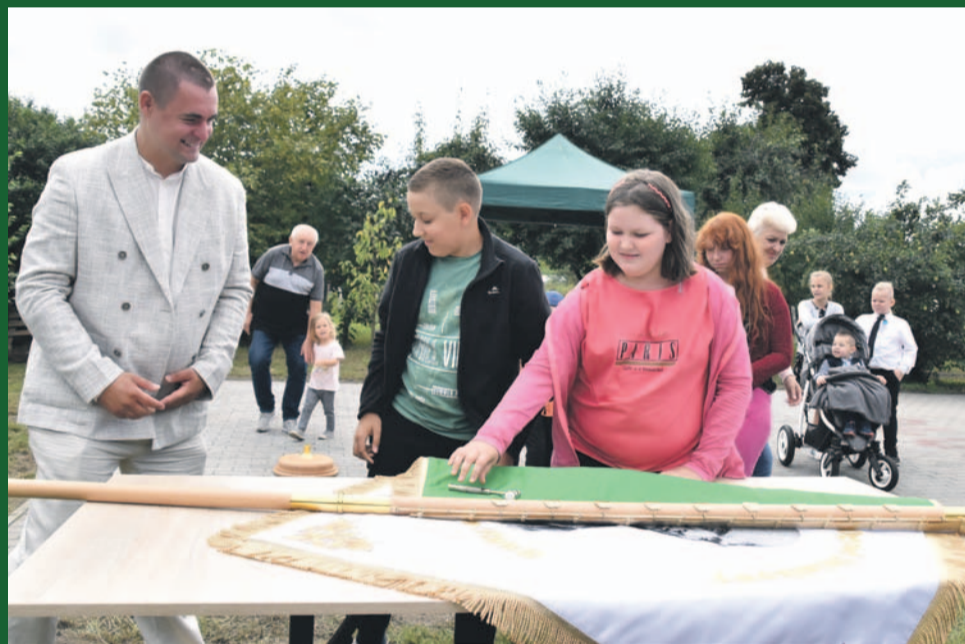
ROD im. Stanisława Staszica ma swój sztandar. W tej ważnej chwili uczestniczyły też dzieci, które mogły symbolicznie wbić pamiątkowe gwoździe