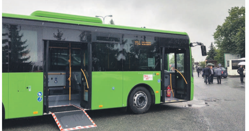
Nowe autobusy są dostosowane do potrzeb osób niepełnosprawnych i wózków