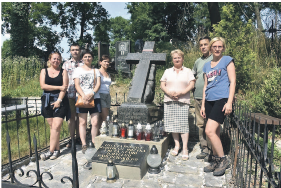
Uczestnicy akcji przy grobie rodziców Ignacego Jana Paderewskiego