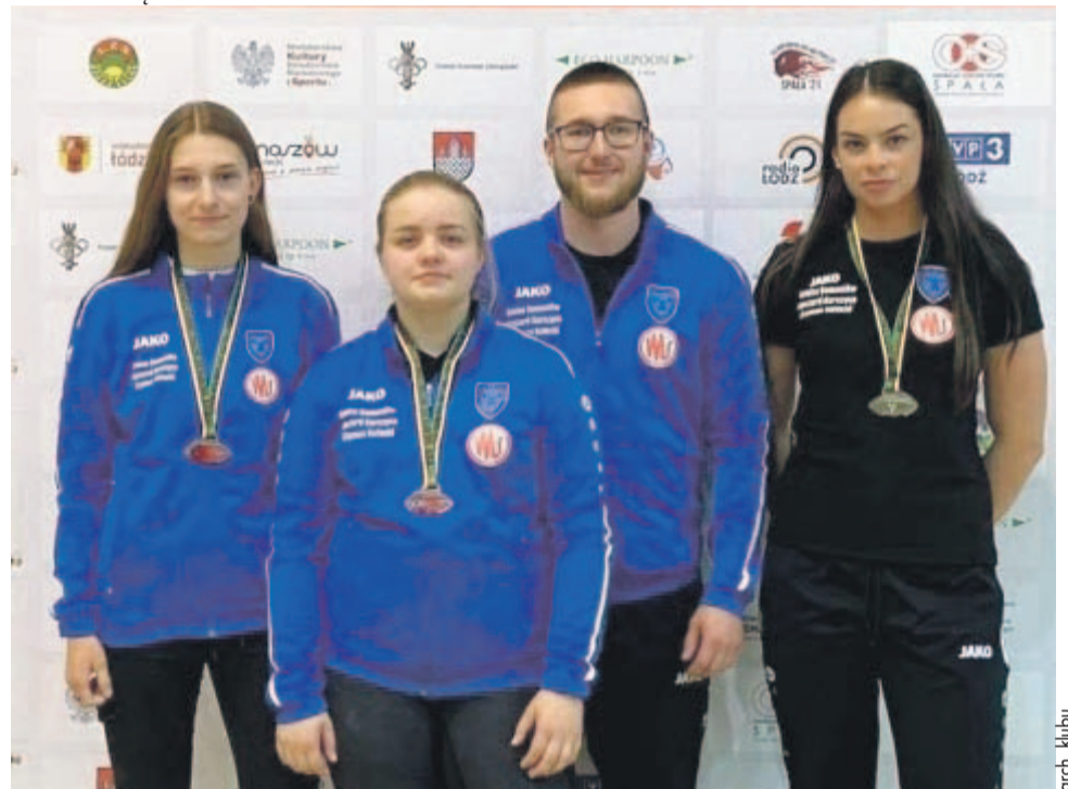
To był świetny występ w Spale