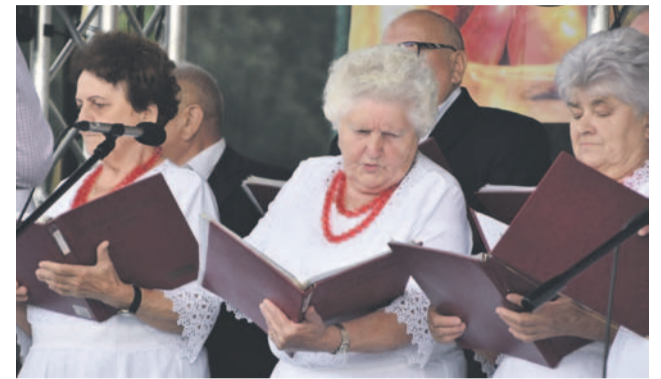
Na cenie nie zabrakło utalentowanych mieszkańców

Pełniący obowiązki wójta zdradził, że za miesiąc gmina przekaze strażakom-ochotnikom z Sobociska wyremontowaną remizę strażacką. Na ten cel przeznaczono około 1,7 mln złotych z rządowego funduszu inwestycji lokalnych. Mówił także o innych inwestycjach, m.in. o rozbudowie remizy w Owczarach, zakupie nowego samochodu