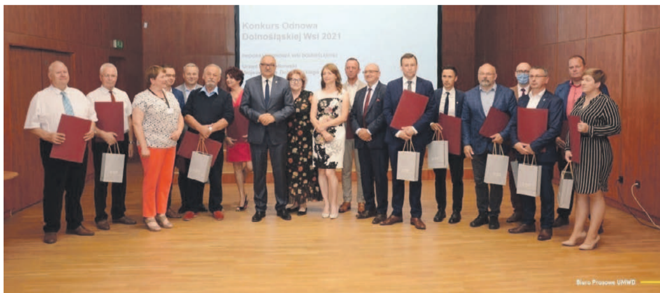
Każda promesa odebrana przez lokalnych samorządowców to realne pieniądze, które gminy przeznaczą na remont świetlic wiejskich, tworzenie placów zabaw, czy podnoszenie bezpieczeństwa na drogach.

Do gmin z powiatów oławskiego i wrocławskiego na bieżące utrzymanie urządzeń melioracji wodnych będących własnością danego samorządu lokalnego popłyną 2 dotacje celowe o łącznej wartości ponad 66 tys. zł. Ze wsparcia w tym roku skorzystają gminy Czernica i Siechnice.