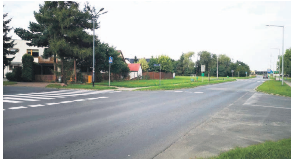
Skrzyżowanie Tańskiego, Chabrowej i Irysowej