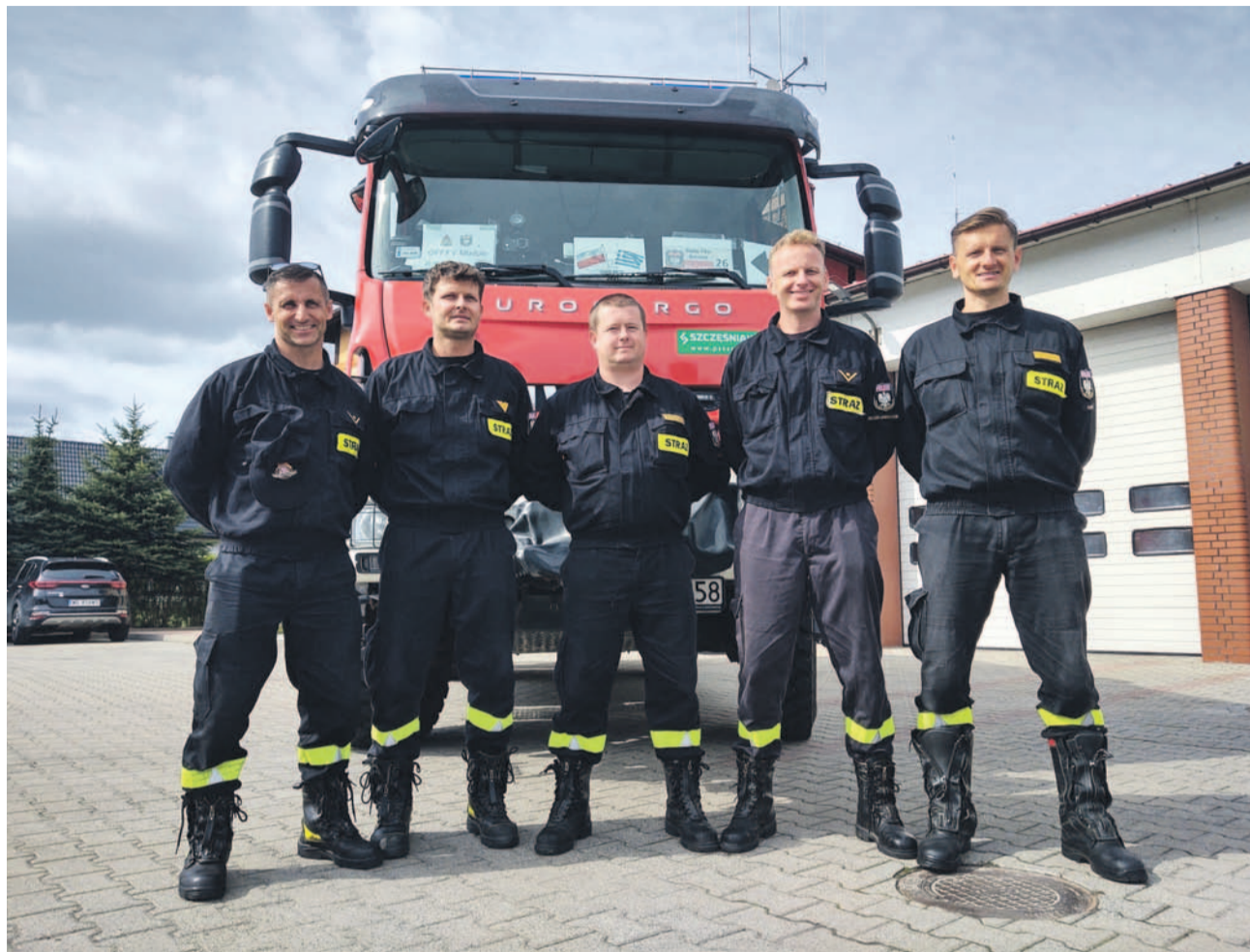
Pięciu strażaków PSP w Oławie, którzy wyjechali do Grecji gasić pożary jako druga zmiana, szczęśliwie wróciło do domu