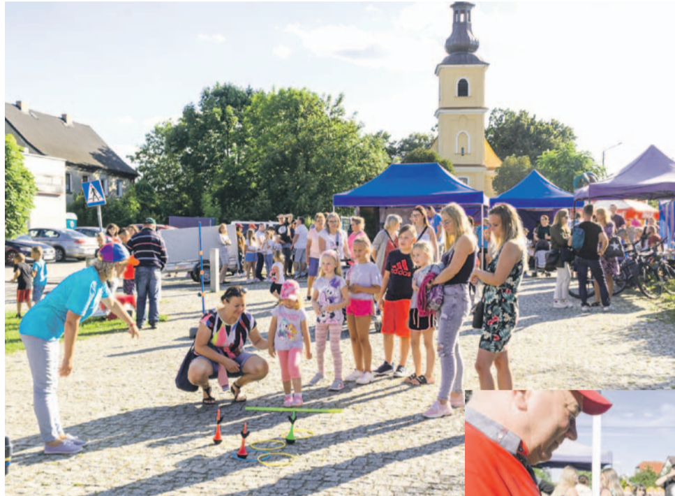
Bawili się wszyscy

dyś robiliśmy jeden duży festyn, który przez dwa dni potrafiło odwiedzić około 5000 osób... To była świetna forma promocji i pokazania się na zewnątrz... Teraz jednak stawiamy na lokalną integrację i bliższe spotkania wśród naszych mieszkańców, szczególnie zależy nam na