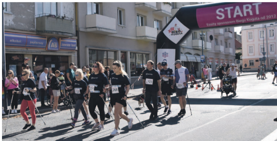
W biegu wzięli też udział kijkarze