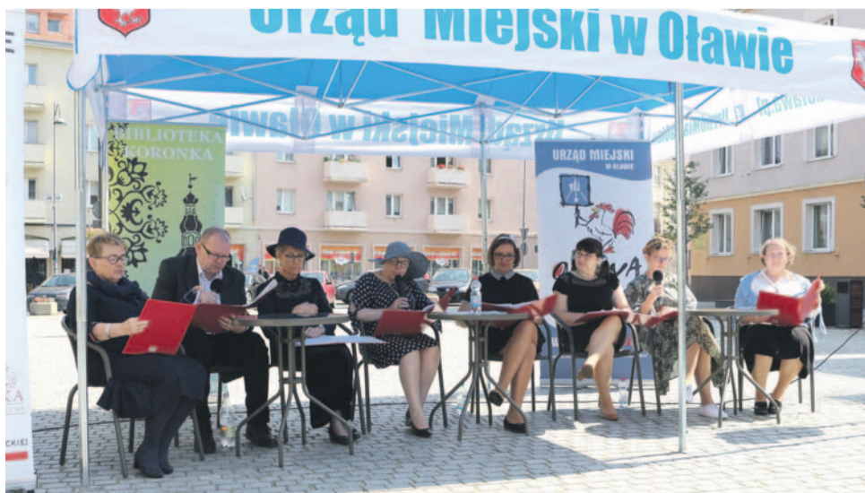
W tym roku pracownicy „Koronki” czytali „Moralność pani Dulskiej”