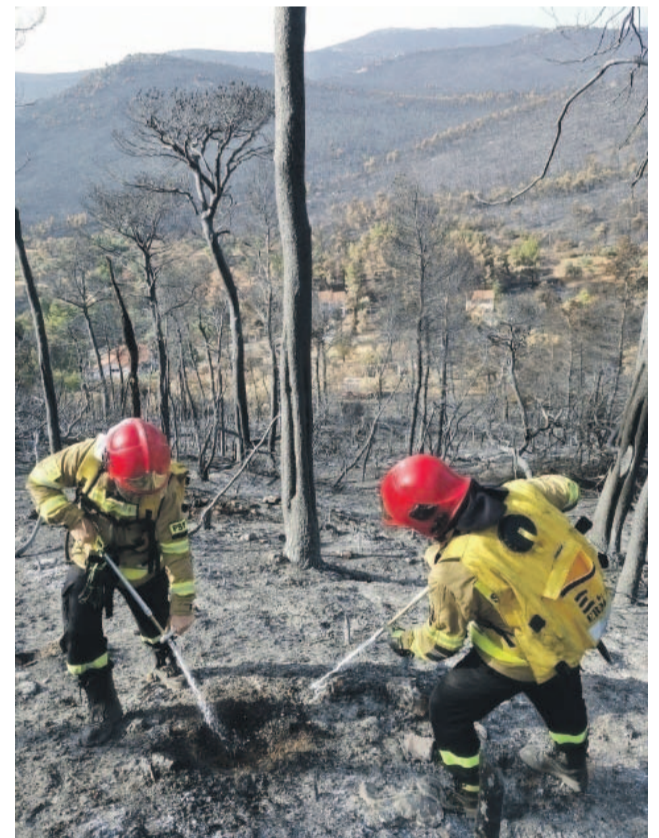
Ogrom i widok zniszczeń, jakie spowodowały pożary w Grecji, przeraża

w błyskawicznym tempie i w różnych kierunkach, więc cały czas trzeba było mieć oczy dookoła głowy i przygotowaną drogę ucieczki. Ich zadanie polegało głównie na dogaszaniu pożarów przy wykorzystaniu sprzętu podręcznego, w miejscach, gdzie wcześniej wodę zrzucano z helikopterów i samolotów gaśniczych. Brali też udział w wycinaniu pasów lasu, co miało zapobiec rozprzestrzenianiu się ognia na kolejne obszary. Do ich zadań należało też m.in. dogaszanie ściółki i zaopatrzenie w wodę śmigłowców gaśniczych. Dziś, patrząc z dystansem na misję, mówią, że było to dla nich duże wyzwanie, ale i ogromne doświadczenie. W Polsce nigdy dotąd nie mieli do czynienia z tak wielkim pożarem, przy tak dużym zalesianiu i w tak trudnym ukształtowaniu terenu. Nauka i doświadczenie nabyte w kraju wystarczyły jednak, by dobrze spełnili swoje zadanie i odnaleźli się w greckiej rzeczywistości.