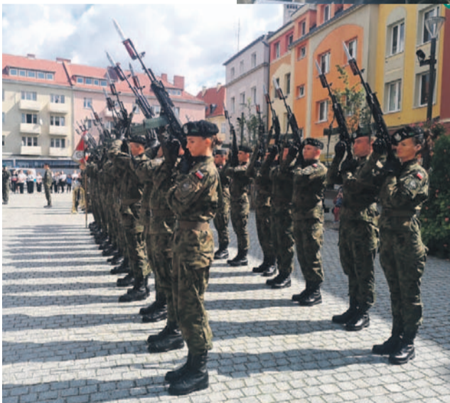
Nie mogło zabraknąć salwy honorowej, Apelu Pamięci i defilady wojskowej