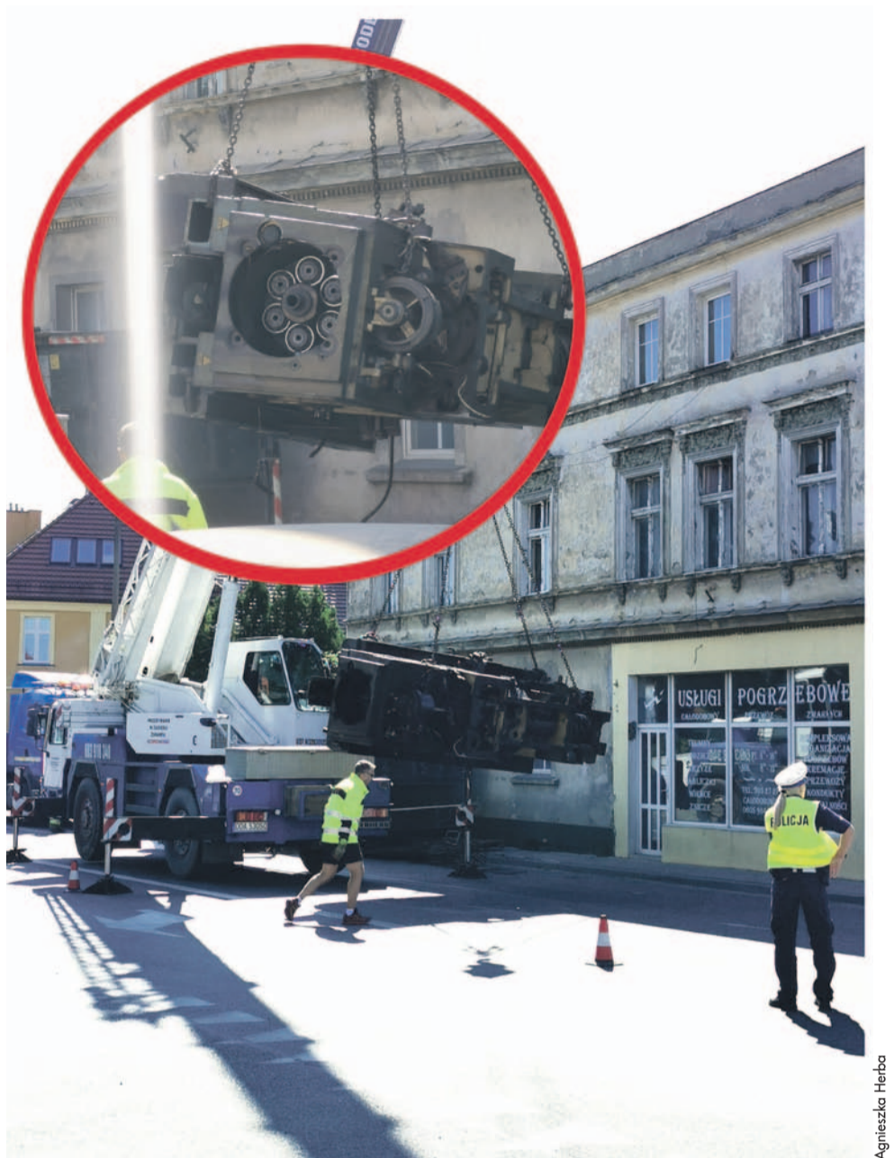
W kontenerze przewożono maszynę przemysłową. Żeby podnieść ciężarówkę, najpierw trzeba było przenieść ten wielki ładunek

Strażacy pomogli kierowcy wydostać się z pojazdu, wyciągając go z kabiny przez okno w dachu. Zabrało go pogotowie, miał ranę głowy, ale nie ucierpiał poważnie. Ciężarówka uszkodziła fragment kamienicy, która ma być wyburzona, ponieważ w tym miejscu planowana jest budowa ronda. Przechodnie,