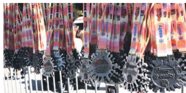
Medale w kształcie wirusa miały być sposobem na oswojenie wroga

nych kategoriach odbyła się oławskim stadionie. Tam też wśród wszystkich rozlosowano nagrody - pralkę oraz trzy zegarki.