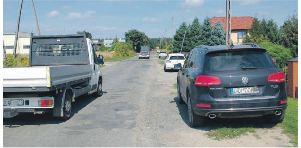
Droga jest ruchliwa, a chodnika nie ma

- Szanowni Państwo, mieszkańcy Miłoszyc, Dziupliny oraz Wszyscy, którym zależy na dobru i bezpieczeństwie szczególnie pieszych i rowerzystów - mieszkańcy naszej gminy Jelcz-Laskowice! 15 września 2019 roku złożyłem do Starostwa Powiatu Oławskiego (zarządca) wniosek o budowę chodnika pieszo-rowerowego w pasie ulicy Dziuplińskiej (droga powiatowa) od ronda w Miłoszycach do miejscowości Dziuplina. Niestety, z przyczyn finansowych do inwestycji nie doszło. W tym roku także zamierzam taki wniosek złożyć, gdyż uważam, że taka inwestycja jest konieczna!