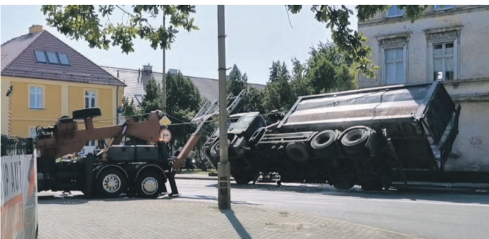
Akcja trwała kilka godzin, ale samochód udało się postawić za pierwszym podejściem