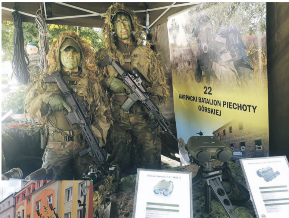
Dzień Kombatanta to nie tylko przeszłość - bo kto chciał, mógł poznać np. współczesne uzbrojenie Karpackiego Batalionu Piechoty

Ribbentrop-Mołotow w sierpniu 1939 roku nasi sąsiedzi ze wschodu i zachodu postanowili uczynić Polskę jedynie pojęciem historycznym. Polskę, która dała światu tylu wybitnych ludzi, bez których trudno sobie wyobrazić bieg dziejów w Europie. W tej wojnie zginęło ponad 6 mln obywateli Polski, śmierć poniosło około 215 tys. polskich żołnierzy, zaś 120 tys. nie wróciło z niewoli. W gruzach legły miasta, zniszczeniu uległo 65% zakładów prze-