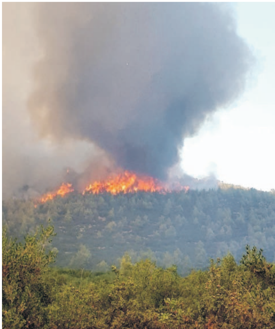
Zmienny i silny wiatr powodował, że ogień szybko się rozprzestrzeniał