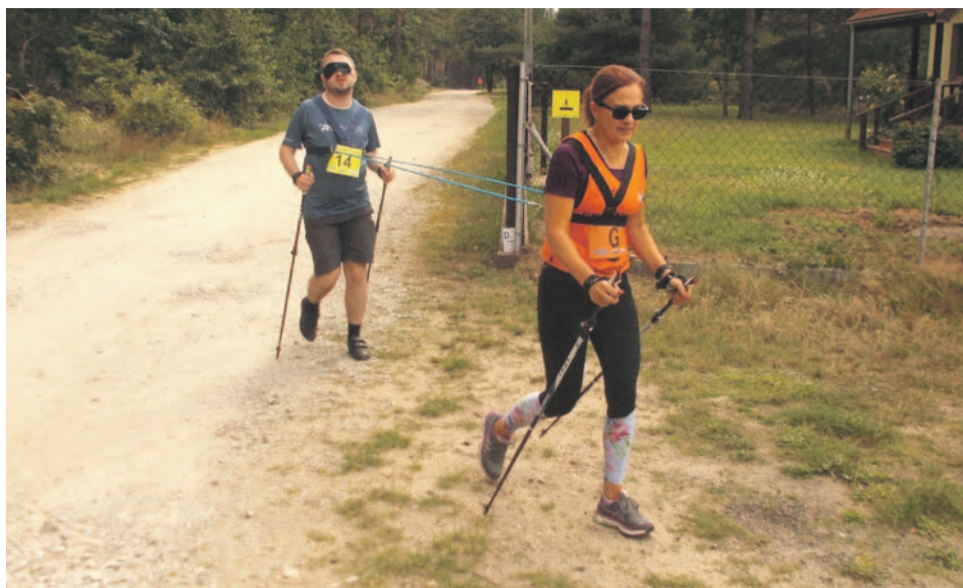
Zastanawialiście się, jak niewidomi radzą sobie w nordic walking? Właśnie tak

Pierwszego dnia zawodnicy startowali indywidualnie w ramach Pucharu Polski na trasie o długości 5,1 km. Drugiego dnia rywalizowali w sztafecie, w ramach Drużynowych Mistrzostw Polski. To szczególnie ciekawa konkurencja, ponieważ drużyna musiała być mieszana (jeden mężczyzna i dwie kobiety lub jedna kobieta i dwóch mężczyzn). Każdy z trzech etapów miał inny dystans, pierwszy etap był najdłuższy, drugi najkrótszy, a trzeci średni. Razem ponad 7 km. Na każdym skrzyżowaniu leśnych ścieżek dyżurował sędzia. Oprócz wskazywania drogi, sędziowie mieli zadanie pilnować techniki maszerowania nordic walking. Mogli zwracać uwagę na niedociągnięcia techniczne i doradzać w tym zakresie. Musieli także zwracać uwagę na nadużycia takie jak podbieganie, potrącanie i zabieganie. Za określone przewinienia