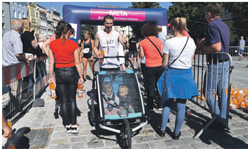
Niektórzy biegacze zabrali na trasę także swoje dzieci