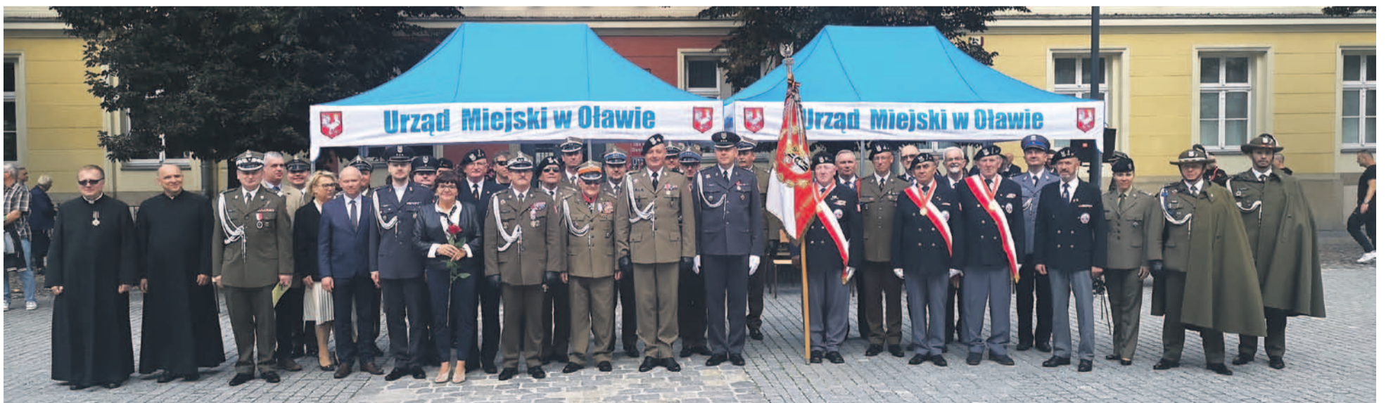
Wspólne pamiątkowe zdjęcie