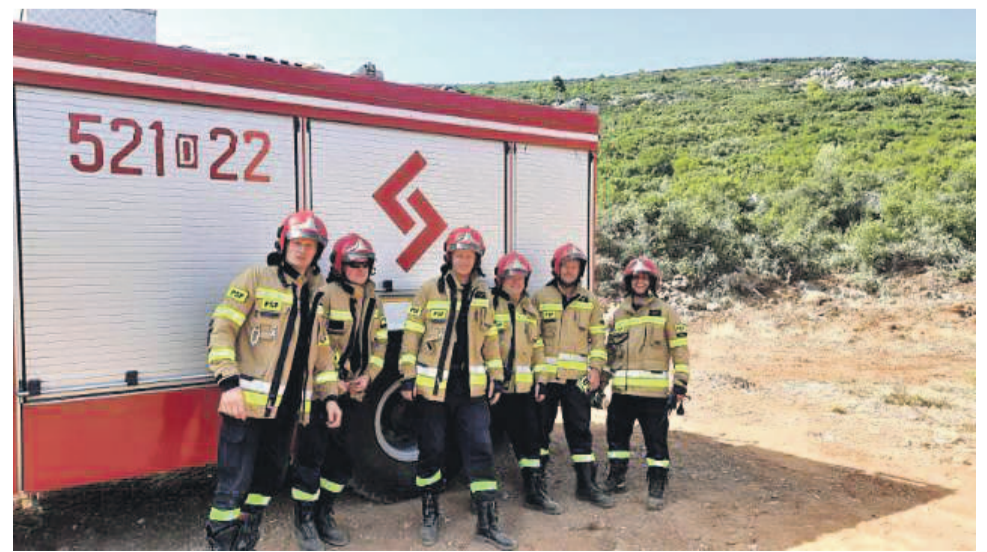
Oławscy druhowie przed wyjazdem na jedną z akcji