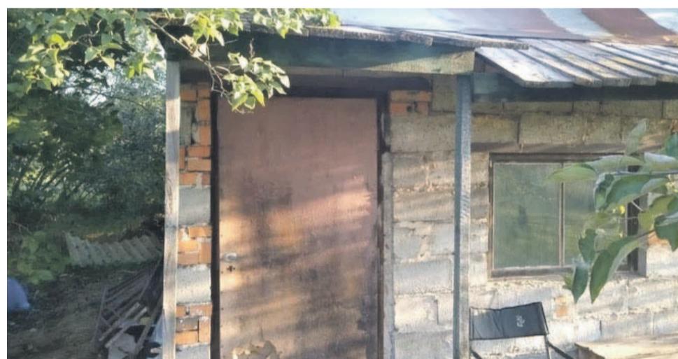
Obecnie mieszka w takim domu