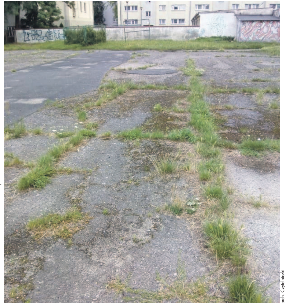
Teraz teren jest mocno zaniedbany, tutaj nie da się bezpiecznie pograć w kosza

Potwierdza to również naczelnik Wydziału Gospodarki Komunalnej, Mieszkaniowej i Ochrony Środowiska. - Sposób zagospodarowania terenu przy ul. 1 Maja był już wielokrotnie podnoszony przez mieszkańców - informuje Bogusław Jazienicki. - Czekamy na określenie przeznaczenia (np. parking, plac zabaw, tereny zielone czy inne...) przez sąsiadujące wspólnoty, aby wspólnie podjąć działania inwestycyjne. Takie próby