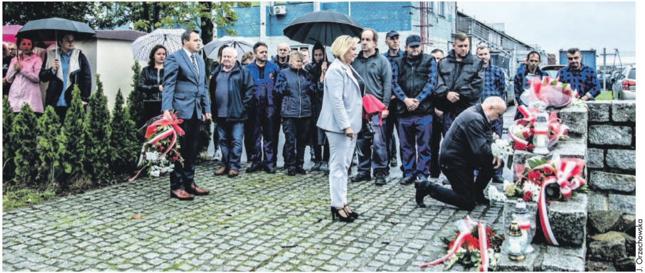
Pogoda nie dopisała, ale upamiętniono rocznicę