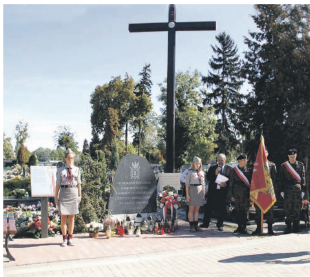
17 września odbędzie się doroczna uroczystość z okazji Dnia Sybiraka

TEKST I FOT.: KAMIL TYSA ktysa@gazeta.olawa.pl