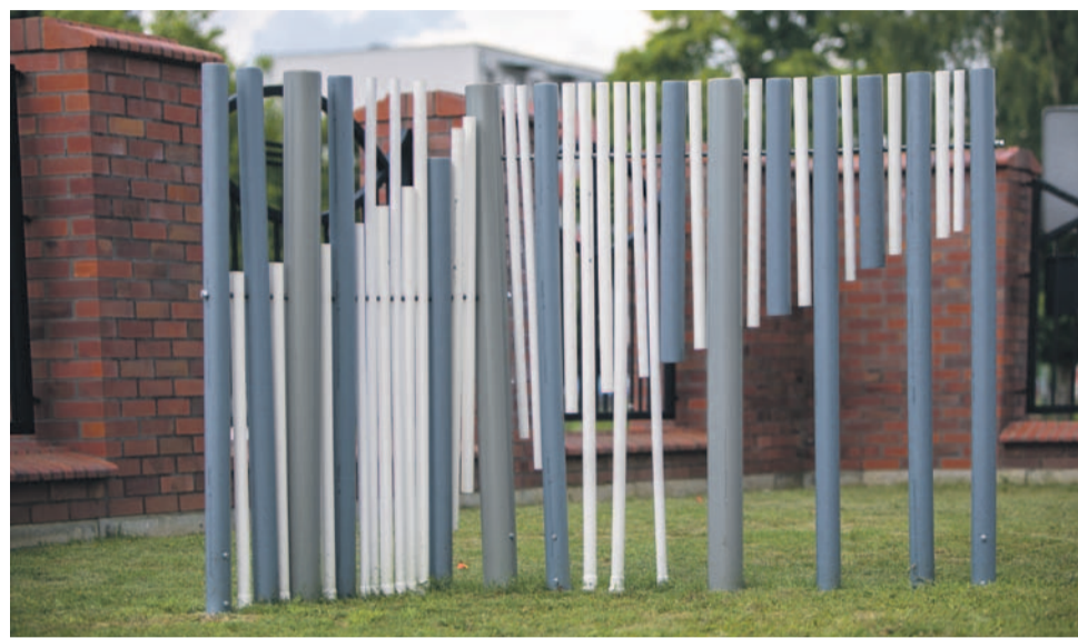
To także część wystawy

Nie minęło dużo czasu od powstania pomysłu, gdy zaproszeni do projektu lokalni artyści rozpoczęli realizację swoich wizji. Wszystkie dzieła szybko stanęły na swoich przeznaczonych miejscach. W sumie sześć instalacji. Większość z nich zbudowana jest z rur PP (100% recyklingowego plastiku) od lokalnych producentów i dystrybutorów. Pozostałe są wykonane z metalu. Każda z nich pokazuje odrębny charakter i styl artysty. Możemy zobaczyć m.in. instalację zawierającą elementy grające, obejmujące zagadnienia z zakresu wytwarzania fal akustycznych i syntezy dźwięku, nietypową kombinację metaloplastyki i florystyki, a także inne aero-