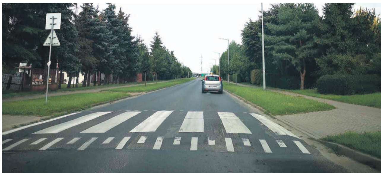
Jeden z takich progów zwalniających może zniknąć w przyszłym roku

ekonomicznej. Remonty tych przejść rozpoczną się jeszcze w tym roku. Zaczniemy od tego na strefie, a potem - prawdopodobnie pod koniec roku - przejdziemy do tego obok targowiska. Musimy obrać taką kolejność ze względu na trwającą budowę ronda. Nie możemy ludziom rozgrzebywać objazdu. Na zakończenie obu inwestycji mamy czas do czerwca 2022 roku, więc mam nadzieję, że sprawę przejścia na strefie zakończymy szybko, a ulicami Bożka i Chabrową zajmiemy się tuż po oddaniu ronda. Złożyliśmy też dwa kolejne wnioski. Chodzi o przebudowę Tańskiego z Bożka, tam gdzie budowaliśmy łącznik, a także o skrzyżowanie Tańskiego z Chabrową i Iry-