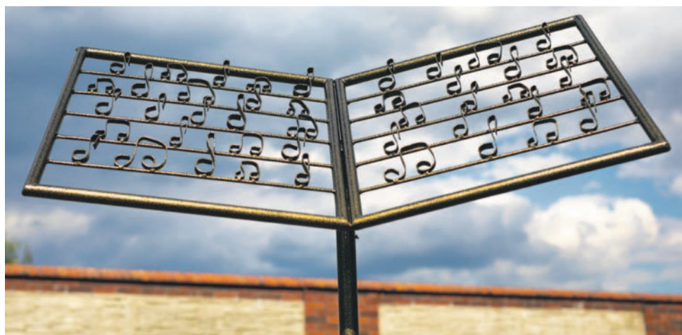
M.in. taką instalację można zobaczyć przy kościele pw. Maksymiliana Marii Kolbego

Sponsorzy główni wystawy „Aerofony”: firma Dyka oraz PSB Mrówka. Sponsorzy festiwalu: Elica, Italmetal, Ronal Group, Spółdzielnia Mieszkaniowa Lokatorsko-Własnościowa.