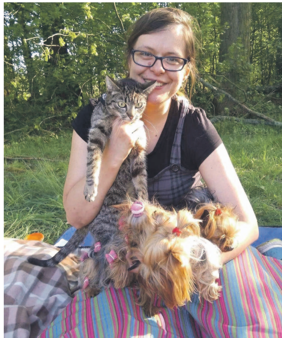
Przez całe życie prawdziwie kocha zwierzęta

W czerwcu ze względu na ciągle problemy związane z wynajmem mieszkania i ciężką sytuacją finansową zdecydowała, że już nie chce wynajmować niczego, że jest tym już okropnie zmęczona i nie ma siły ciągle pracować głównie po to, żeby płacić za wynajem w sytuacji, gdy potrzebujemy środków na badania i leczenie. Zdecydowała się wraz ze swoimi zwierzętami, które były często największym sensem jej życia, wrócić do domku na malutkiej działce, którą posiada. Mieszka tam od lipca.