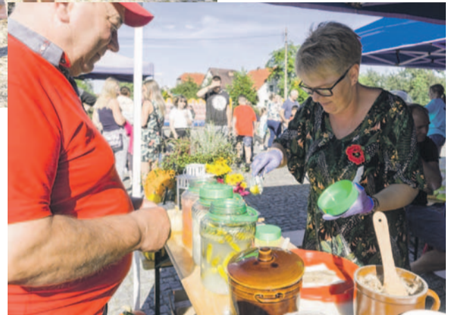
Ogórki, smalec, miody... Co kto chce

Podczas festynu nie zabrakło także dobrego jedzonka - zwłaszcza pyszności od