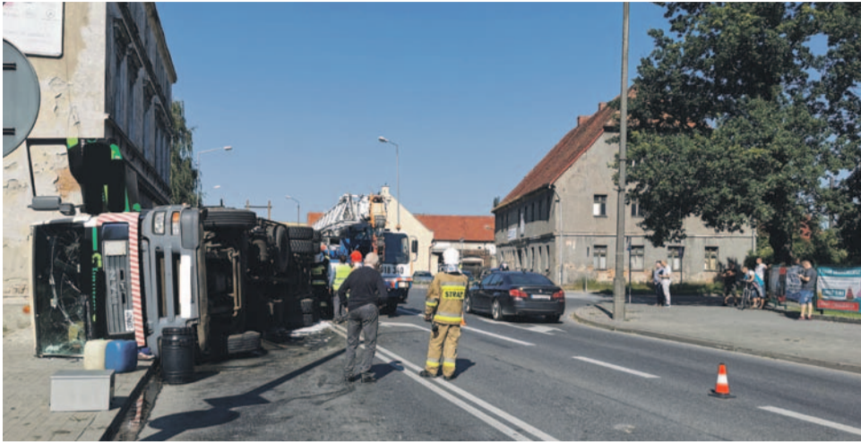
Ciężarówka przewróciła się na chodnik, uszkadzając kamienicę. Na szczęście nikt nie zginął