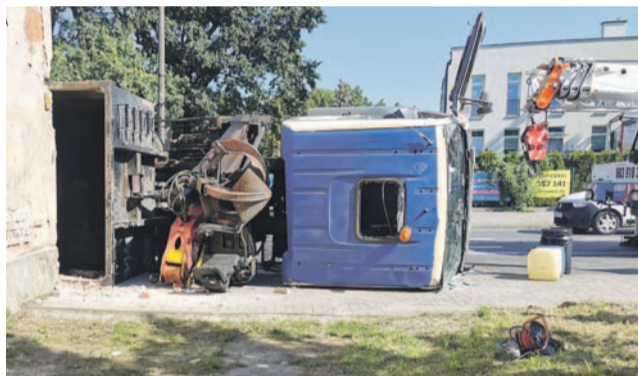
Kierowcę wyciągnięto przez okno w dachu

Jak do tego doszło? Według relacji świadków inne auta zatrzymały się, aby samochód ciężarowy mógł wyjechać z ulicy Lipowej (od strony przedszkola). Kierowca chciał szybko opuścić skrzy-