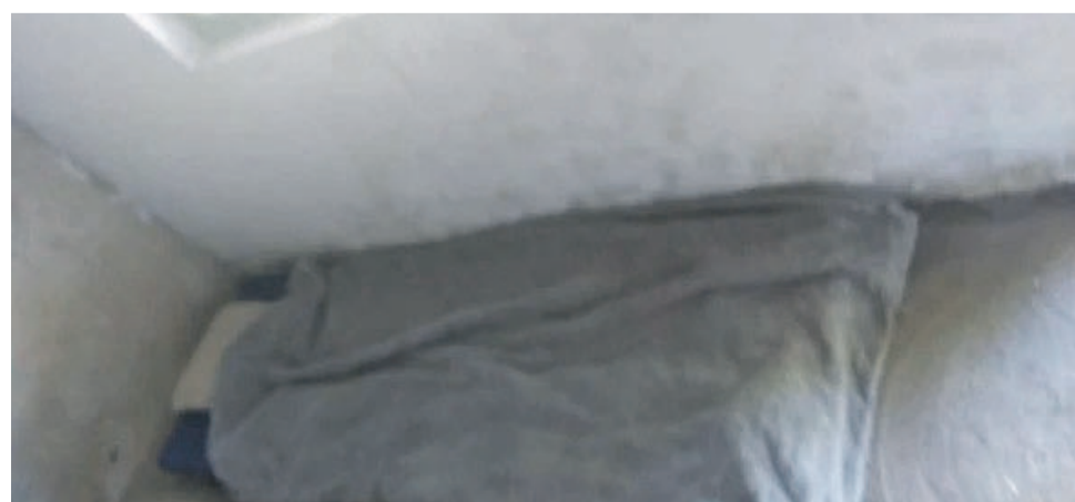
W takich warunkach