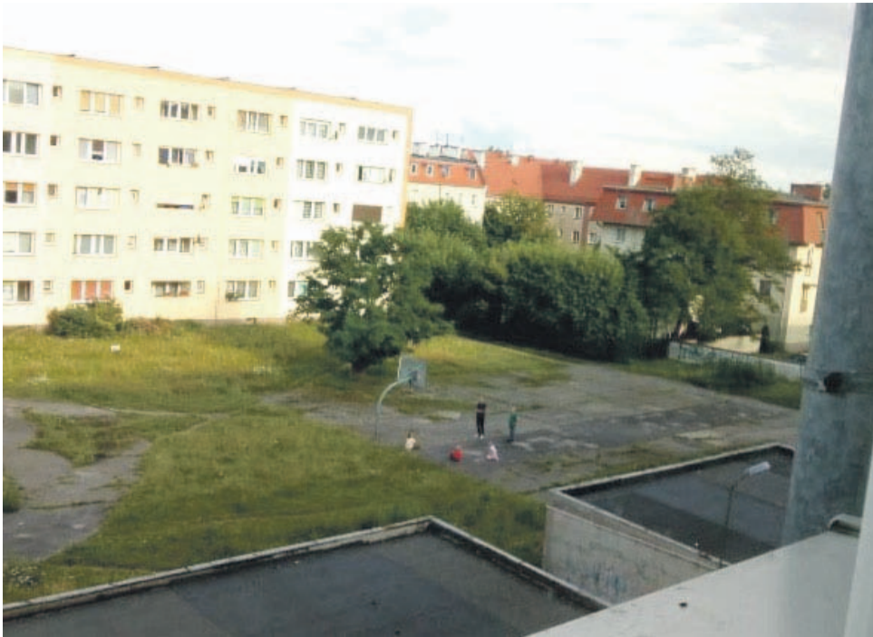
Na co przeznaczyć ten teren przy 1 Maja - boisko czy parking? Mieszkańcy wciąż nie mogą się dogadać. Miasto zrealizuje tę inwestycję, którą wybiorą