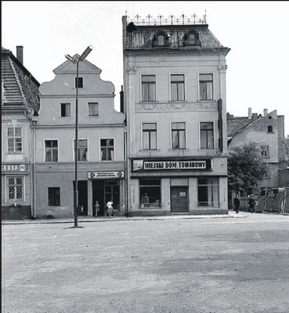
To zdjęcie zrobiłem w 1966 w Rynku. Wówczas był to plac 27 Stycznia. To pierzeja wschodnia Rynku, widzimy budynek, w którym mieści się Wiejski Dom Towarowy. Nie ma już krat w witrynach, ale są na drzwiach (na zdjęciu słabo widoczne). Ostatnio był tam Bank, dziś kamienica jest zamknięta. Na pierwszym planie widzimy starą nawierzchnię, jaka była na placu. Lekko na lewo widzimy słup oświetleniowy, na którym są dwie lampy, a w nich były długie rury świetlówki. Po prawej stronie widzimy ul. Bartosza Głowackiego - na pierwszym planie jest ogrodzenie, bo trwa budowa budynku, w którym na parterze przez lata był sklep Rolnik. W głębi widać budynek przy ul. B. Głowackiego, w którym wtedy jeszcze mieszkali ludzie. Dziś tego budynku nie ma, w tym miejscu stoją pawilony z pieczywem i mięsem