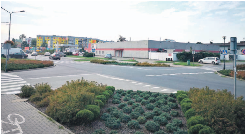
Skrzyżowanie ulic Chabrowej, Bożka i Targowej