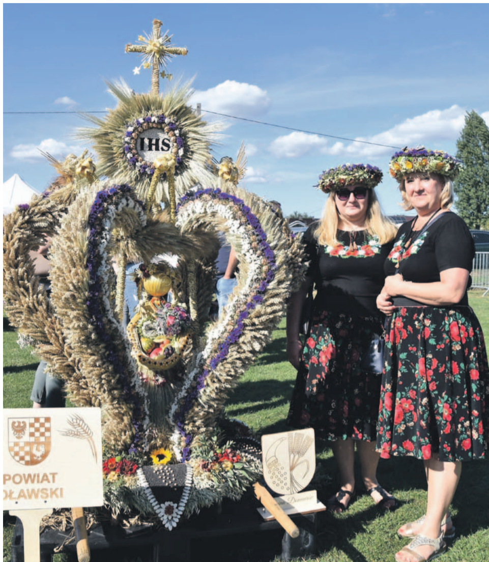
Wieniec z Domaniowa zajął III miejsce w konkursie