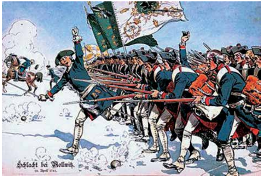
1740–42 (I wojna śląska), 1744–45 (II wojna śląska), 1756–1763 (III wojna śląska).

Wobec odparcia ataku Bawarczyków i Francuzów na Wiedeń Fryderyk, nie chcąc pozwolić na umocnienie się Habsburgów, znowu zaatakował. Klęski wojsk cesarskich pod Dobromierzem (Hohenfriedburg) i Kotliskami (Kesseldorf) zmusiły cesarzową do przełknięcia goryczy pokoju drezdeńskiego w 1745 roku, który potwierdzał ciężkie warunki wcześniejszego pokoju wrocławskiego.