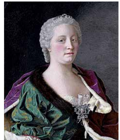
Maria Teresa Habsburg

Wszystko to działo się pod bokiem pruskiego króla, który przemieszczał się ze