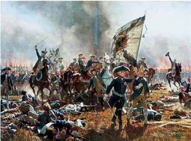
Bitwy w ramach wojen śląskich były niezwykle krwawe i wyniszczające strony konfliktu

wzięty do niewoli i odesłany do Czech. W końcu sierpnia 1757 roku ponownie przemieszczały się wojska pruskie od Zgorzelca, przez Lubań i dalej do Gryfowa i znaczna część oddziałów ponownie przeciągnęła przez Olszynę. Jeszcze w tym roku pojawili się znowu Austriacy. Wiosną następnego roku wyparli ich Prusacy. Każda z armii naturalnie ponownie nakładała na mieszkańców kolejne obciążenia wojenne. W październiku 1758 roku zatrzymał się w Lubaniu na kwatery sam król. Stąd posyłał oddziały swojego brata księcia Henryka w kierunku Gryfowa i dalej pod Jelenią Górę, aby oczyszczać okolicę od Austriaków. Pruskie oddziały grenadierów prowadziły działania wojskowe do marca 1759 roku, gdzie pod Rząsinami doszło do większej potyczki, w której wzięto jeńców wraz z rannym pułkownikiem.