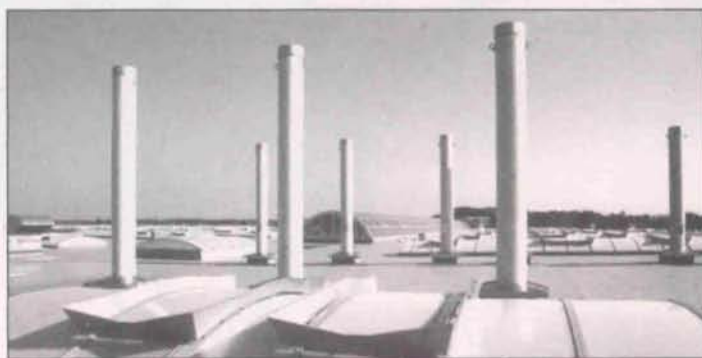
Tak wygląda dach fabryki i kominy, który nie dymią.

wych przed przedostaniem się substancji ropopochodnych zastosowano szereg zabezpieczeń. Wszystkie powierzchnie posadzek w zakładzie wykonano z wodoszczelnego betonu, zbiorniki z olejem i emulsją usadowione zostały na wannach stalowych. Wszystkie zbiorniki, w tym również podziemne do przechowywania metanolu i oleju napędowego, zostały zaopatrzone w czujniki, które sygnalizują najmniejszy choćby wyciek.