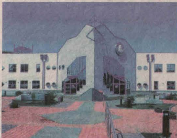
Obiek Aquaparku, naprzeciwko (obecnie atrakcji) Polkowic, powstanie hotel o wysokim standardzie