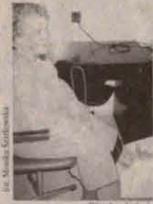
W trakcie badania

Badania przeprowadzane były w przychodni przy ul. Skalników w Polkowicach i Przychodni Rejonowej w Przemkowie. Osteoporoza głównie atakuje kobiety w okresie przekwitania, ale statystyki dowodzą, że coraz częściej dotyka ludzi młodych. Badanie gęstości kości odbywa się metodą suchą (kość piętowa), jest to metoda ultradźwięko-