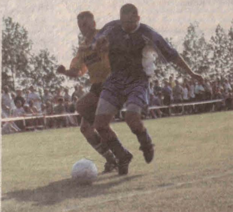
Górnicy w akcji

Druga liga już jest, polkowicki szkoleniowiec jest pełen pokory w stosunku