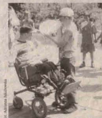
Radwanice. Dmuchanie w balonik

Festyn z okazji Dnia Dziecka odbył się w Kłobuczynie. Wystąpiły zespoły wokalo-