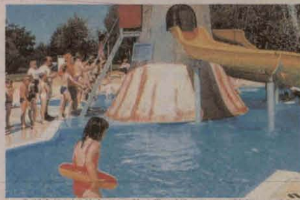
Boiska dla dzieci w komplecie basenów przy ul. 3 Maja. W przyszłości czy ten teren stanie się także centrum piknikowe

przetarg na wyłonienie wykonawcy. Przetarg będzie skierowany do największych firm światowych. Chcemy, bowiem, aby powstało coś napraw-