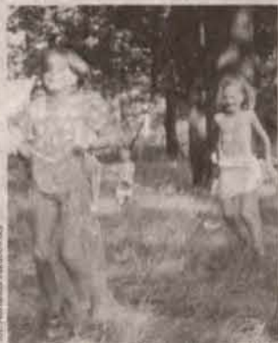
Nowa Kuznia. Wyciąg w workach

Radwanicka młodzież wykazała się inicjatywą, poczynawszy od przygotowania zabaw po prowadzenie imprezy. Dzieci bawiły się wspaniale, chętnie brały udział we wszystkich konkurencjach, śpiewały i tańczyły. Były darmowe kielbaski, losowanie nagród, a w przerwach przygrywał zespół Kormorany.