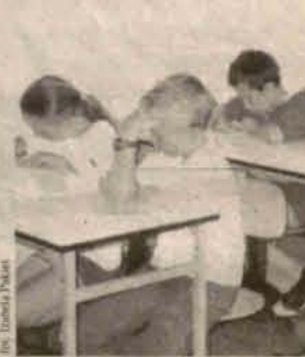
Zagranie z ortografią

W Szkole Podstawowej w Grębocicach odbył się II etap konkursu ortograficznego dla klas IV-VI i VIII "Zostań mistrzem ortografii". Z ortografią zmierzali się najlepsi z poszczególnych