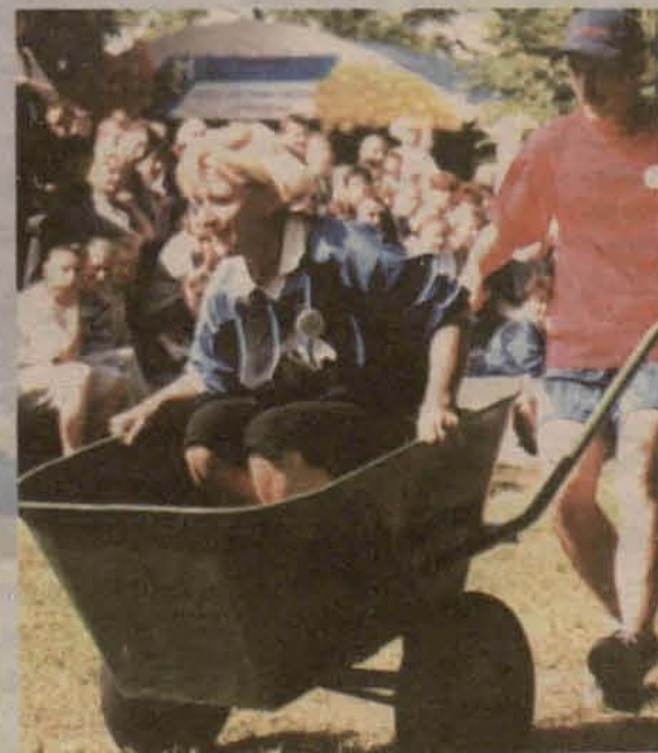
Tekst Barbara Reszczyńska

Anja Orthodox to utalentowana, otwarta i pełna energii wokalistka zespołu Closterkeller.