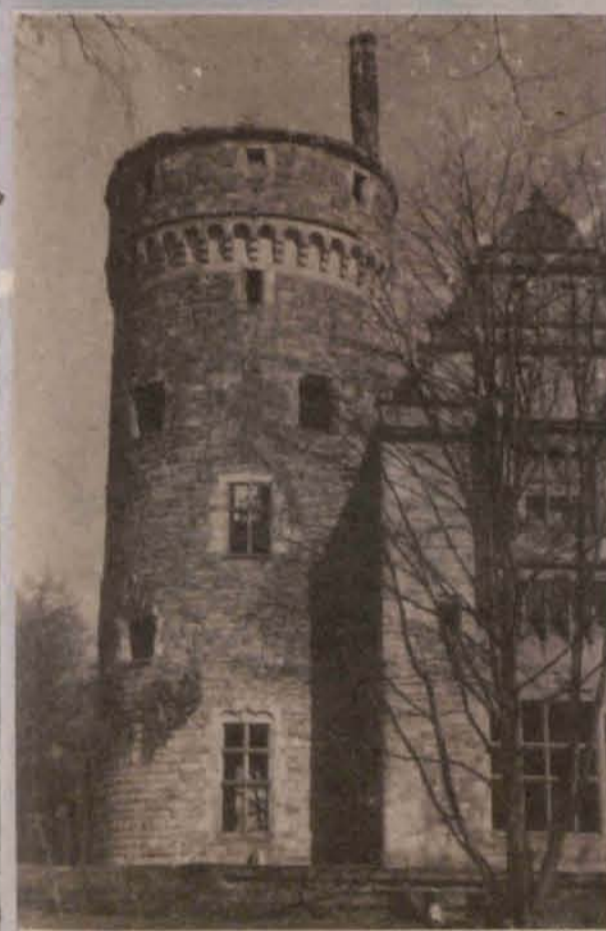
Złagocze i katedra E. Cipury

kowie pierwsze telefony. Gorzej było z komunikacją. Do czasu wybudowania pierwszej linii kolei żelaznej (1891 r.), podróżowano... pocztowym dylżansem. Nieco wcześniej jednak, budując "stary" zamek odkryto tajemniczy tunel