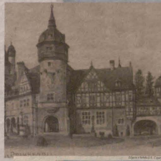
Złagocze i katedra E. Cipury

Zbudowany na fundamentach starego, nowy zamek ze swoimi wieżami i balkonami przykuwał wzrok z każdej strony. Swoją "warowną" charakter zawiązywał projektantowi - dworskiemu radcy budowlanemu von Hline.