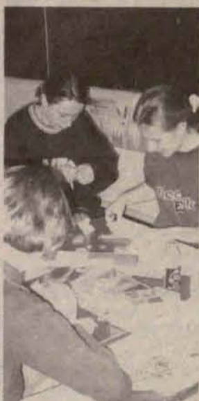
Uroczyste otwarcie klasy

Rok szkolny 1999 - 2000 w szkole podstawowej w Buczynie (gm. Radwanice), był rokiem przełomowym. We wrześniu SP w Buczynie została powiększona o budynek dawnej szkoły filialnej w Sieroszowicach, gdzie mieściły się dwie klasy. Okazało się, że z powodu niedostatecznej liczby dzieci, szkoła w Sieroszowicach zostanie zlikwidowana, a klasy przeniesione do Buczyny. Natomiast nie kończą się losy samego budynku oś-