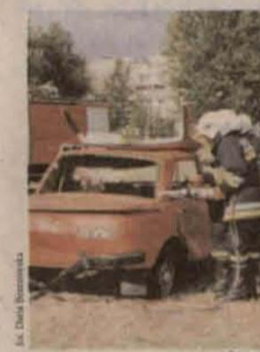
Sobota w akcji

się bardzo interesująco. Niestety, szalejąca ponad trzy godziny ulewa "zmyła" nadzieje na realizację planów. Z zapowiadanych pozycji zaprezentowana została tresura psów policyjnych, koncert orkiestry dętej z Grębocic, pokaz ratownictwa górniczego oraz straży pożarnej z Polkowice.