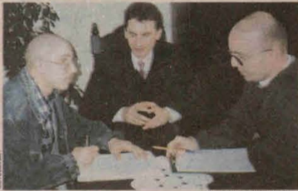
Rozmowa z Burmistrzem Przemkowa

można zatrzymać. Koniec lat 80-tych był w Przemkowie początkiem procesu likwidacji miejsc pracy. Dwa lata temu padł ostatni zakład przemysłowy - Zakłady Metalurgiczne. Od pewnego czasu jednak obserwowujemy proces tworzenia nowych firm (m.in. Zakład Produkcji Dachów z Trzcin). Aktualnie tworzone miejsca pracy są stabilne. Wspominałem już o tym, że na bazie zlikwidowanego ZGKiMu powstała spółka. Jest tam 45 stanowisk pracy. Aby przyciągnąć innych inwestorów gmina oferuje ulgi w podatku od nieruchomości. Zamierzamy też uczestniczyć w targach Invest City i zaprezentować tam naszą ofertę.