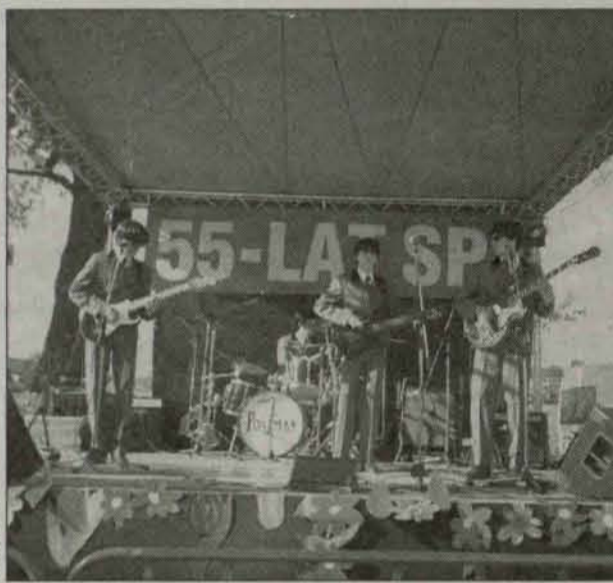
Publiczność szalala podczas występu zespołu Postaman

Szkoła Podstawowa im. Kornela Makuszyńskiego w Gaworzycach była organizatorem festynu pod hasłem „Spotkanie po latach”, zorganizowanego z okazji 55 - lecia szkoły. Przed południem na boisku gminnym bawiły się głównie dzieci. Dla nich przygotowano gry i zabawy.