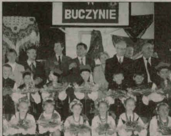
Parlamentarzyści w otoczeniu uczniów Szkoły Podstawowej w Buczynie