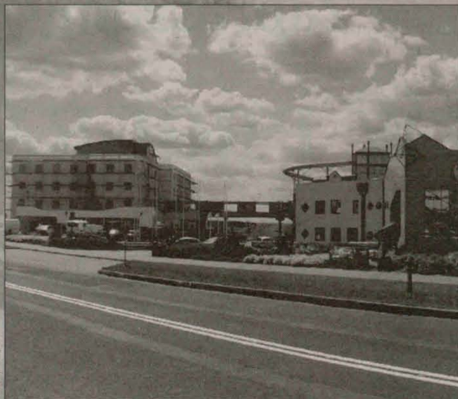
Prace wykończeniowe korytarza łączącego hotel z Aquaparkiem