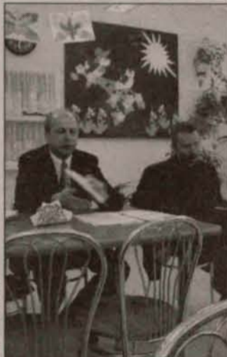
Planowanie Dnia Dziecka

Turnieje odbędą się 9 czerwca o godz. 14 na osiedlowych boiskach sportowych. Porozumienie dla Mieszkańców Polkowic