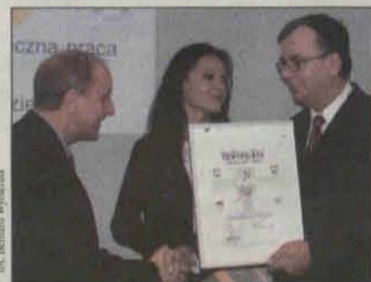
Fosroc Ksante najpierw zdobyła jeden certyfikat, teraz ma już