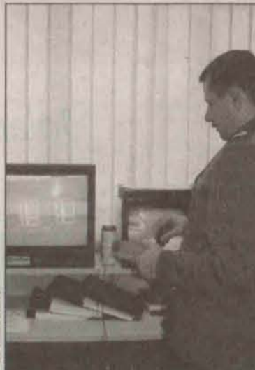
Monitoring pomaga w wykryciu przestępstw

Głównymi przyczynami wypadków drogowych było niedostosowanie prędkości pojazdów do warunków panujących na drodze oraz nieudzielenie pierwszeństwa przejazdu.