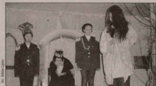
Jaselka w wykonaniu dzieci

Dla przybyłych do Domu Kultury gości wystąpiły zespoły "Gaworzanki", "Dawidenka" z Koźlic i kapela z Jaczowa. Podczas występu tej ostatniej zrobiło się biesiadnie. Kilka par,