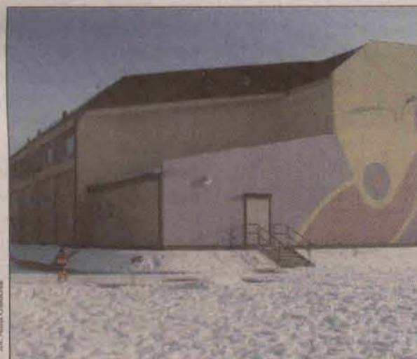
Jej standart zdecydował, że to właśnie tu odbędzie się Mecz Gwiazd

Spotkaniu będzie towarzyszyć szereg imprez. - Dodatkowymi atrakcjami będą m.in. występy koszykarzy na wózkach inwalidzkich, orkiestry górniczej - zdradza Krzysz-