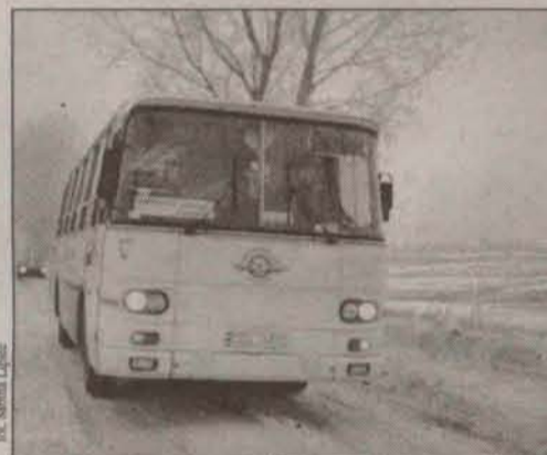
Niby dawno śnieg nie padał, ale...

W budżetach powiatów i gmin w całej Polsce brakuje