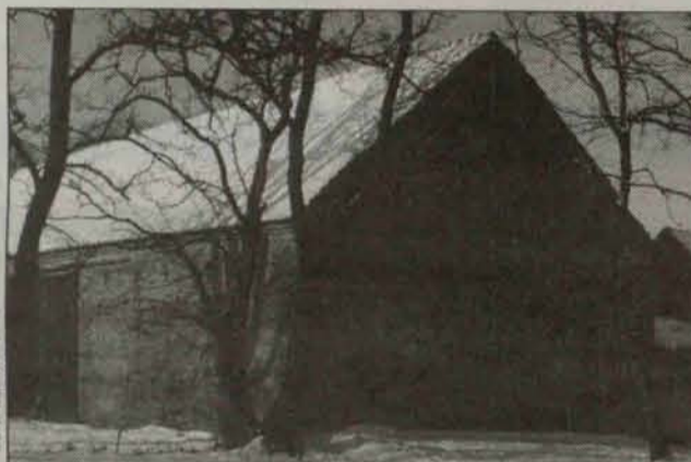
Budynki, takie jak ten, mogą przestać szpecić za sprawą inwestorów

Gminie Gaworzyce udało się zbyć kilka kolejnych nieruchomości będących własnością gminy. Dochód z ich sprzedaży wzbogacił budżet samorządu.