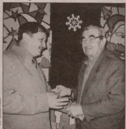
Lamanie się oplatkiem

Zarząd Koła Gminnego Związku Kombatanów RP i Byłych Więźniów Politycznych w Grębocicach zorganizował spotkanie oplatkowe z przedstawicielami władz gminnych. Na posiedzeniu podsumowano miniony rok oraz działalność koła.