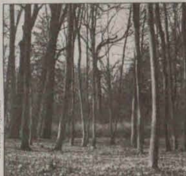
Il. Jeremiasz Wydział

Druki wniosków dostępne są w Wydziale Ochrony Środowiska w Starostwie Powiatowym w Polkowicach oraz w Urzędach