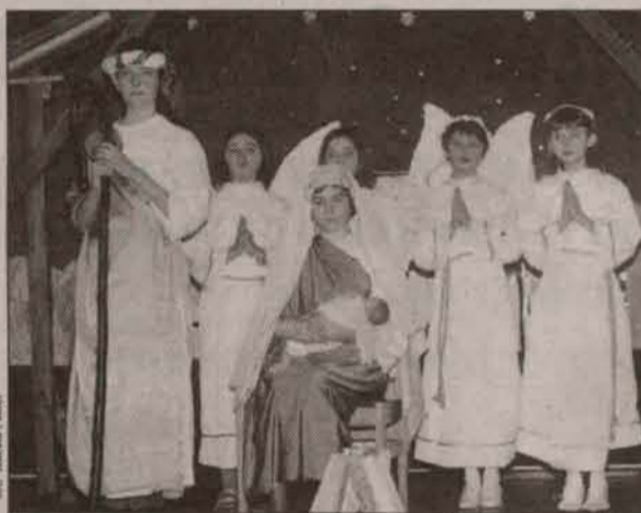
Podczas występu dzieci

Organizatorem VI Przeglądu Zespołów Kolędniczych i Jasełkowych po raz drugi był Gminny Ośrodek Kultury w Grębocicach. Patronat nad imprezą objął Związek Gmin Zagłębia Miedziowego.