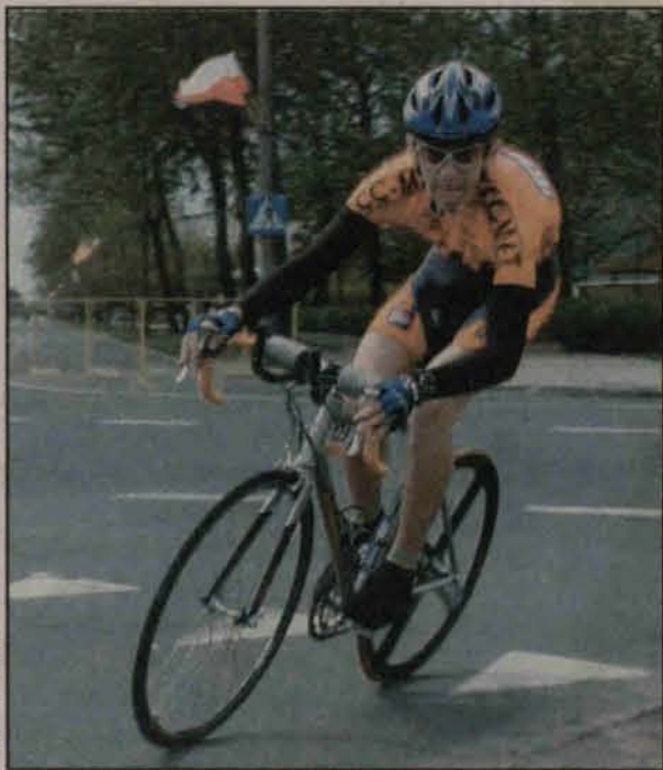
Kolarze CCC Polsat wjechali do I dywizji