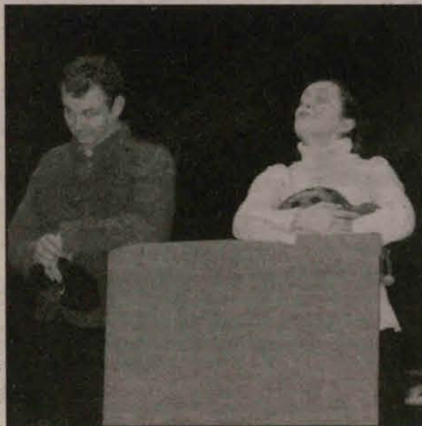
Aktorzy teatru lubuskiego