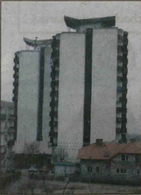
Bloki przy ulicy Hubala

Własność spółdzielcza obowiązywała do roku 2000, kiedy to prawicowy parlament znowelizował po raz pierwszy ustawę o spółdzielczości, znosząc instytucję własności spółdzielczej. Lokatorom zabrano możliwość zdecydowania o tym, czy wolą własność spółdzielczą, czy odrębną, wielu dopatrywało się w tym wówczas