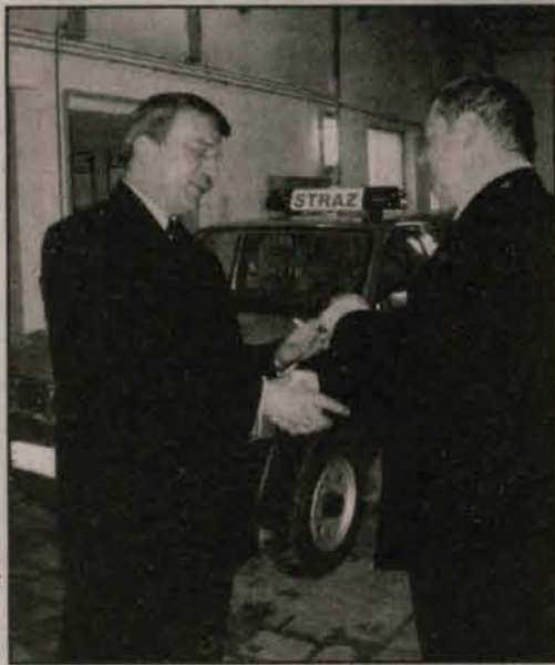
Uroczyste przekazanie kluczyków.

Powiatowa Komenda Straży Pożarnej w Polkowicach stała się bogatsza o nowy samochód operacyjny marki Nissan. Bogatsza stała się również jednostka Ochotniczej Straży Pożarnej w Radwanicach. Od zeszłego tygodnia w remizie stoi nowy samochód marki Polonez.