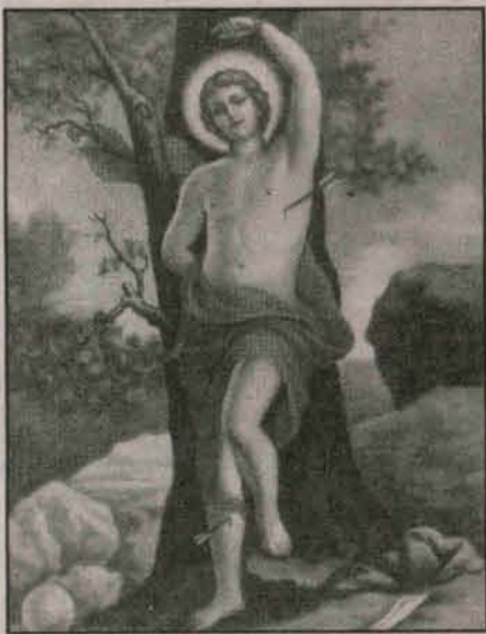
Podobizna św. Sebastiana.

Patronem Polkowic jest święty Sebastian. Pod koniec VI wieku na terenie naszego miasta wybuchła epidemia dżumy, która pochłonęła wiele śmiertelnych ofiar. Nikt nie potrafił zapobiec rozprzestrzenianiu się tej straszliwej choroby. Zdesperowani mieszkańcy postanowili zwrócić się o pomoc świętych.