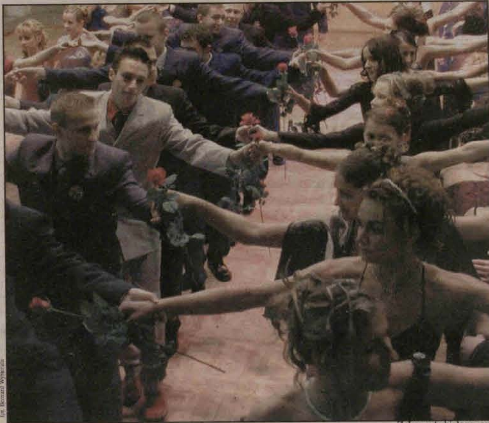
Zabawa do białego rana