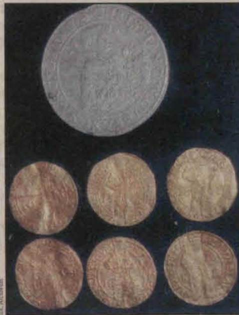
Odzyskano już 18 monet

Już 18 zabytkowych monet udało się odzyskać polkowickiej policji. Przypomnijmy, robotnicy podczas prac w Przemkowie znaleźli gliniany garnek z dukatami niderlandzkimi, ale nie zgłosili tego odpowiednim organom.