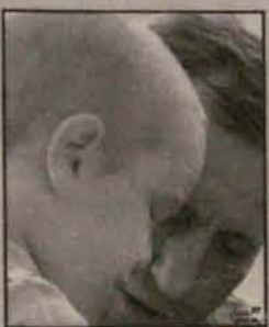
Święto naszych dziadków