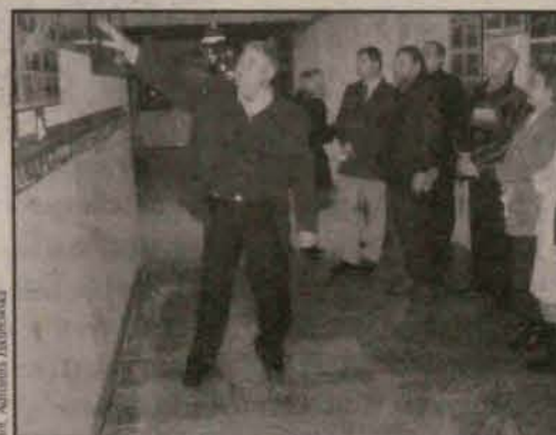
Radni zapoznali się z programem promocji wsi