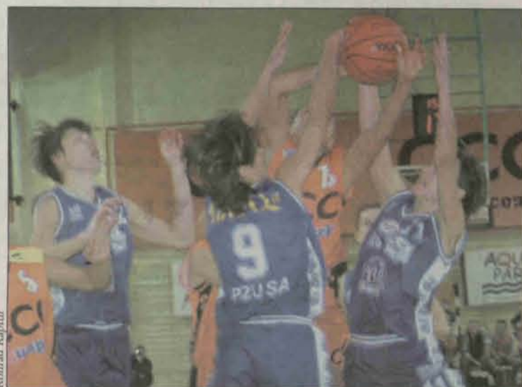
W tym meczu nikt nie odpuszczał nawet na moment.