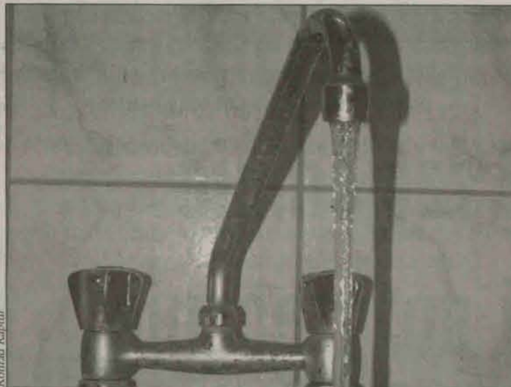
Woda z polkowickich kranów będzie droższa, pomimo tego że gmina nadal dopłaca gospodarstwom domowym spore kwoty.

- Za metr sześcienny ścieków od 1 lutego będziemy płacić 4,27 zł. Na tę cenę składają się takie czynniki jak: podatek od nieruchomości - 79 groszy, amortyzacja zmodernizowanej oczyszczalni ścieków - 1,56 zł, energia - 21 groszy. Do tego dochodzą jeszcze opłaty środowiskowe, wynagrodzenia, koszty przedsiębiorstwa, materiały. Gmina dopłaca do metra sześciennego ścieków 1,13 zł.