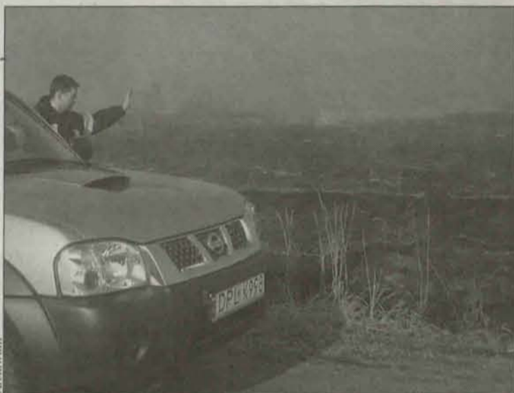
Jeden ze strażaków na miejscu pożaru

- Przez cały czas ktoś do nas dzwonił informując o tym, w którą stronę rozprzestrzenia się pożar. Te wiadomości okazały się bardzo przydatne w zwalczaniu ognia, który widoczny był z