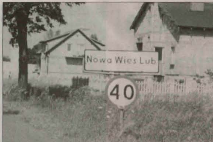
Nowa Wieś Lubińska

Od stycznia Nowa Wieś Lubińska należy do gminy Polkowice. Nie jest to jednak debiut tej miejscowości w obrębie naszej gminy, bo do 1974 roku Nowa Wieś należała do Polkowic.