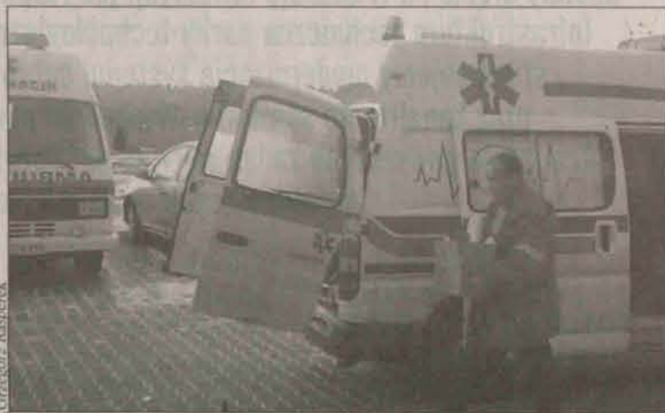
W trakcie przeprowadzki.

Od nowego roku pogotowie ratunkowe mieści się w siedzibie Centrum Powiadomienia Ratunkowego przy ulicy Polnej. Dzwoniąc pod numer 112, 998 czy 999 od razu informujemy obie służby ratownicze - straż pożarną i pogotowie ratunkowe. Jeśli będzie taka potrzeba, dyspozytor CPR skontaktuje się również z policją.