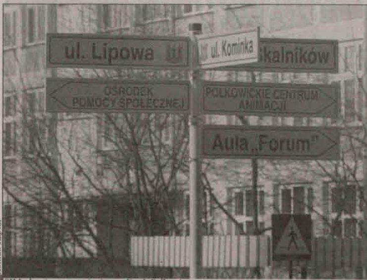
SIM ułatwia poruszanie się po ulicach Polkowic.

Tablice wykonane zostały zgodnie z obowiązującym w większości krajów europejskich oznakowaniem - czerwone napisy wskazują drogę do urzędów i instytucji samorządowych, niebieskie do obiektów usługowych i rekreacyjnych, na czarno napisane są nazwy ulic. Inwestycja kosztowała 16 635 złotych.