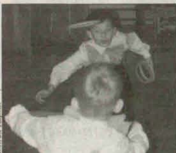
... a umiejętności sprawowały w osłupienie.