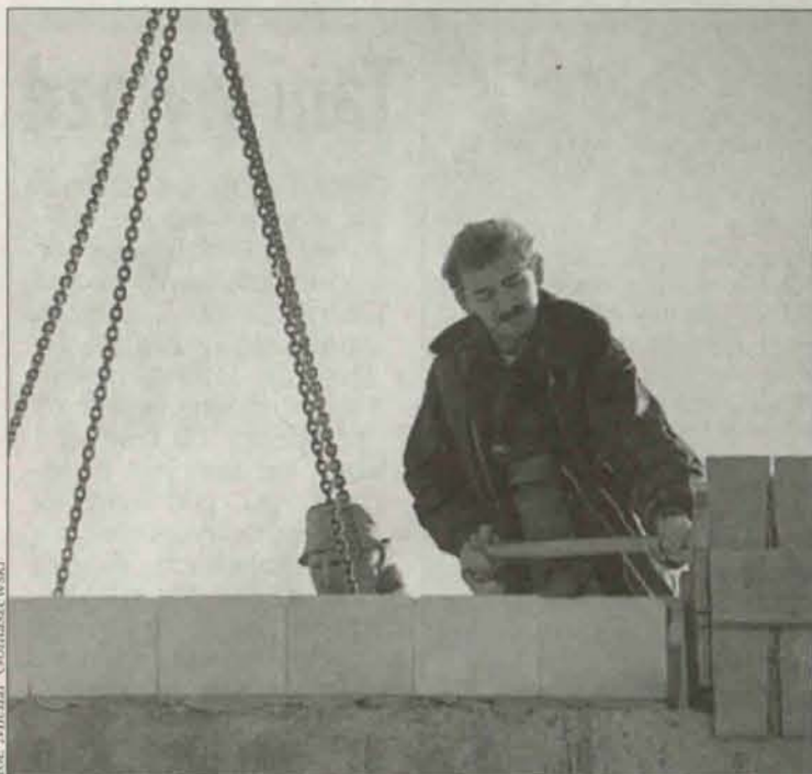
Pieniądze wydane na budowę dodatkowych wzmocnień nie będą jednak opodatkowane

Dochody z tytułu odszkodowań za szkody górnicze w 2003 roku zostały decyzją ministra finansów zwolnione z podatku. Tym samym cofnięto wcześniejszą decyzję, właśnie z 2003 roku, na mocy której podatek wprowadzono.