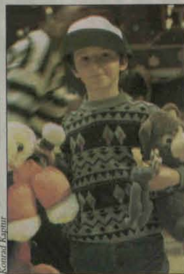
Dzieci kochają pluszowe misie

W tym roku udało się pozyskać sponsorów. Polkowskie Centrum Animacji ufundowało bilety wstępu na spotkania teatralne dla dzieci, Aquapark przekazał na ręce dzieciaków bilety uprawniające do bezpłatnego korzystania z wodnych uciech, jakich w ofercie obiektu jest wiele, natomiast supermarket Champion zapewnił dostawę smakołyków, dzięki czemu moż-