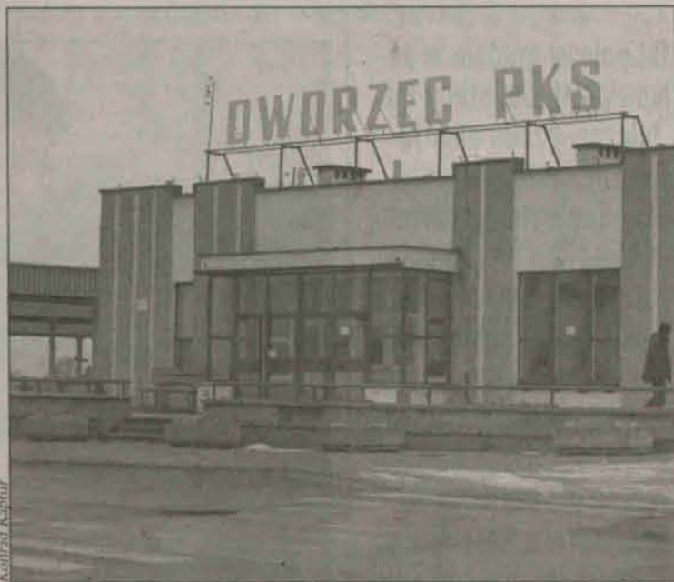
Zamiast dworca ma powstać centrum usługowo - handlowe

24 lutego odbędzie się przetarg, którego przedmiotem będzie sprzedaż budynku byłego dworca PKS. Termin składania ofert upływa cztery dni wcześniej, czyli 20 lutego. Znajdujący się obok budynku plac manewrowy pozostaje w gestii gminy, nadal będą podjeżdżać tutaj autobusy i busy.