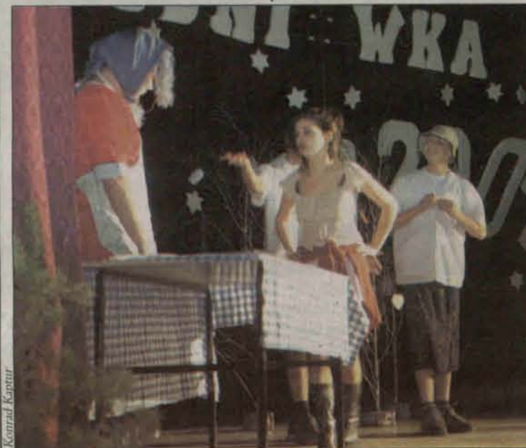
Uczniowie klasy IVa zaprezentowali współczesną wersję "Kopciuszka"

swoich domów, a także od swoich znajomych, rodzin. Dominowały zabawki oraz ubrania. Po przerwie świątecznej zebrane rzeczy ułożono na parkiecie w Zespole Szkół formując z nich przepiękne słońce, które zajęło prawie cały parkiet. Następnie, 22 stycznia zaproszono dzieci na uroczyste zakończenie szlachetnej akcji, by zabrały ze sobą rzeczy zalegające na parkiecie. Wszyscy przybyli goście mogli obejrzeć przedstawienie przygotowane przez uczniów klasy IV a ukazujące współczesną wersję klasycznej bajki o Kopciusz-