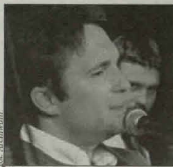
Hrabi podczas występu