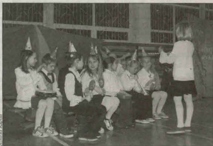
Pomysłowość dzieci przeszła wszelkie oczekiwania...

Na cyrkowej arenie swoje umiejętności prezentowali treserzy dzikich zwierząt oraz clowni. Każdy z zespołów świetlicowych uczestniczących w przeglądzie wykazał się