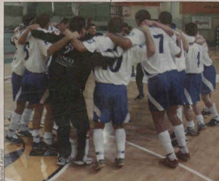
Ekipa Jango Mysłowice cieszy się po zwycięstwie nad Cuprum