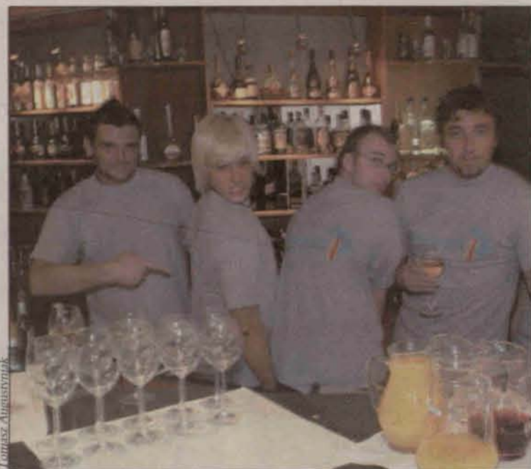
"Barowicze" za barem restauracji w Aqua Hotelu