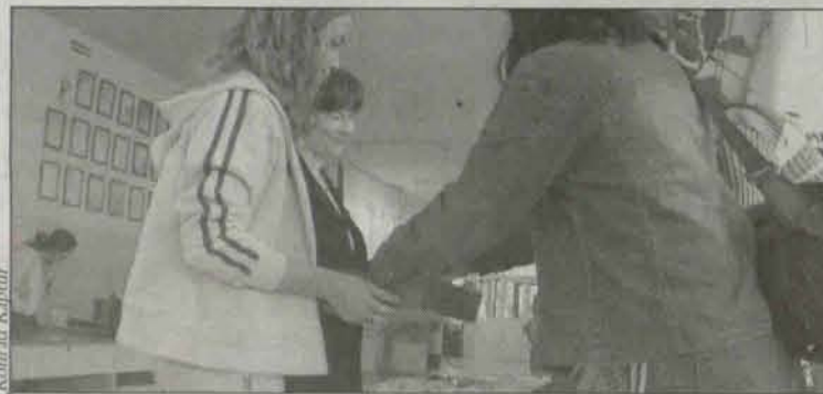
Podczas kiermaszu pyszności uczniowie sprzedawali upieczone przez siebie ciasta