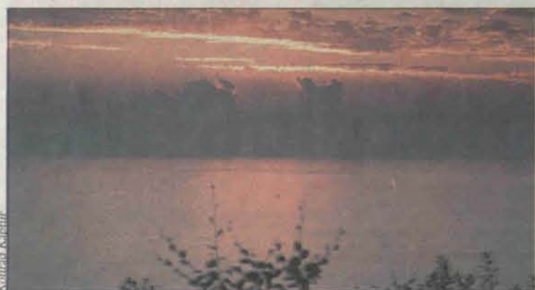
Zachody słońca w Ostrowie są wyjątkowo piękne.

Komenda Hufca Związku Harcerstwa Polskiego w Polkowicach proponuje dzieciom w wieku od 10 do 17 lat wypoczynek nad morzem w bazie obozowej w Ostrowie k/Jastrzębiej Góry, która usytuowana jest na terenie Nadmorskiego Parku Krajobrazowego - 600 m od morza.