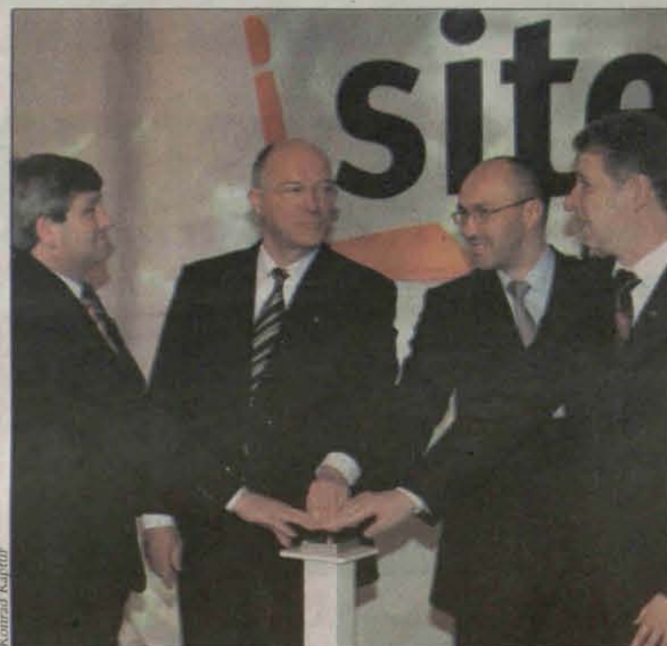
W marcu w fabryce firmy Sitech uruchomiono nową tłocznnię.

Dotychczas chęć pracy w firmie wyraziło około 130 osób. Większość z nich deklaruje, że posiada odpowiednie umiejętności. Niestety przeprowadzone przez pracowników Sitechu testy zweryfikowały te deklaracje.