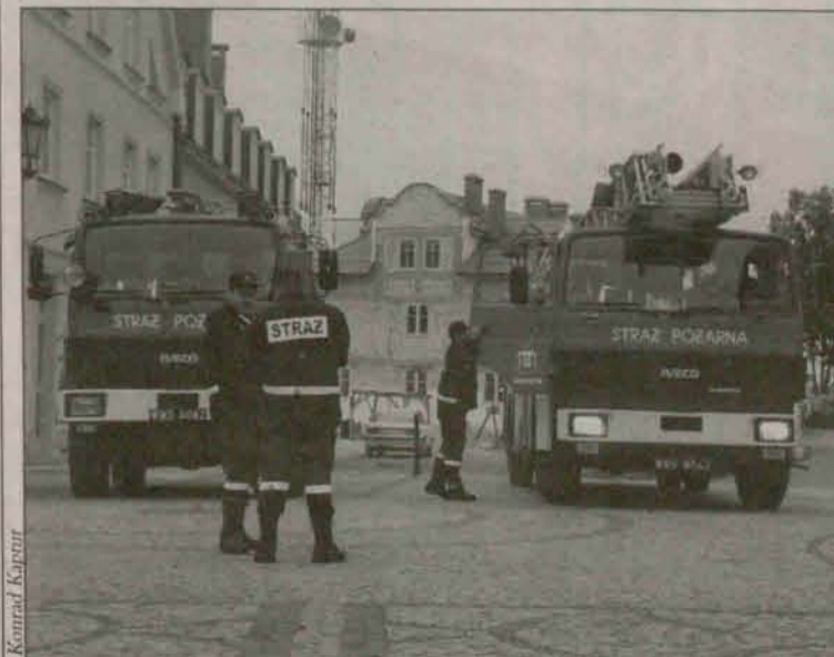
Sprzęt strażacki prezentował się efektywnie