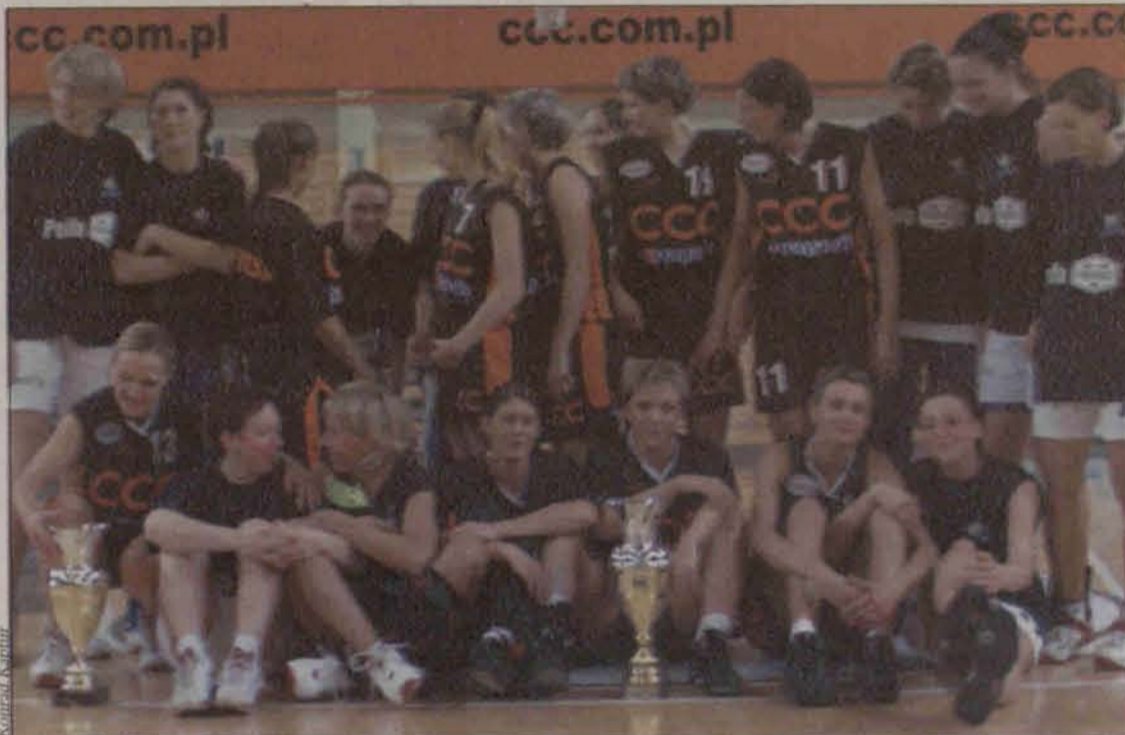
Koszykarki CCC Aquapark cieszą się ze zdobycia Pucharu Polski

Statystyki: 26 meczów, 382 pkt (14,7pkt/mecz), 140 zbiórek (5,4zbi/m), 50 asyst (1,9as/m) zalety: zbiórki i waleczność, gra ofensywna, mnóstwo punktów, zwody "na kroku" wady: gorszy rzut z półdystansu i dystansu, rzuty wolne