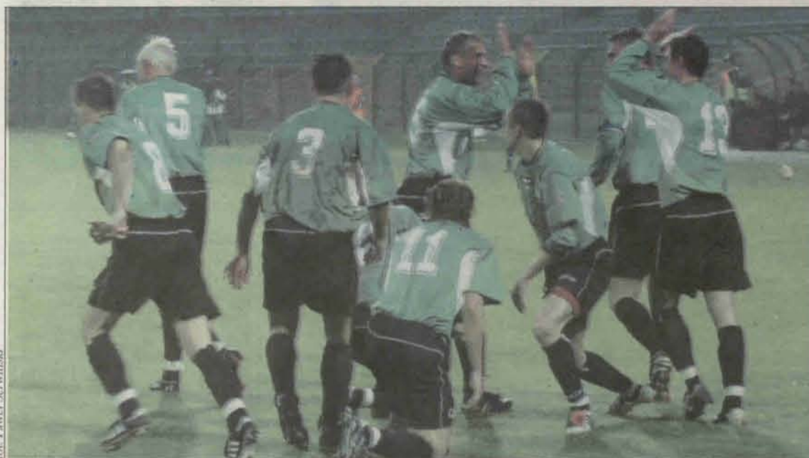
Ostatnio piłkarze Górnika mają coraz więcej powodów do radości.

Górniki Polkowice zdobył dziesięć punktów w czterech ostatnich meczach i po raz pierwszy od sierpnia ubiegłego roku opuścił strefę spadkową.