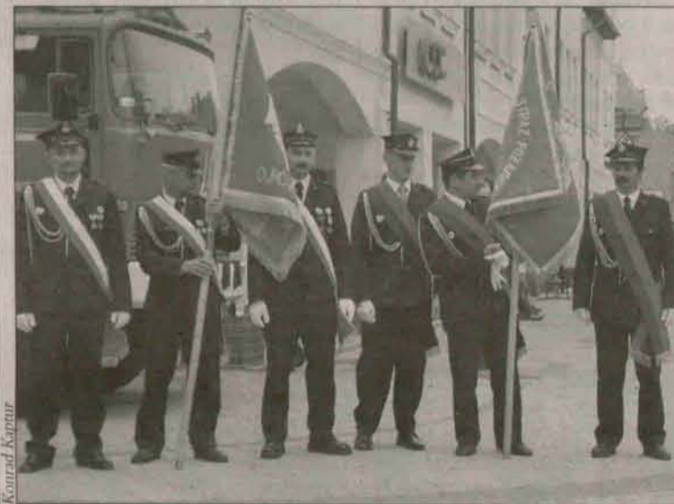
Strażacy w całej okazałości