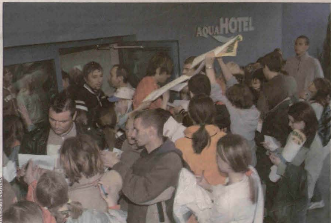
"Barowicze" rozdają autografy przed Aqua Hotelem