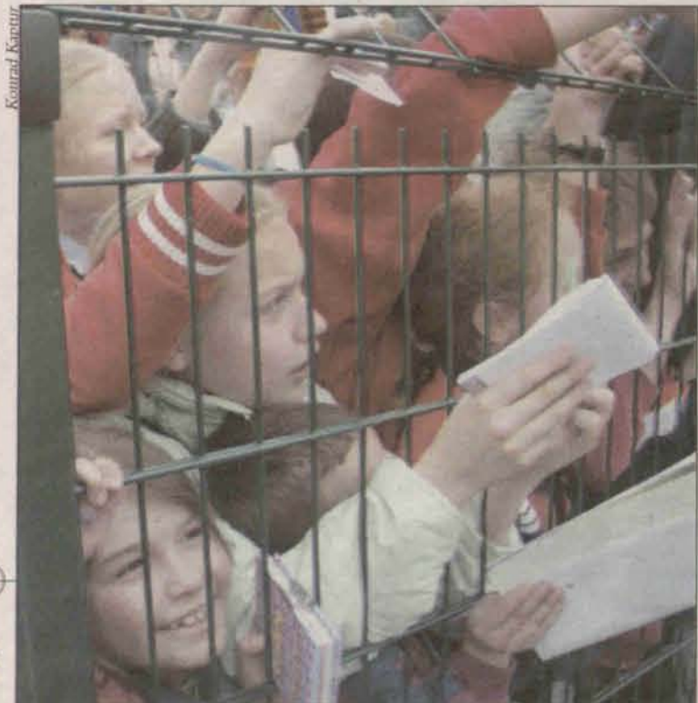
Jak tu zdobyć autograf?