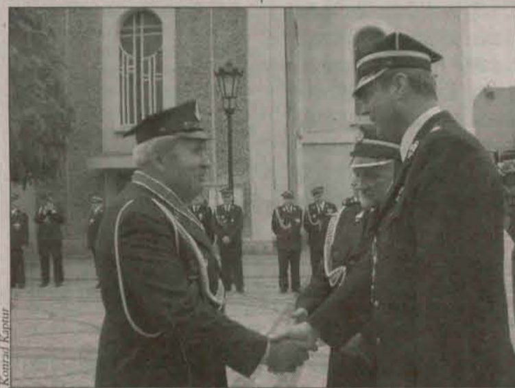
Podczas uroczystości wyróżniającym się strażakom wręczono odznaczenia