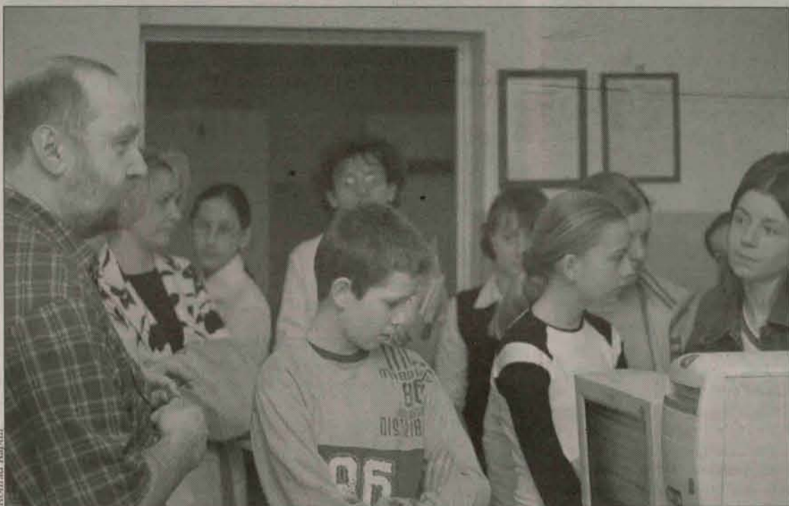
Uczniowie będą mogli wybierać w ofercie gimnazjum

Rozszerzone programy przedmiotowe dla uczniów o sprecyzowanych zainteresowaniach oferuje Gimnazjum nr 1 w Polkowicach