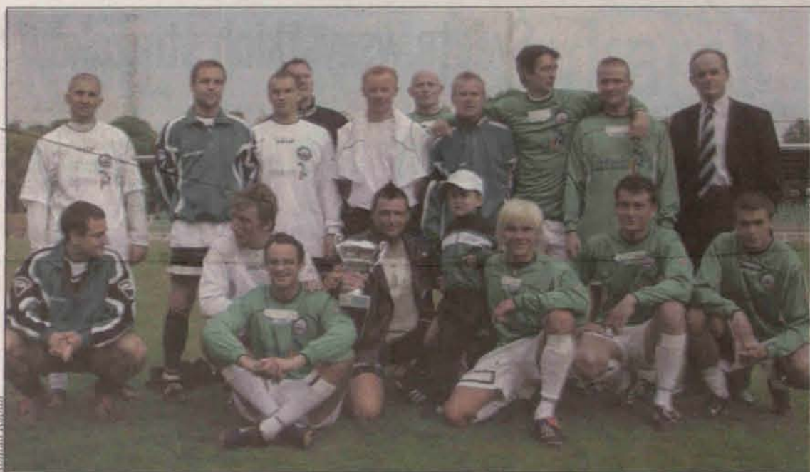
Pamiątkowe zdjęcie na murawie boiska