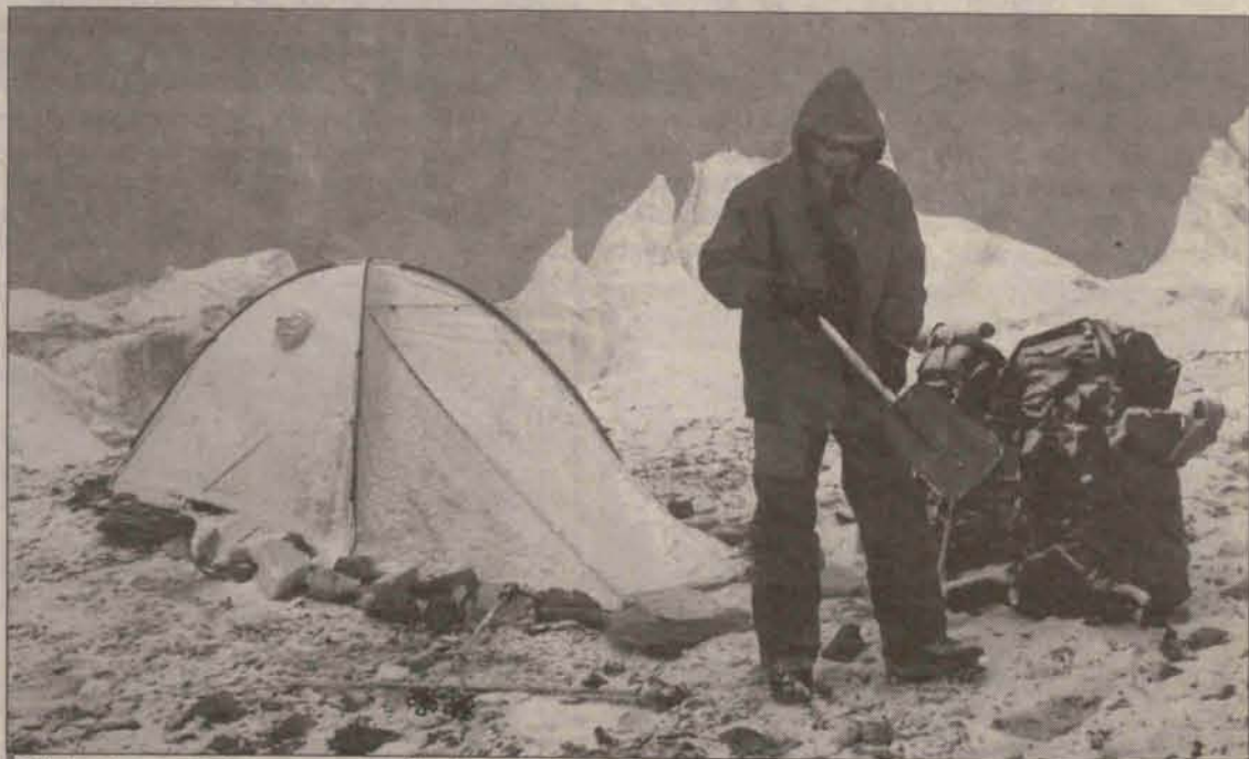
Zdjęcie wykonano w trakcie wyprawy w góry Tien Shan