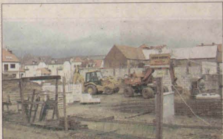
Trwają prace na budowie nowego sklepu w Polkowicach

Niemal wszystkie placówki sieci Netto w Polsce budowane są według jednego planu architektonicznego. Sklep będzie wymurowany z cegły klinkierowej, a zwieńczy go duży, spadzisty dach. W ten sposób nowy supermarket będzie się wyróżniał od pozostałych placówek tego typu w Polkowicach. - Obecnie koncentrujemy się na robotach ziemnych, wywozie ziemi oraz robotach budowlanych, których wykonanie sięga około 30% - powiedział nam Mirosław Chwałko, szef szczecińskiej firmy, która od lat pracuje dla sieci Netto. W trosce o estetyczny wygląd ulic wokół budowy, wstrzymaliśmy się na jakiś czas z wywozem nadmiaru piasku i ziemi. Kiedy pogoda się zmieni i przyjdzie mróz lub nie będzie padać, natychmiast pozbędziemy się zalegającej ziemi. Inaczej zaśmieciłobyśmy kilka kilometrów ulic - dodaje Mirosław Chwałko. Ziemię wywozi lokalna firma Sznajder, jak na razie jedyny lokalny podwykonawca. Miejscowe firmy będą później wykonywać prace instalacyjne gazu i wody. Każdy z punktów dyskontu Netto przechodzi kapitalny remont