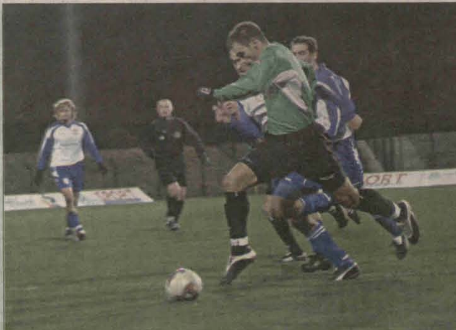
Mecz z Kotwicą Kołobrzeg był jednym z niewielu wygranych przez piłkarzy Górnik.

Miniony rok nie był dobry dla Górnik. Gracze z Kopalnianej po dwumeczu barażowym z Cracovią opuścili ekstraklasę. Równie słabo szło im na drugoligowych boiskach, gdzie wygrywali bardzo rzadko. Mamy nadzieję, że wraz z nowym rokiem dla czarno-zielonych przyjdą lepsze czasy.