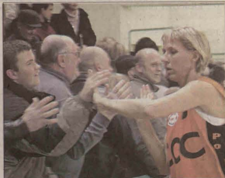
Podziękowania kibiców dla koszykarek to polkowicka tradycja

Zarówno władze Polkowic jak i sponsor tytularny polkowickich koszykarek - firma CCC są zainteresowani tym, aby zespół, który w ubiegłym roku wywalczył Puchar Polski miał stabilną przyszłość i w dalszym ciągu mógł odnosić sukcesy.