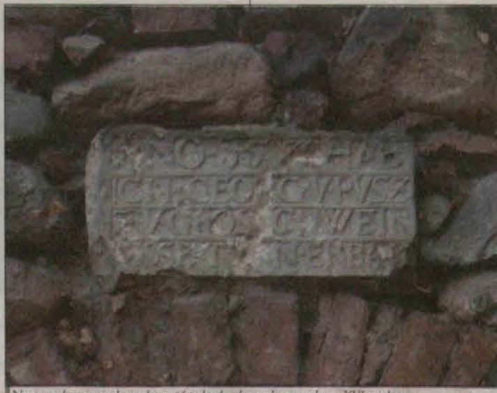
Napis na kamieniu kaže datować tę budowlę na drugą połowę XVI wieku