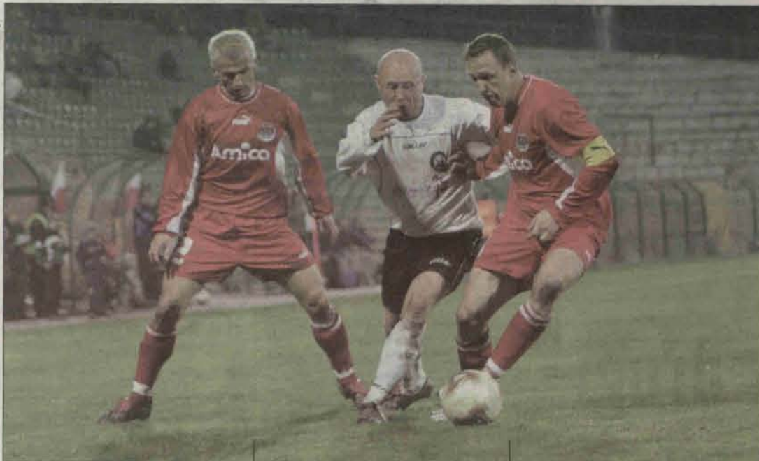
Z Amiką we Wronkach Górnik rozegra pierwszy mecz sparingowy