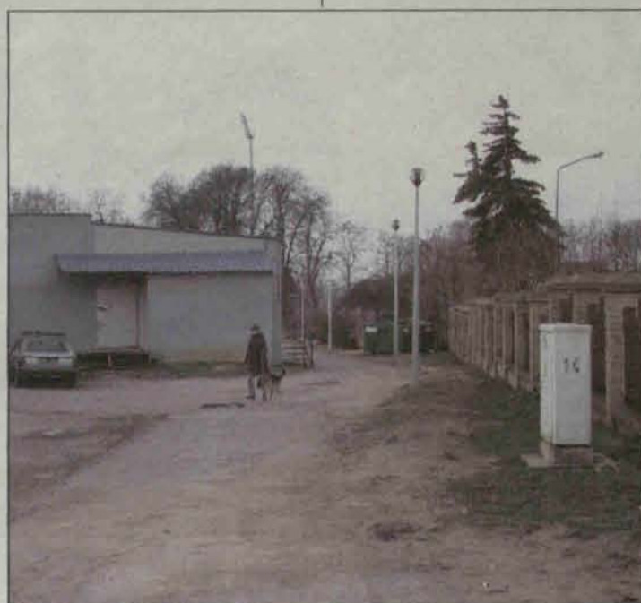
Chodnik przy sklepie MERCUS też zostanie wyremontowany