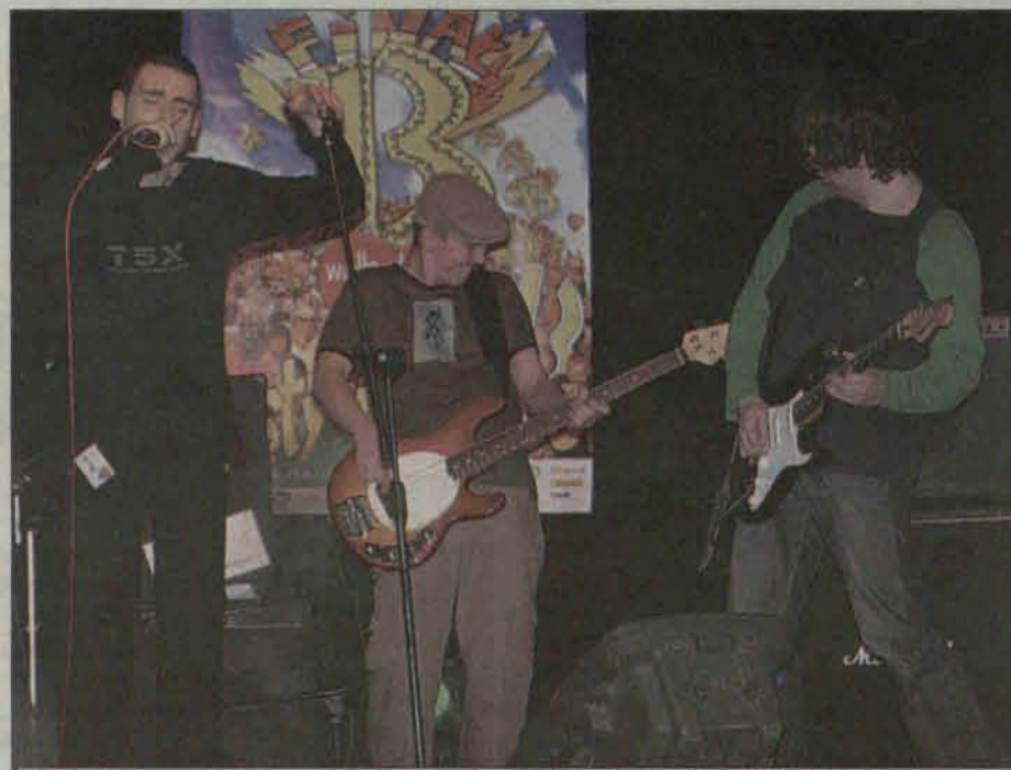
Na zakończenie koncertu rockowego w kinie wystąpił zespół OUT OF BODY EXPERIENCE