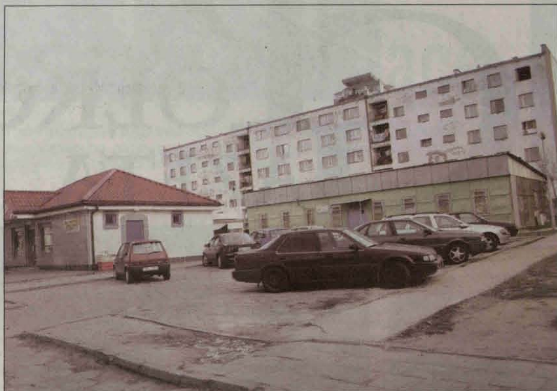
Już niedługo okolica Klubu Podnoszenia Ciężarów przestanie straszyć mieszkańców osiedla Hubala

- Priorytetem będzie budowa wewnętrznych dróg, chodników oraz zatok parkingowych. W drugiej połowie stycznia zostanie ogłoszony przetarg nieograniczony. Jeżeli wszystko uda się przeprowadzić bez komplikacji to na początku kwietnia rozpocz-