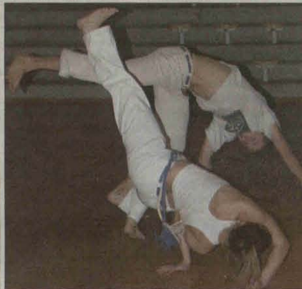
Pokaz capoiery w Auli Forum