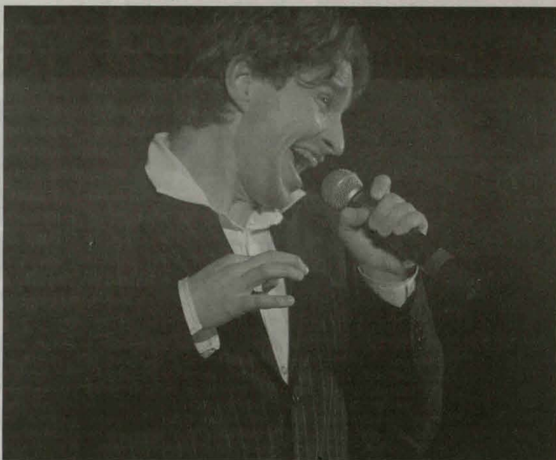
Występ znanego śpiewaka rozpalil publiczność zgromadzoną w polkowickim kinie