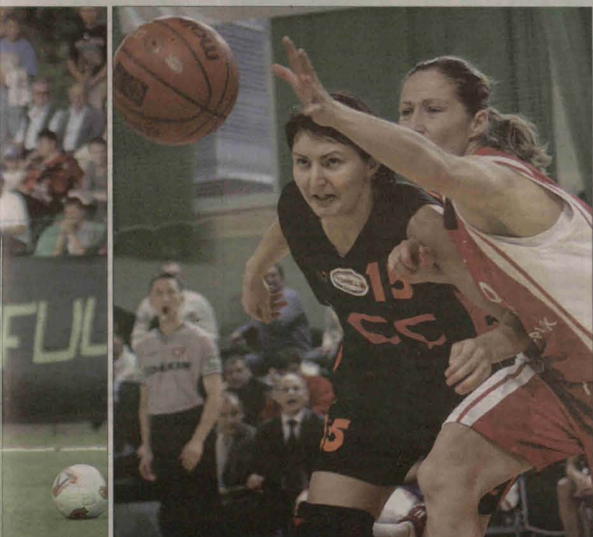
Mecze piłkarski Górnika Polkowice i koszykarek CCC są źródłem niezapomnianych sportowych emocji dla wszystkich mieszkańców Polkowic.