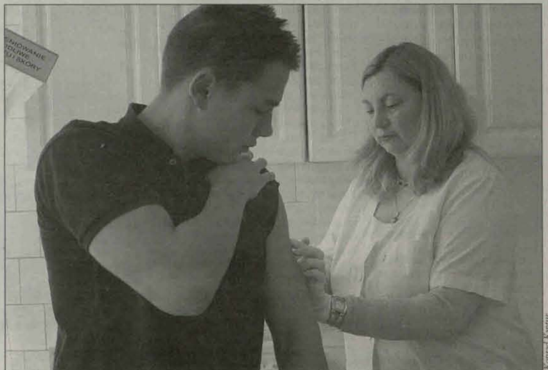
Badania poziomu hemoglobiny glikowanej cieszyły się dużym zainteresowaniem