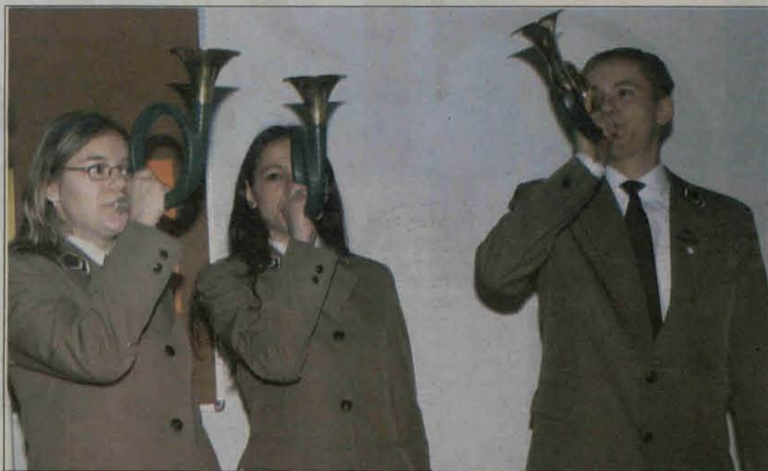
Marsz Hubertowski w wykonaniu uczniów Zespołu Szkół Rolniczych z Głogowa

Druk: Drukarnia PolskaPress Wrocław, 55-075 Bielany Wrocławskie, ul. Kolejowa 7.