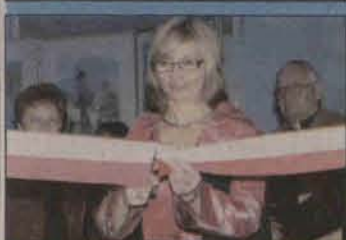
W Gimnazjum nr 2 uroczyste otwarto nową salę gimnastyczną