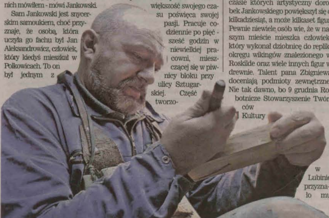
w Lubinie przyznało mu