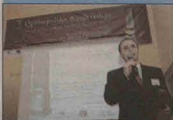
Polkowice zostały laureatem Ogólnopolskiego Rankingu Fundacji Europejskiej