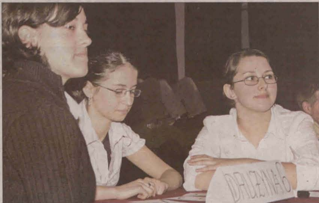
Zwycięska drużyna z Chocianowa

W tegorocznej edycji konkursu startowało ponad stu uczniów. Najpierw walczyli w eliminacjach. Odbyły się one pod koniec grudnia ubiegłego roku. Uczniowie rozwiązywali wówczas testy zawierające pytania z zakresu historii, geografii oraz wiedzy o społeczeństwie. Potem prezentowali swoje zdolności oratorskie odpowiadając na pytania przed komisją, która oceniała nie tylko poziom wiedzy, ale również sposób jej prezentacji. Siedem zwycięskich zespołów zakwalifikowało się do finałowej rozgrywki. Najwięcej punktów w eliminacjach - 18, zdobyła ekipa Zespołu Szkół z Polkowic i to ona była faworytem.