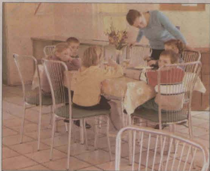
Ze stołówki polkowickiego OPS korzystają także dzieci