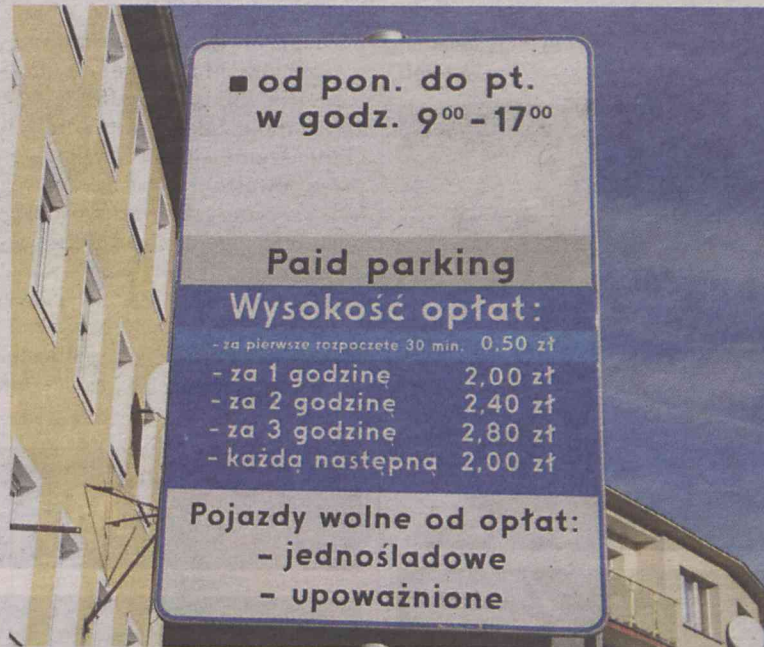
Nowy regulamin Strefy obowiązuje od 1 lutego

Panorama odnotowała też zdarzenie, jakie miało miejsce na parking przy cukierni na ulicy 3 Maja. Dwójka młodych mężczyzn zobaczyła, jak obsługa Strefy fotografuje ich auto. „Parking jest płatny” - usłyszeli krótką odpowiedź na swoje wątpliwości. Oburzeni udali się do oleśnickiego biura City Parking Group przy Kościelnej. Dyżurująca przedstawicielka operatora poinformowała ich, że jeśli nie zgadzają się z nałożonym mandatem, mogą złożyć reklamację. „Ktoś tu kogoś nabija w butelkę! My tego tak nie