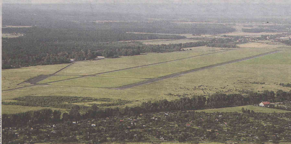
Tego terenu nie można poszatkować - stwierdził wiceburmistrz

Władza samorządowa Oleśnicy liczą, że w końcu pojawi się inwestor, który ulokuje swoją firmę na lotnisku.