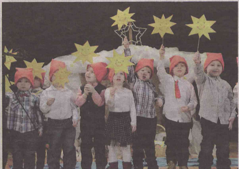
Jasełka dla naszych dziadków

artystyczny dla babcy i dziadków. Były wiersze, piosenki i tańce oraz jasełka. Każdy wnuczek i wnuczka wręczył swoim dziadkom upominki i piękne laurki. Całą uroczystość mali artyści wraz ze swoimi gośćmi zwieńczyli słodkim ciasteczkami i ciepłą herbatą z miodem. Po raz pierwszy tę coroczną imprezę pracownicy i dzieci przedszkola Bajka zorganizowali w MGOK w Międzybórz. (OAI)