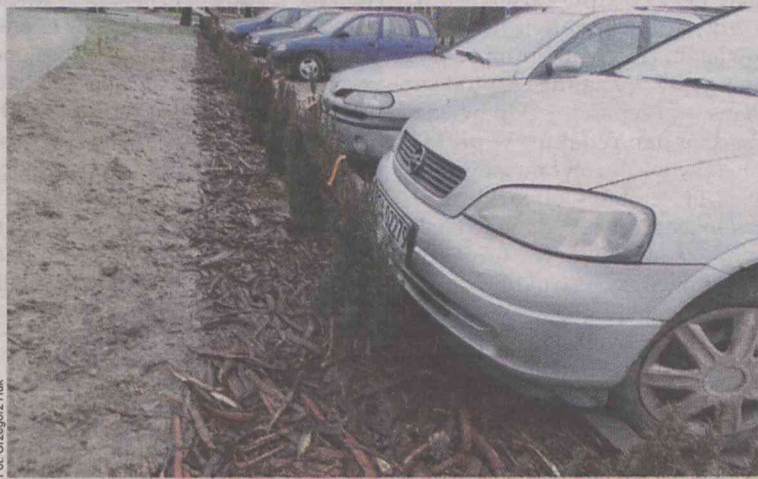
Sadzonki cisów rosną za blisko krawędzi parkingu

Pomysł był dobry, ale realizacja nieprzemysłana.