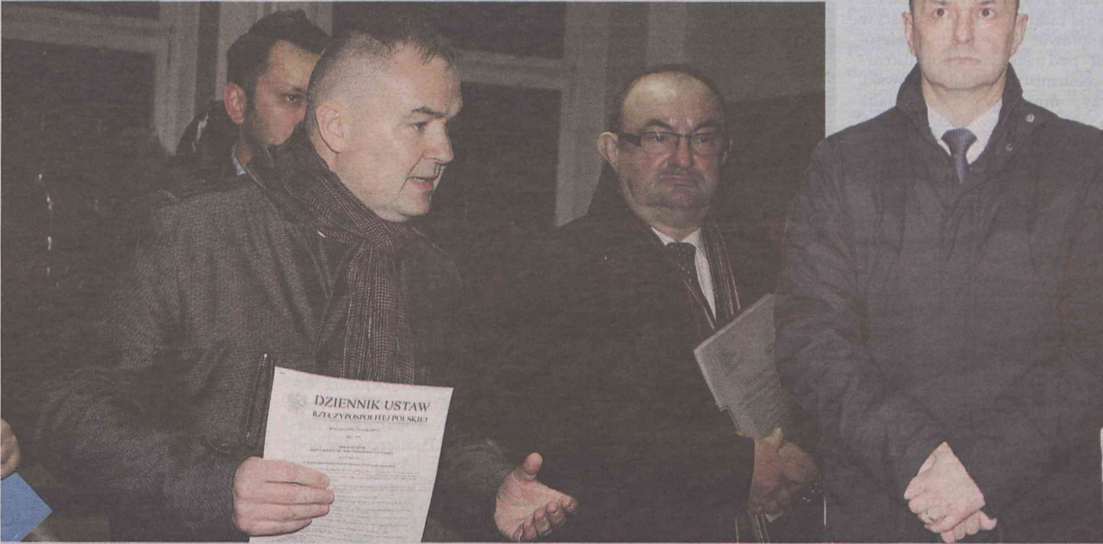
Burmistrz zrobił wielkie oczy, słysząc zarzuty opozycji

Opozycja: Nie ma zgody na zaciągnięcie pożyczki z parabanku, mamy lepszy plan ratowania szpitali. Burmistrz: Pokażcie go i przeproście, że przez was komornik zapukał do drzwi szpitali.