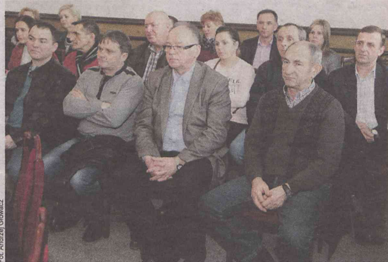
Sołtysi przysłuchiwali się obradom

Gdyby zaistniała sytuacja braku miejsca w przedszkolu i oddziałach przedszkolnych w szkołach podstawowych, w klasach pierwszych w szkołach podstawowych czy gimnazjum, radni podjęli uchwałę, w której określili kryteria