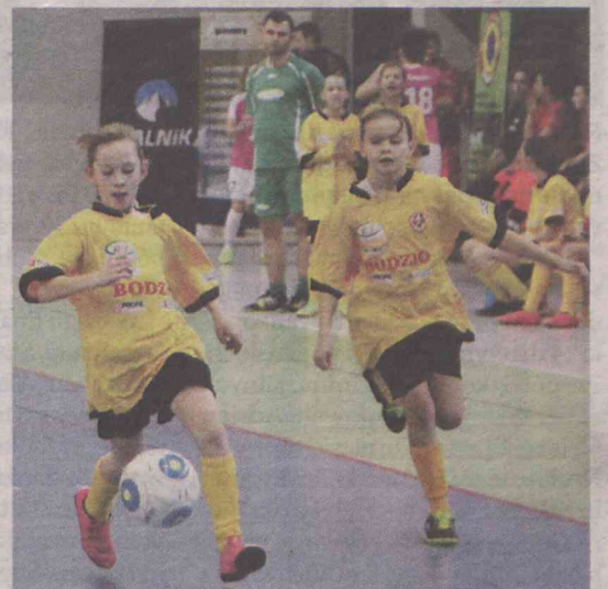
Dziewczynki pokonały chłopaków