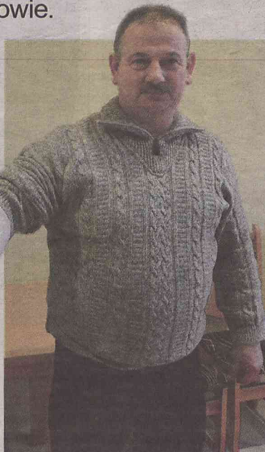
Radny po pomoc musiał jechać do Namysłowa