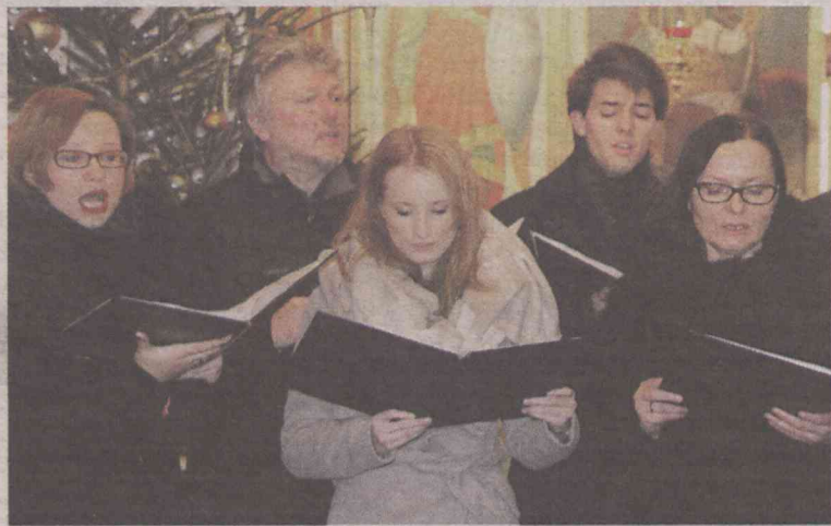
Wieczór Kolęd miał charakter ekumeniczny