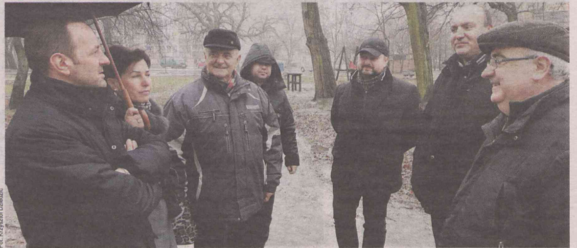
Najlepiej obejrzyć wszystko gospodarskim okiem

W parku Kopernika nowego placu zabaw nie będzie, ale za to urządzona zostanie siłownia pod chmurką.