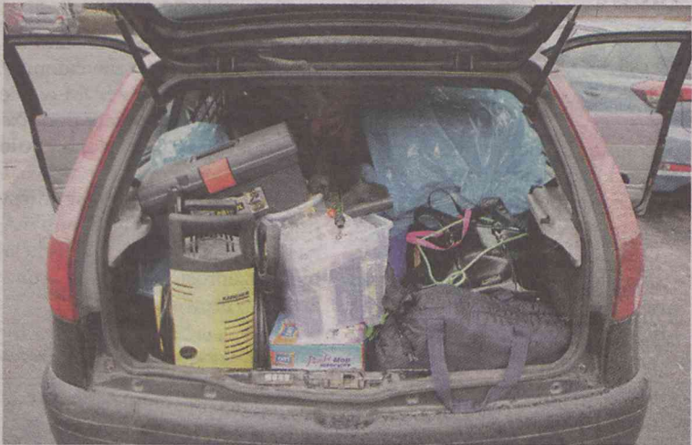
Tym razem złodziejski rajd spalił na panewce...