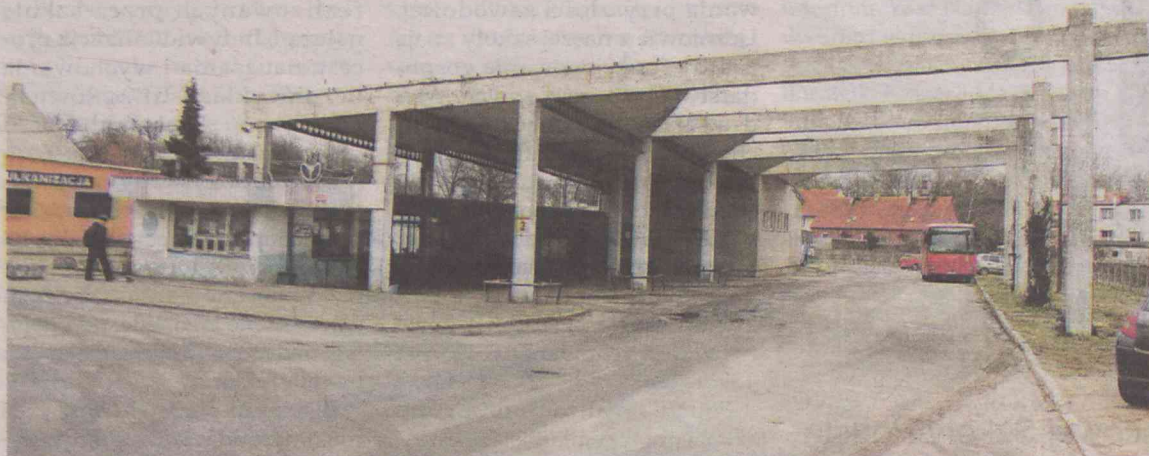
Losy autobusowego dworca się ważą...

SYCÓW. Przedsiębiorstwo Komunikacji Samochodowej w Ostrowie Wielkopolskim ogłosiło przetarg na sprzedaż prawa wieczystego użytkowania gruntów na terenie dworca autobusowego. Co z przewozami?