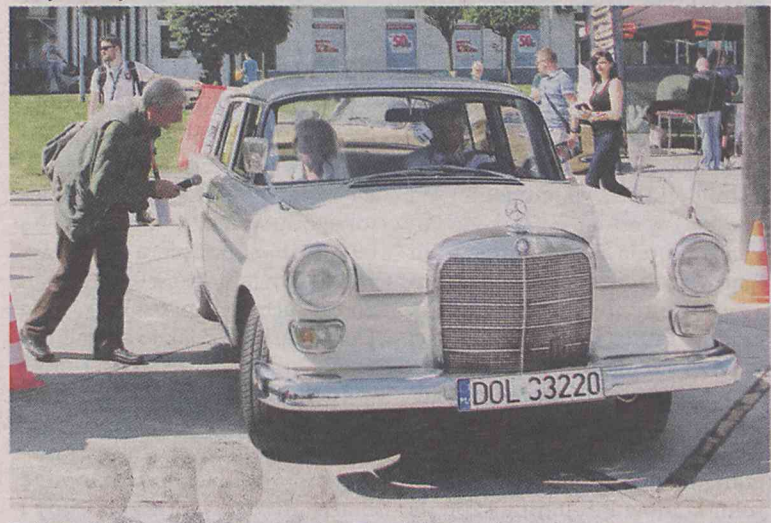
Takich ciekawych aut spodziewamy się wiele