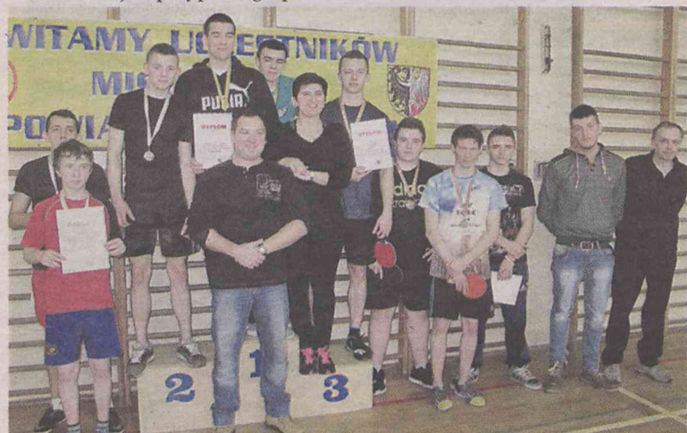
Mistrzowie sycowskiej Licealiady