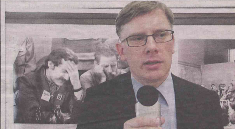
Historyk konsekwentnie odkrywa kulisy polskiej transformacji