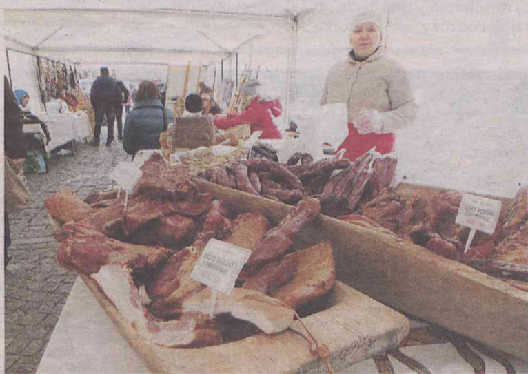
Kulinarne stoiska przyciągały wzrok