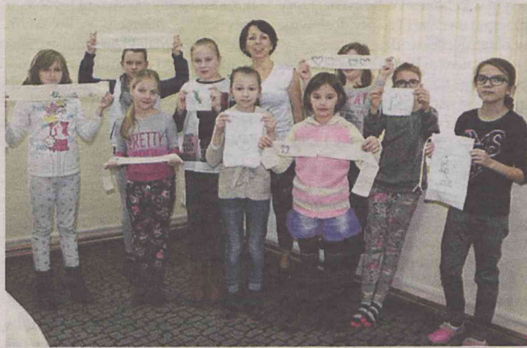
To były twórcze dni

TWARDOGÓRA • Ok. 150 dzieci i młodzieży skorzystało z zajęć w czasie ferii w bibliotece.