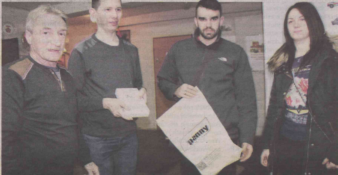
Pokłosiem turnieju jest gest pomocy innym