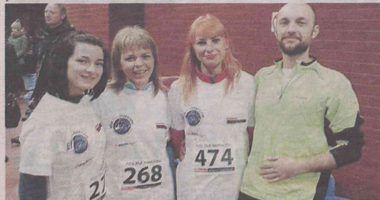
Dołączcie do nas!