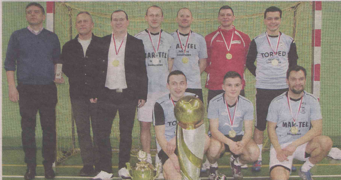
Triumfatorzy X Zina Sycówka Cup - ekipa Mar-Tel Torped

Trzecia mistrzowska korona graczy Mar-Tel-u, którzy - wygrywając sycowską halówkę po raz trzeci - zapewnili sobie tym samym zdobycie przechodniego, jak dotąd, pucharu na własność.