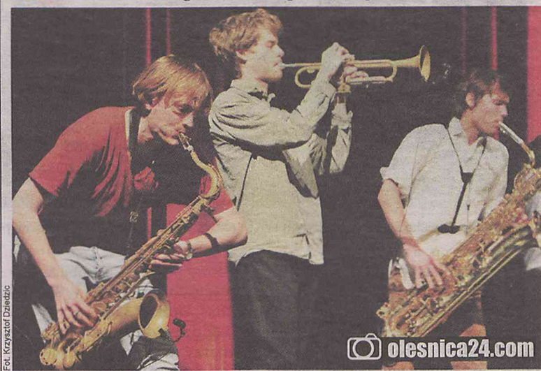
Eksperymentujący muzycy rozpoczęli jazzowy festiwal

W kularach chwilę po koncercie słychać było odmienne opinie, w tym i taką, że nadmierne było oczekiwanie, by jeden początkujący zespół udźwignął ciężar całego festiwalowego dnia. Podczas pierwszego koncertu zabrakło