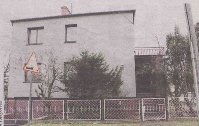
W tym sycowskim domu rozegrała się rodzinna tragedia

W minioną środę syn z Wrocławia nie mógł się dodzwonić do rodziców. Zaniepokojony przyjechał do Sycowa. Drzwi były zamknięte. Otworzył je siłą. W fotelu siedziała, nie dająca oznak życia, jego mama. Jej mąż leżał martwy w piwnicy... Sąsiedzi twierdzą, że dzień wcze-