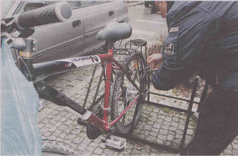
W mieście przybędzie stojaków na rowery