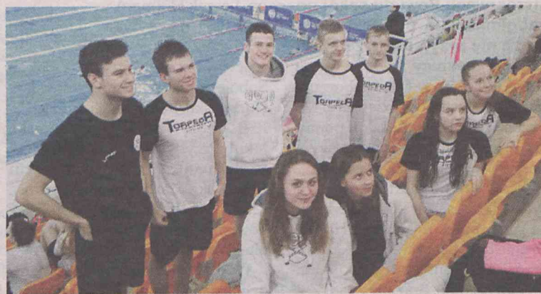
Zawodnicy Torpedy mieli powody do satysfakcji