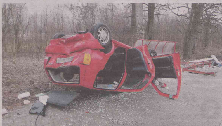
Wypadek wyglądał bardzo groźnie