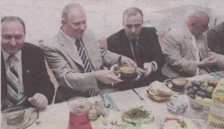
Gdzieś dzwonią (jedzą), ale nie w tym kościele (restauracji)...