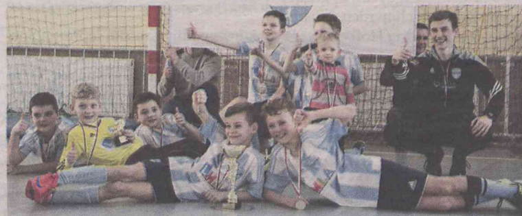
Było się z czego cieszyć!

turnieju w Rychtalu (powiat kępiński). Spotkało się tam 6 zespołów, które zagrały ze sobą systemem każdy z każdym. Trzy zwycięstwa, remis i porażka dały oleśniczanom srebro.