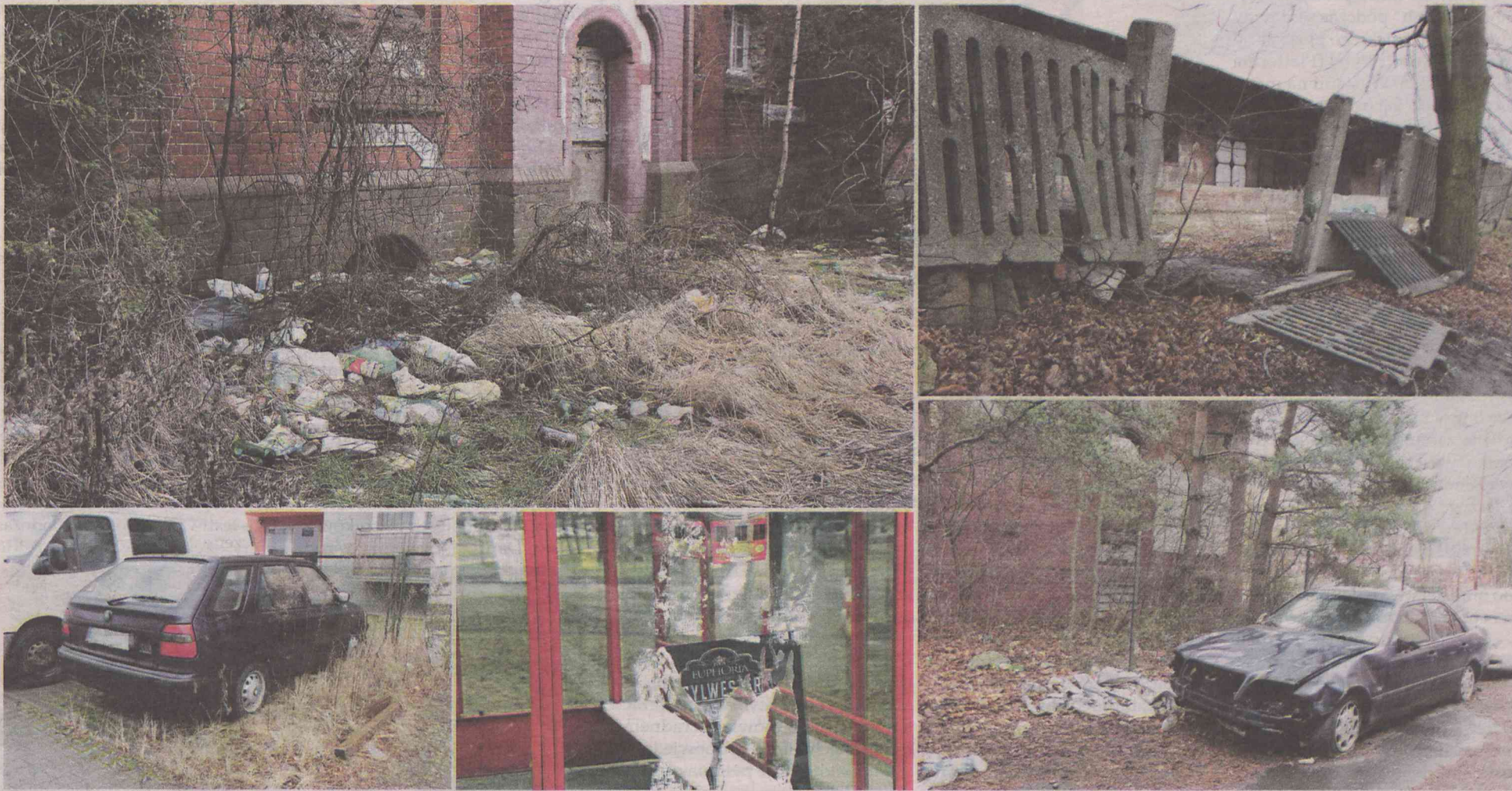
Od lewej: wysypisko śmieci przy byłym WKU, rozwalony płot przy ul. Moniuszki, porzucona skoda przy Paderewskiego, przystanek na ul. Podchorążych, mercedes przy ul. Wojska Polskiego