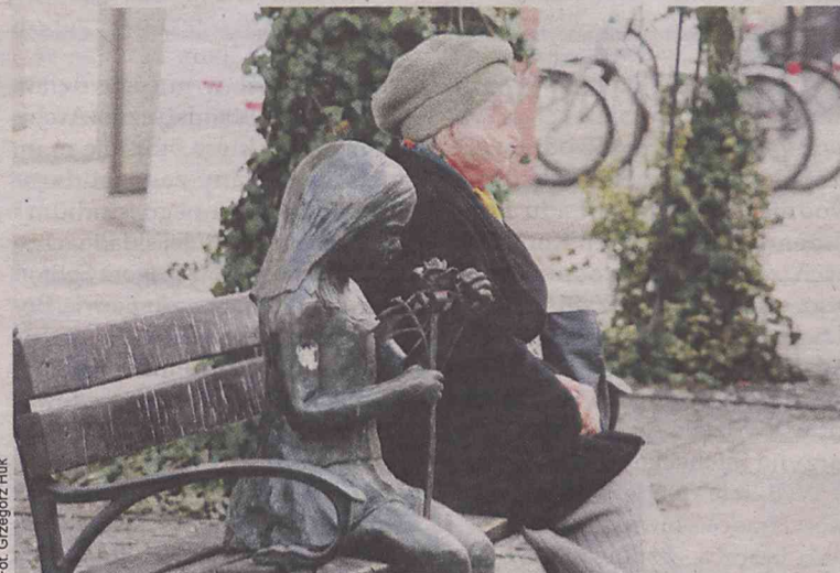
W Oleśnicy przybywa osób w podeszłym wieku

Najwięcej jest nas w wieku powyżej 70 lat - 4.030. A np. w wieku od 60 lat oleśniczan jest 8.924, a z kolei wieku do 14 lat tylko 5.522. W ciągu ostatnich 7 lat w Oleśnicy największy przyrost nastąpił w grupie osób powyżej sześćdziesiąt-