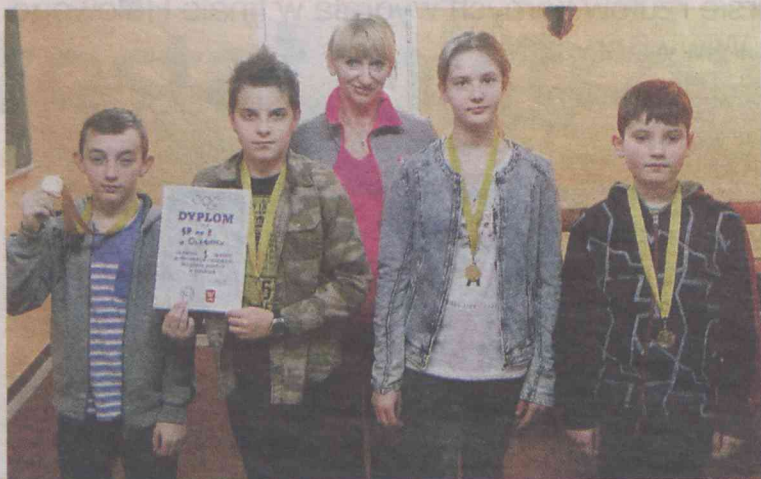
Mistrzowie szachów i ich sportowe trofea

W Oleśnicy triumfowali uczniowie z SP8, w powiecie najlepsza w królewskiej grze była sycowska SP1.