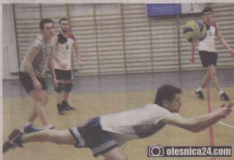
Turniej trwał od godziny 10 do 19

DZIADOWA KŁODA. Grupa wolontariuszy postanowiła wspomóc chore dziecko, organizując turniej siatkarski.