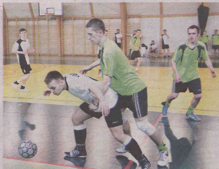
Trwa bój o Puchar Wójta

Mecz o pierwsze miejsce także obfitował w wiele emocji i