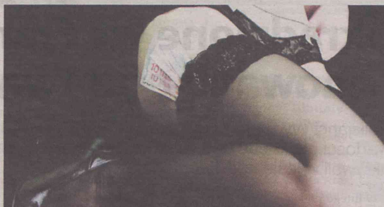
Oleśnicka para dorabia w niekonwencjonalny sposób

I opowiada: „Zerknęliśmy wtedy trochę inaczej na profile par,