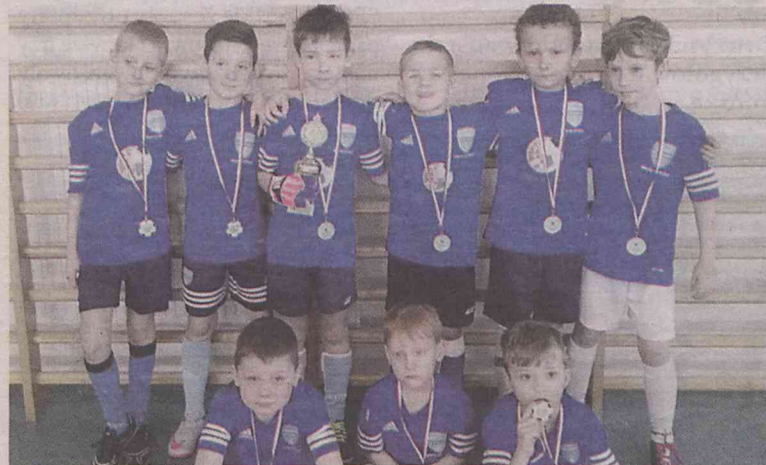
Medale i puchar były dla wszystkich