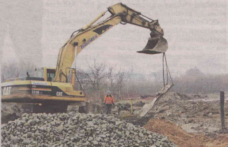
Warunki robót są szczególnie trudne

I doprecyzowuje: Płytką wodą gruntowa była opisana w dokumentacji i z tym sobie wykonawca radzi. Natomiast ze względu na to,