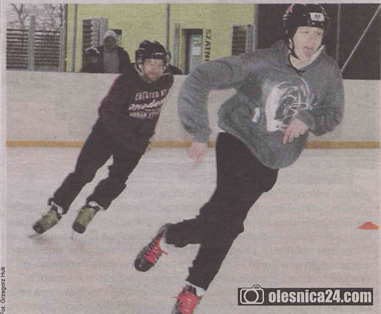
Wystartowało aż 53 zawodników