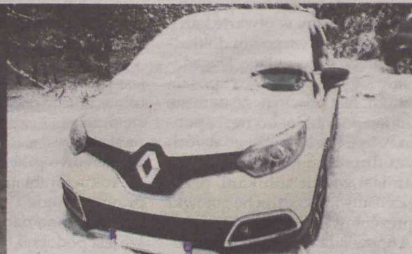
...oraz nowe renault captur