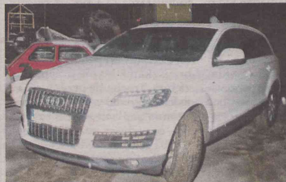
Odzyskane luksusowe audi Q7...

Sąd Rejonowy w Oleśnicy zastosował wobec nich areszt tymczasowy na okres 3 miesięcy. Grozi im kara pozbawienia wolności do lat 10. (wpol)