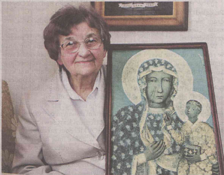
Oleśnicka lekarka oddała się Bogu

- Pan Bóg będzie się troszczył, Pan Bóg rozwiąże problemy - mówi portalowi lekarka. - Pan Bóg pozwalał mi brać udział w ruchu obrony życia i pracować w duszpasterstwie rodzin. Nigdy nie byłam partyjna, ale Pan Bóg pobłogosławił i pozwolił mi być kierownikiem specjalizacji wielu młodych ludzi. Mam świadomość, że moi pediatrzy leczą dzieci. Bóg