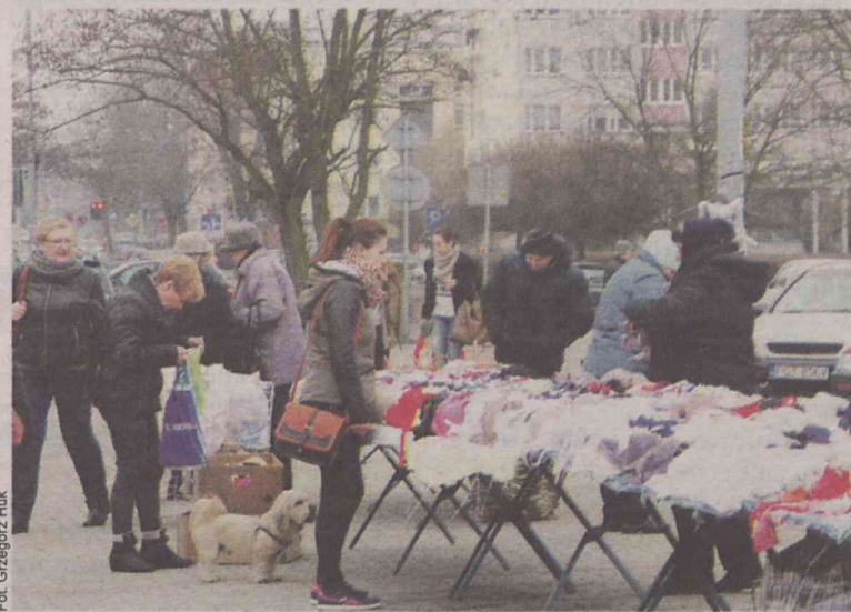
Czas na wsparcie lokalnych kupców

W Oleśnicy mamy już markety większości zagranicznych sieci działających w Polsce. Lada dzień otworzy swoje podwoje Lidl. Coraz realniejsze stają się plany budowy kolejnej galerii