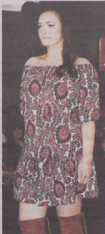
W pokazie wystąpiły panie w różnym wieku, o różnej figurze

na odchudzenie: zauważywszy, że organizm najlepiej trawi pożywienie półpłynne, postanowiła jeść zupy. Przyniosło to bardzo dobre efekty. Wykład zakończono pozytywną afirmacją, mającą uświadomić wszystkim kobietom, że są wyjątkowe. Chwilę później na potwierdzenie tych