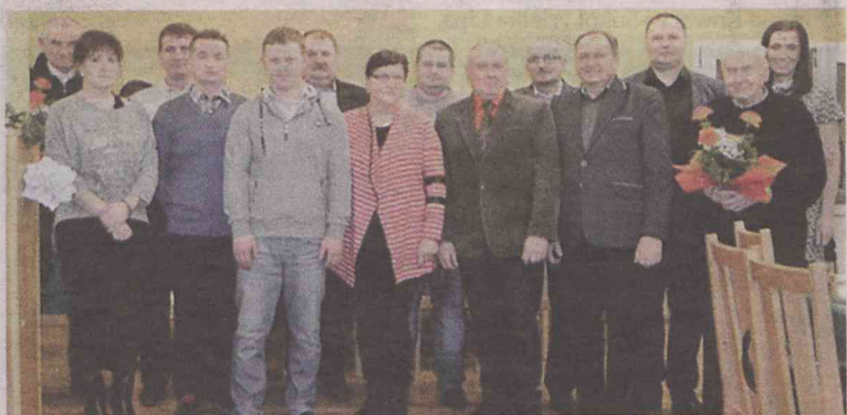
Mają plan działania na cały rok