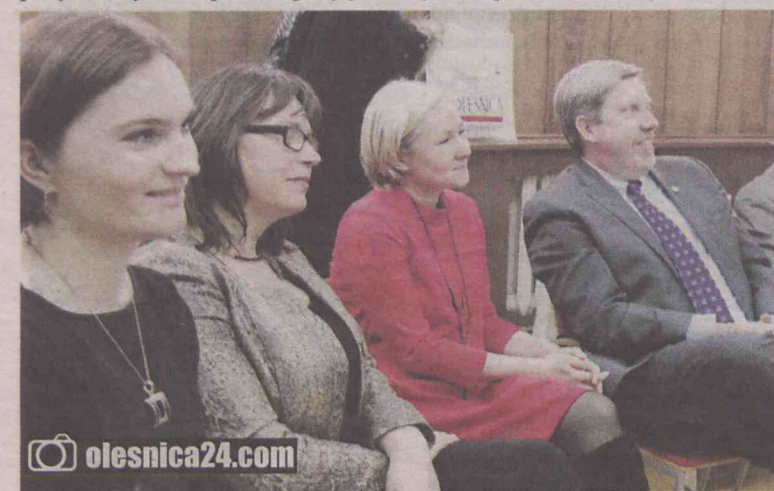
Konsul spotkał się z miłym przyjęciem

A rzecz trzecia? Na pożegnanie gość dostał okazały bochen chleba, wypieczony przez piekarnię Powąska z Bierutowa. Kilkakrotnie bardzo zaskoczony pytał, czy to faktycznie prezent dla niego?... (OAI)