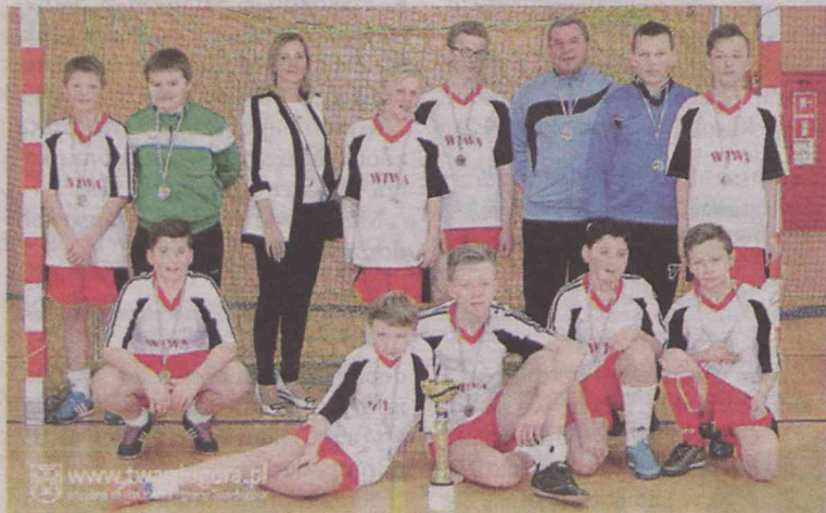
Wiwa wygrała rywalizację rocznika 2003/2004