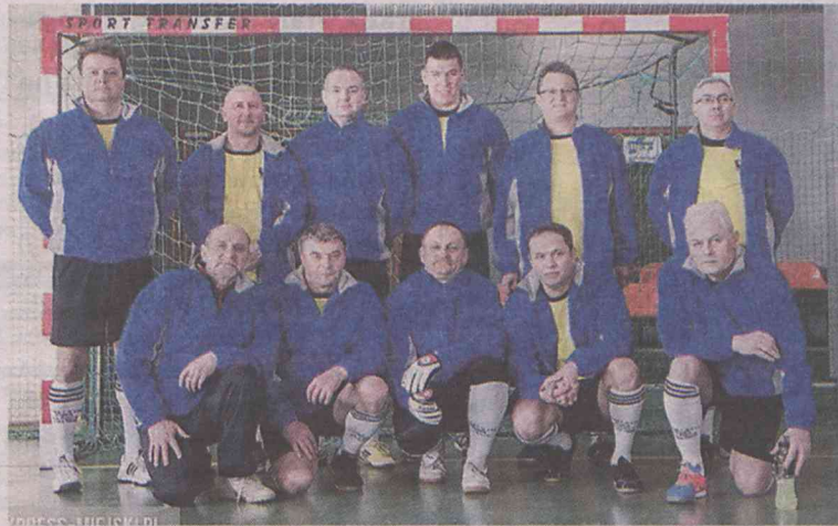
Drużyna ponad podziałami

W Środzie Śląskiej po raz 11. rozegrano Mistrzostwa Dolnego Śląska w halowej piłce nożnej samorządowców. Reprezentacja powiatu oleśnickiego osiągnęła w nich swój najlepszy wynik - była czwarta.