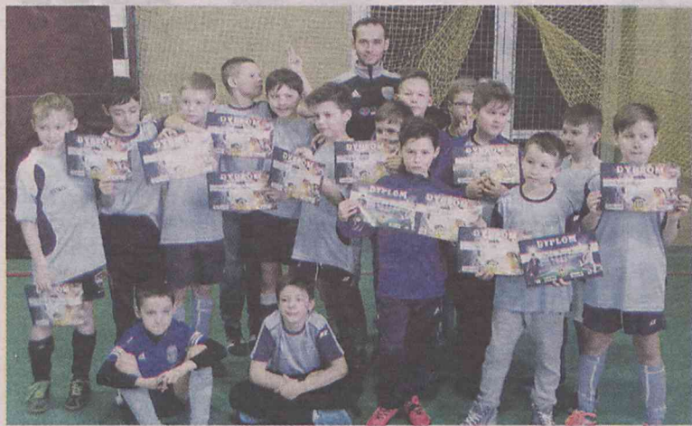
To był pierwszy poważny turniej sezonu