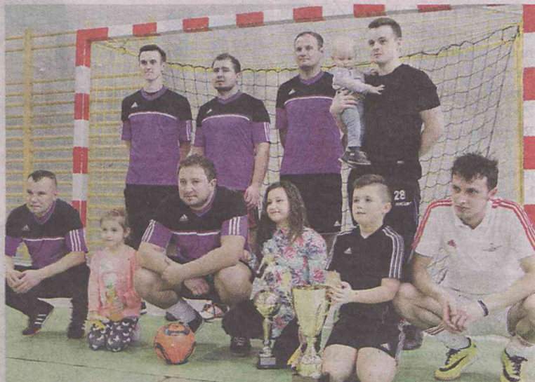
Królowie Disco biorą wszystko

Passa jednak bardzo szybko się skończyła, ponieważ Kerry poniosło dwie porażki w fazie finałowej i zajęła - mało dla nich satysfakcjonujące - trzecie miejsce. Najpierw Kerry zostało pokonane przez Królów