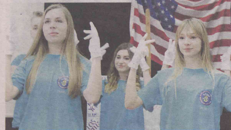
Trójkowice przygotowali specjalną prezentację

towali obchody amerykańskiego Święta Dziękczynienia, w którym uczestniczyli również rodzice. Teraz mieliśmy szansę sprawdzić dotychczas poznaną wiedzę w Kon-