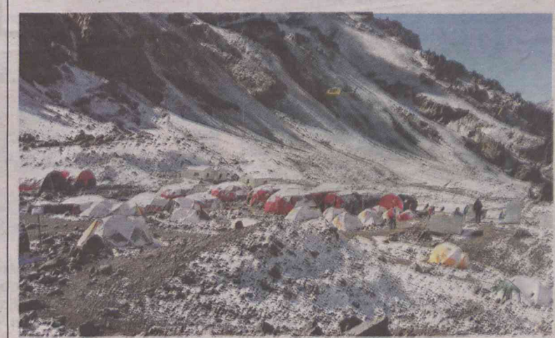
Obóz pod szczytem góry