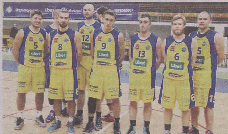
Ostatniej kwarty nie będą dobrze wspominać

Co się stało na początku IV kwarty? Ba... Straty i niecelne rzuty miejscowych, jakby nagle sparaliżowanych perspektywą awansu do pierwszej ósemki, a z drugiej strony systema-