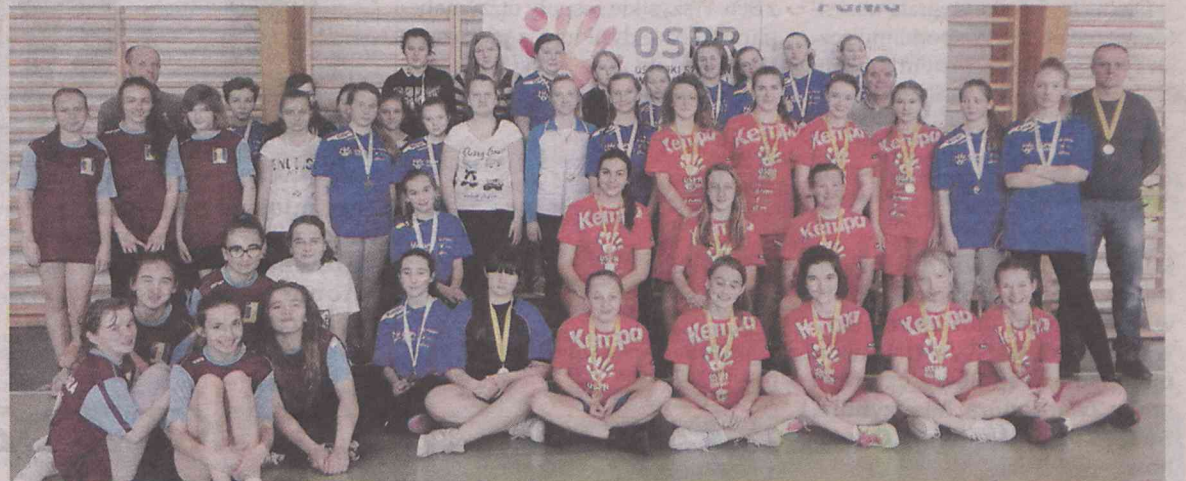
5. SP Dobroszyce (W. Klimkowski)