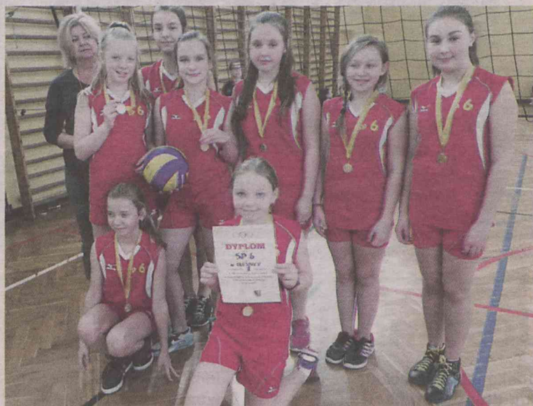
Są kolejne medale dla sportowców Szóstki

Drużyna do zawodów została przygotowana przez Iwonę Kamińską.