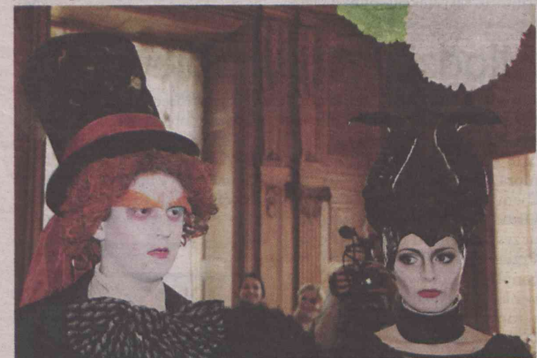
Charakteryzatorzy mają w Oleśnicy pole do popisu