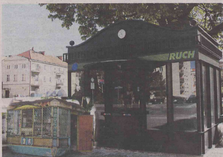
Nowy kiosk robi dobre wrażenie

W miejsce starego kiosku pojawiła się nowoczesna, o ciekawej formie, konstrukcja. Nowy kiosk ma sporo udogodnień, m.in. nowoczesne ogrzewanie i klimatyzację. Jego koszt to ok. 100 tysięcy złotych. (hag)