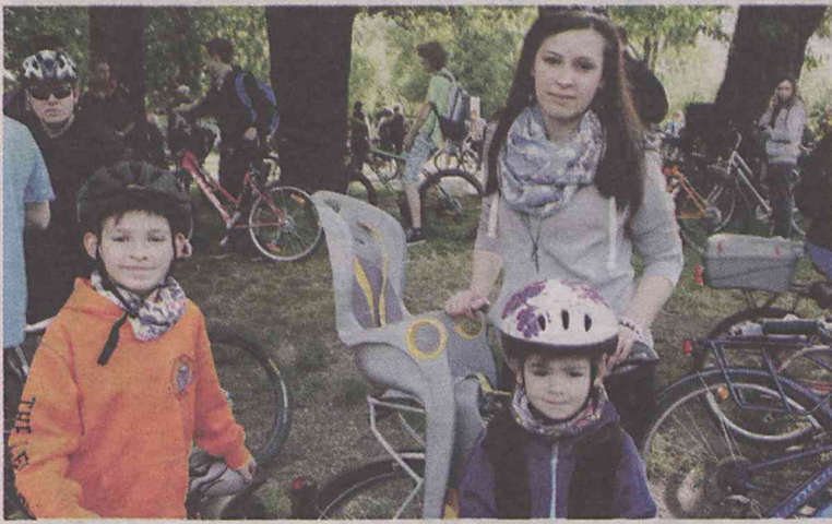
Rodzinko, wskakuj na rowery!

Organizatorzy niezmiennie przypominają, że jest to rajd rodzinny, a nie wyścig kolarski. Trasa, jej długość oraz nadawane tempo będą pozwalały na udział w nim każdemu rowerzyście. (ror)