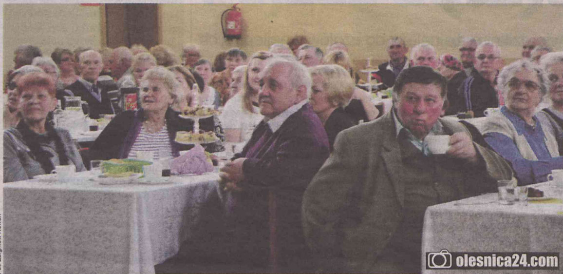
Władze gminy doceniły seniorów