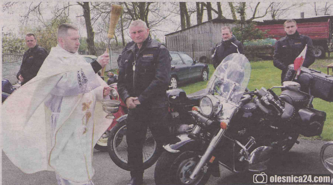
Sezon rozpoczęty, teraz w drodze...

DZIADOWA KŁODA. Fani dwóch kółek usłyszeli na mszy, żeby szanować życie swoje i innych.