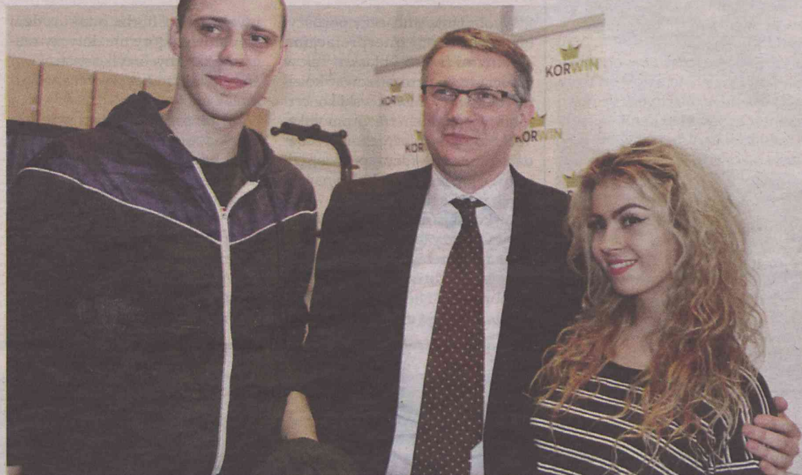
Uczestnicy spotkania chcieli mieć pamiątkę