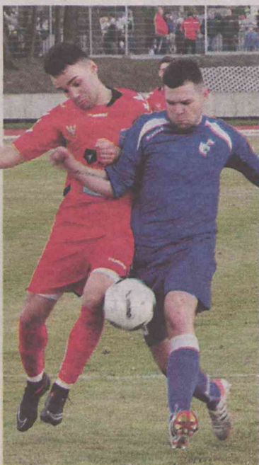
Walka była wyrównana