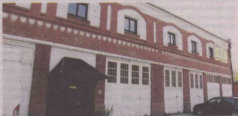
Ten obiekt przechodzi w prywatne ręce