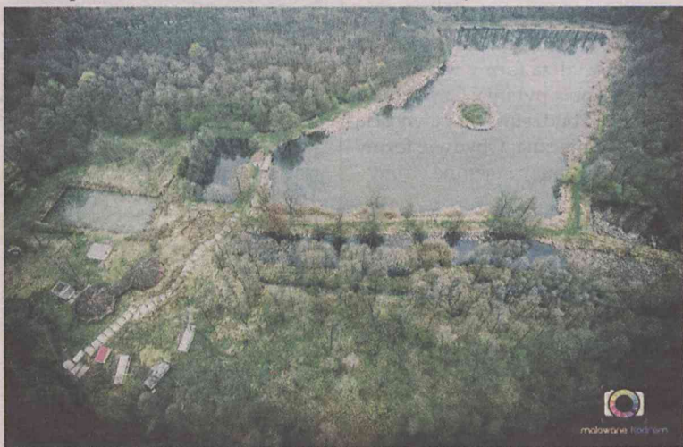
Kiedyś piękny teren rekreacyjny, dziś zapuszczona dzicz

Dzisiaj pozostały tylko wspomnienia. Niestety... (ror)