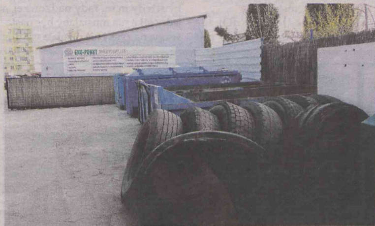
PSZOK przy Moniuszki sprawdził się w 100%

Wszystkie dane związane są z gospodarką komunalną. Do ilu budynków trafia miejskie ciepło? Ile surowców wtórnych sprzedaje MGK? Ile odpadów oddaliśmy do PSZOK-u?