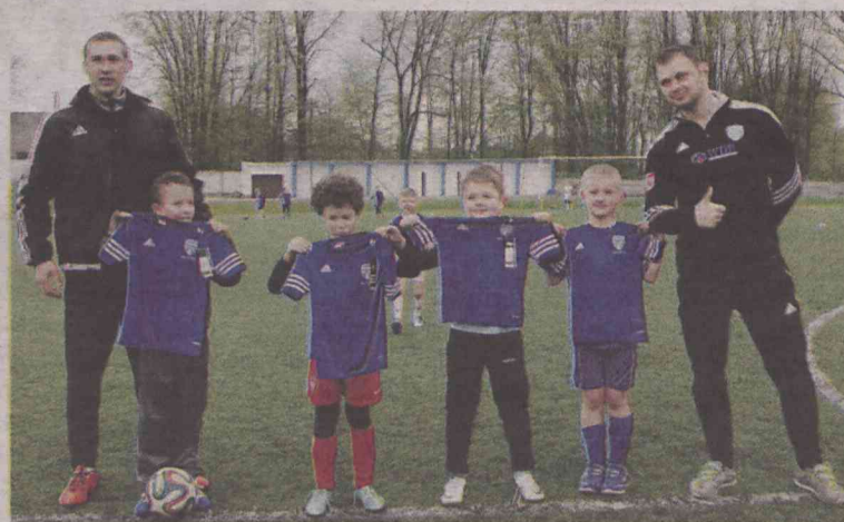
Trenerzy mogli sprawdzić swoich wychowanków