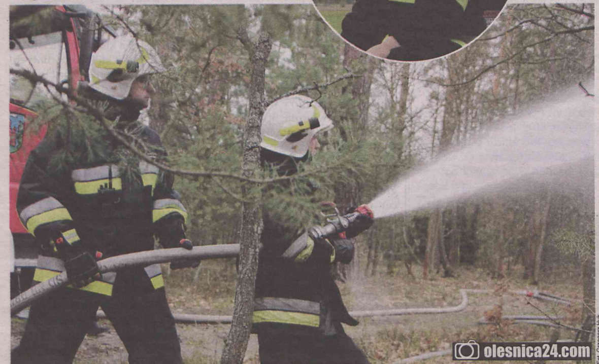
Strażacy ćwiczyli gaszenie lasu