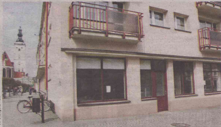
Ten atrakcyjny lokal już nie będzie stał pusty