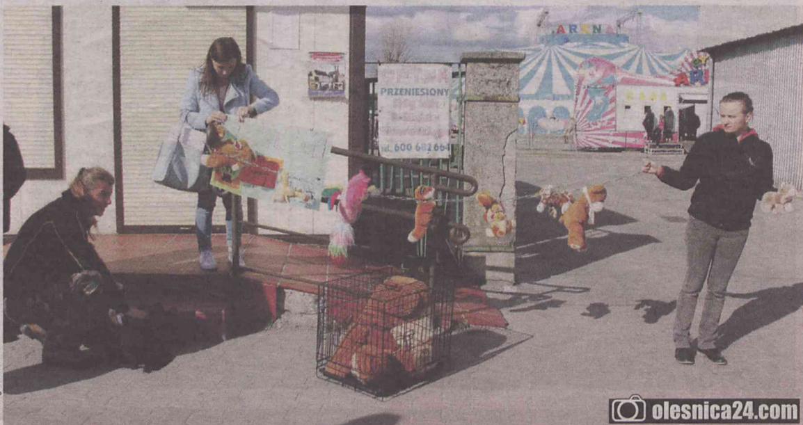
Pikieta nie przeszkodziła cyrkowym występom

W tym samym czasie już na ogrodzonym terenie cyrku jego obsługa zapraszała dzieci do robienia zdjęć na wielbłądzie. Chętnych nie brakowało. Widać wyraźnie, że mieszkańcy w kwestii zwierząt w cyrku mają różne poglądy... (hag)