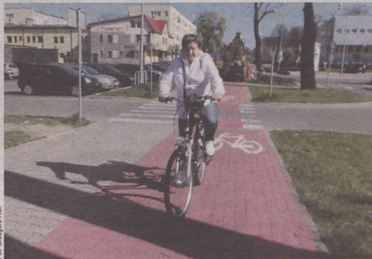
Ścieżki zdecydowanie poprawiły bezpieczeństwo rowerzystów

Obecnie na terenie miasta wyznaczonych jest około 18 km dróg rowerowych. Nie tworzą one jednak spójnej sieci i brak jest bezpiecznych tras rowerowych dla użytkowników podróżujących poza obszary miejskie, szczególnie przy wylotowych drogach o dużym natężeniu ruchu, na których prędkości pojazdów dwuśladowych są niebezpiecznie duże i szczególnie zagrażające rowerzystom. Istniejąca sieć wymaga budowy kolejnych, co najmniej 12 km, nowych dróg rowerowych, w szczególności na drogach powiatowych zlokalizowanych na terenie Oleśnicy, w celu stworzenia nie tylko spójnej sieci, ale i jej rozbudowy.