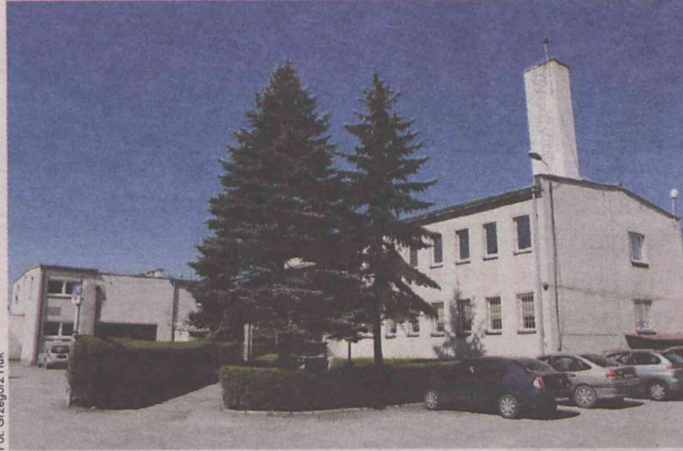
Mieszkaniowa inwestycja w tym miejscu rozładuje kolejkę

Po pozyskaniu przez miasto od Spółdzielni Mieszkaniowej „Zacisze” bazy i terenów przy ulicy