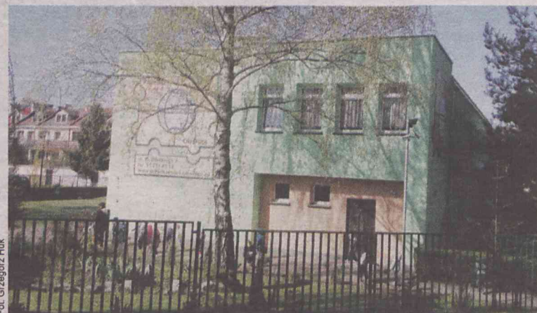
W tym budynku swoją siedzibę znajdzie Żłobek Miejski

W najbliższy piątek Rada Miasta będzie procedowała uchwałę o powołaniu jednostki organizacyjnej miasta pod nazwą Żłobek Miejski. Ma on powstać w obiekcie Przedszkola nr 4 na Kazimierza Wielkiego. Rozpoczęcie działalności żłobka nastąpi 1 września. Pokieruje nim dyrektor. Dodajmy, że to nie budowa od podstaw nowej