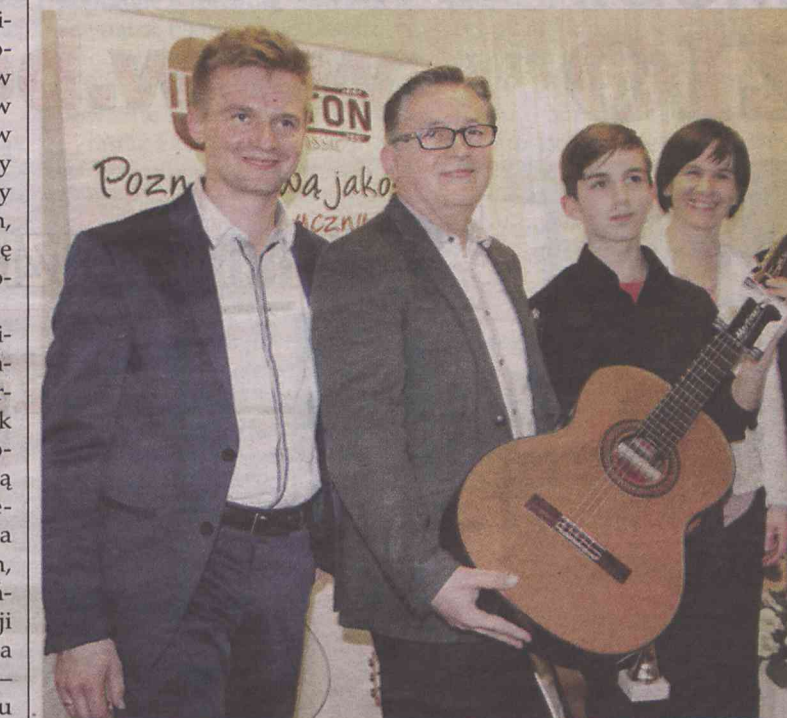
Główna nagroda pochodziła od fundatora

Organizowany w Oleśnicy konkurs dla najmłodszych adeptów sztuki gry na gitarze klasycznej znalazł już naśladowców.