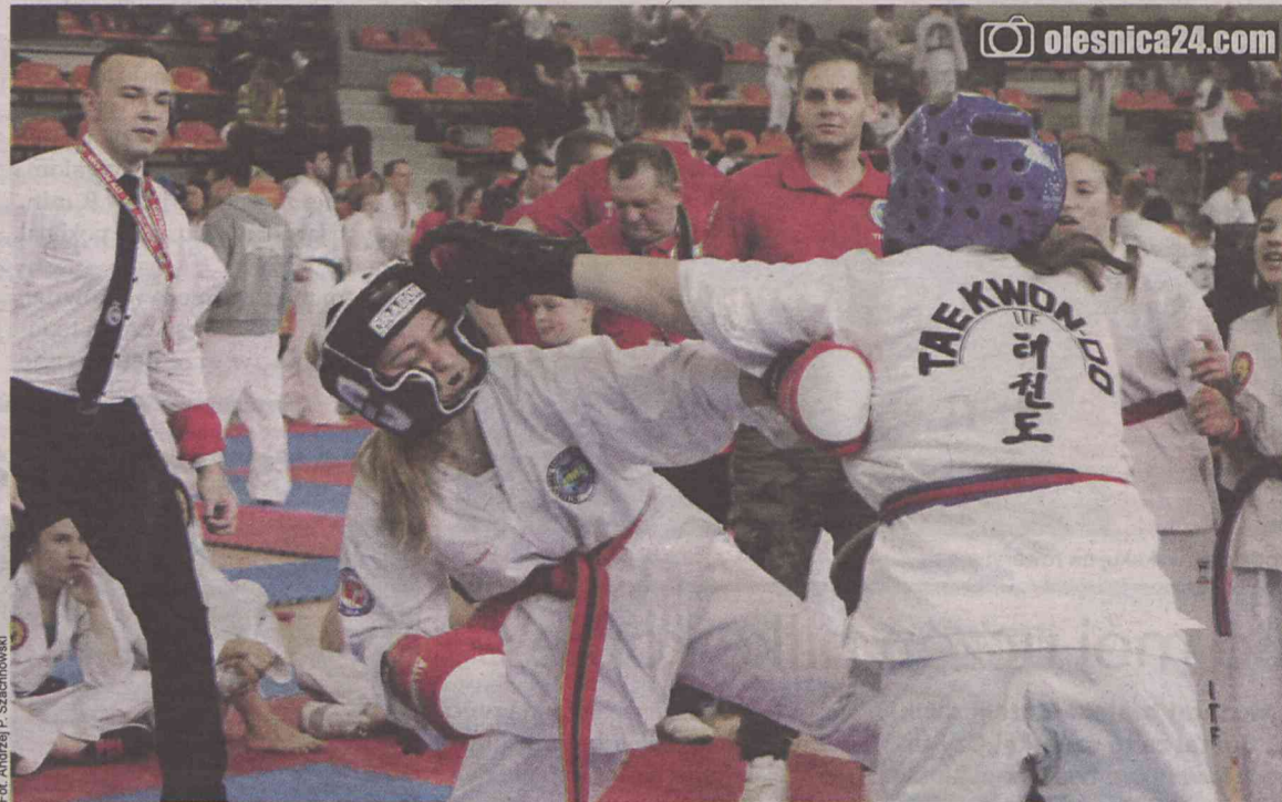
Do rywalizacji stanęło ponad 400 zawodników