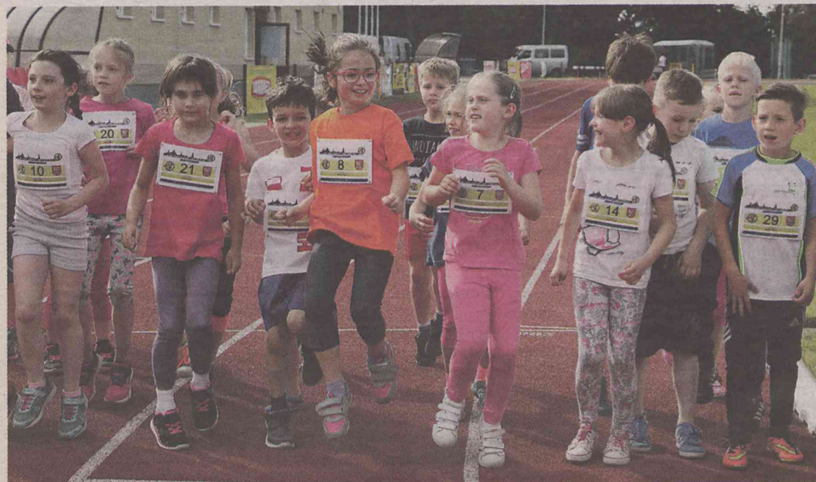
Biegowy narybek miał swoją konkurencję wcześniej