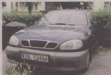
Lanos - ul. Lwowska