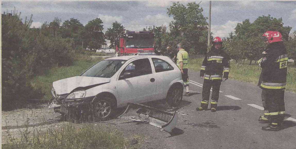
To miejsce powinno być częściej patrolowane przez drogówkę