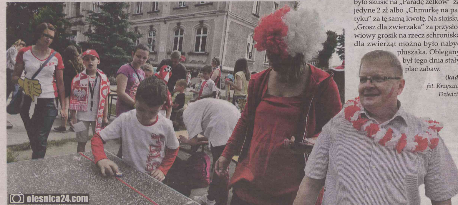
(kad) fot. Krzysztof Dziadzić

Transparent na budynku Szkoły Podstawowej nr 7 informował, że