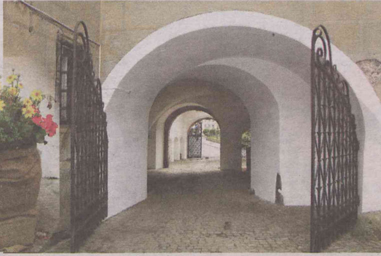
Niemożliwe! Oleśniczanie mogą tu wejść...

Druga pozytywna nowinka to uporządkowanie zabytkowego przejścia z podcieniami. Nie wiedzieć czemu, wcześniej użytkowane było ono jako składowisko wszelkich rupieci. W tym malowniczym miejscu przez długi czas stał zdeze-