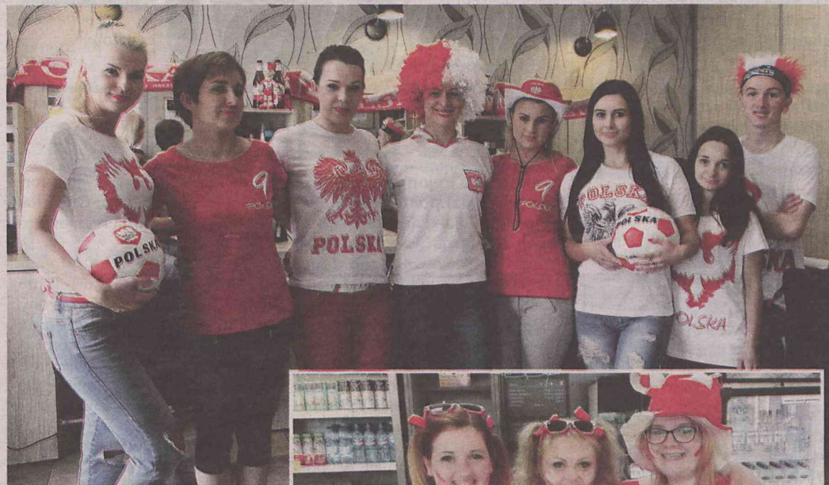
Strefa Euro w salonie urody