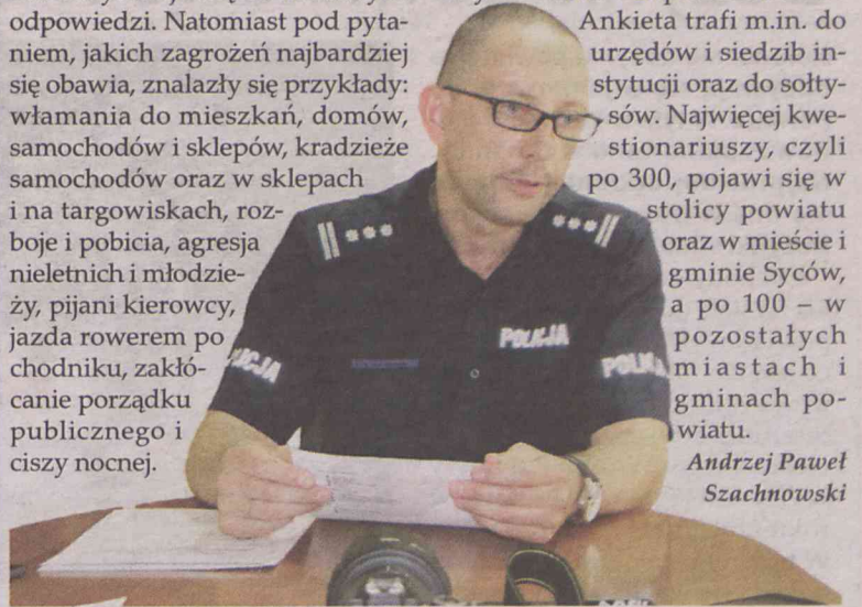
Komendant ma pomysł. Czy to poprawi bezpieczeństwo?