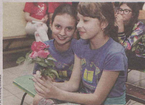
Nam się „Wieczór dla Ziemi” podoba...