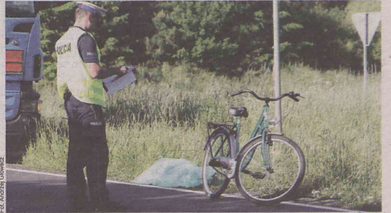
Chwila nieuwagi z tragicznym finałem

skrzyżowaniu drogi nr 25 w Drołowicach (gmina Syców). 57-letnia mieszkanka Drołowic, jadąca rowerem, wykonała nagle skręt w lewo, nie sygnalizując go - jak wynika ze wstępnych ustaleń - ręką. Uderzyła w nią jadąca z tyłu ciężarówka. Kobieta poniosła śmierć na miejscu. (OAI)