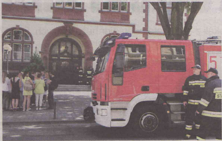
Alarmy okazały się fałszywe

„W tutejszym urzędzie nastąpi eksplozja, będzie masakra, bomba z trucizną”. E-mail o takiej treści dotarł w tym dniu w do urzędów i instytucji w kilkudziesięciu miastach w Polsce. Również w powiecie oleśnickim.