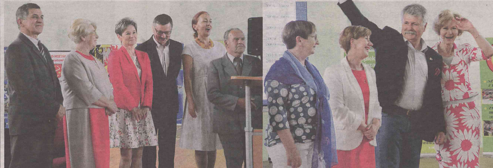
Spotkanie po latach - czas wzruszeń...

BIERUTÓW. „Rolnik” obchodził okrągły jubileusz. Jego uczniowie z nostalgią wspominali młodość w murach szkoły.