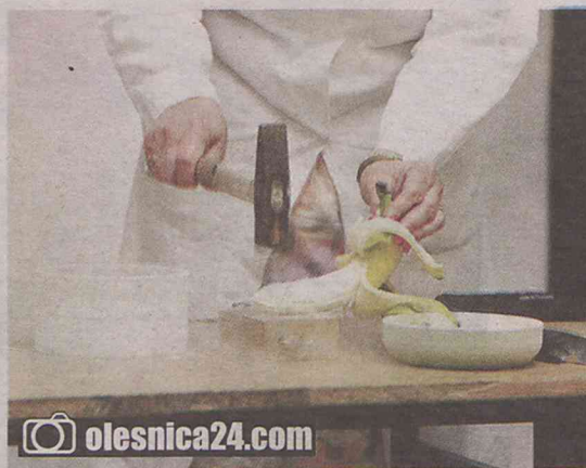
Doświadczenie z bananem

TWARDOGÓRA. Gimnazjum nr 1 przygotowało moc atrakcji. Były warsztaty, pokazy i konkursy.