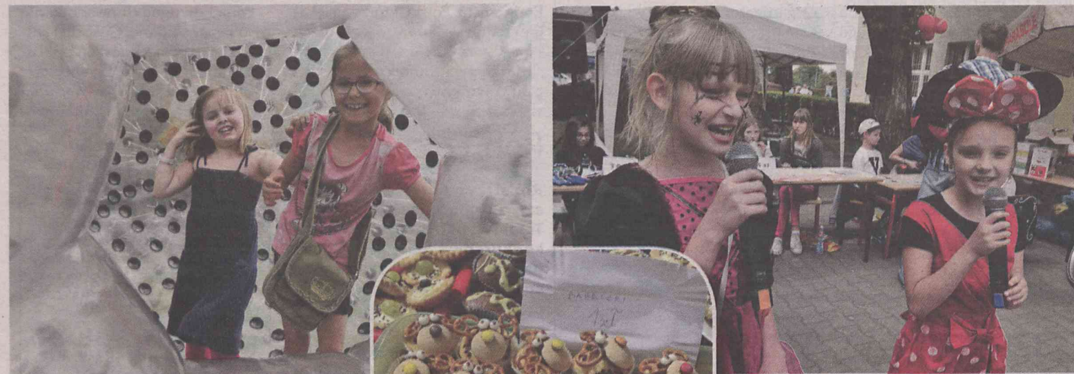
Przejażdżka w plastikowej kuli

Tego dnia swoje doroczne plenerowe zabawy miały Czwórka i Siódemka. Ta pierwsza postawiła na gastronomię, druga na akcenty piłkarskie w związku z Mistrzostwami Europy.