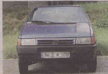
Fiat uno - ul. Wileńska