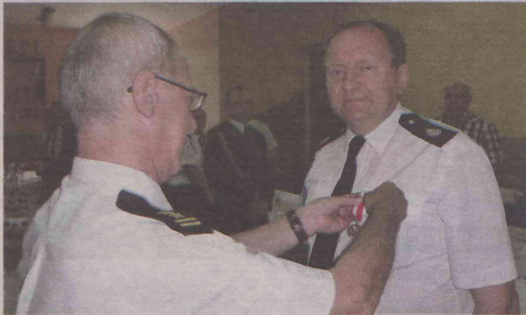
Komendant burmistrzowi za zasługi