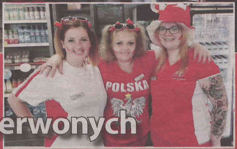
Strefa na stacji paliw

Pomysł strefy kibica nad stawami upadł, bo miał kosztować 100 tys. zł. Swoiste strefy kibiców tworzą więc sami kibice. I w lokalach, i w domach, i - jak pokazują nasze przykłady - również w punktach handlowych i usługowych.