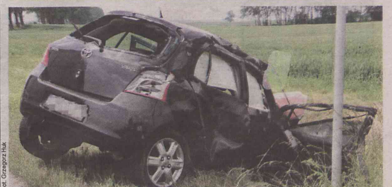
Przerazające efekty zderzenia dwóch aut...