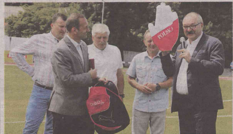
Nowoczesny stadion uroczysto otwarty!