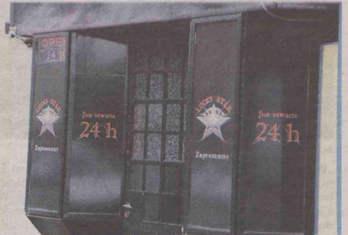
Kiedyś kioski „Ruch” i warzywniaki - dziś jaskinie hazardu...

Warto przy tym podkreślić, że urządzającym gry jest właściciel automatu, ale również może nim