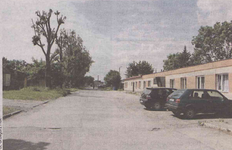
Ulica Kopernika będzie remontowana

Po jakimś czasie, też na zasadzie „kaskady”, samorząd wojewódzki podjął decyzję o pozabawieniu ulicy Wojska Polskiego kategorii drogi wojewódzkiej - tym samym stała się ona drogą powiatową. Podob-