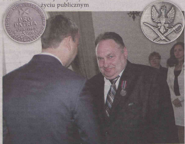
Medal trafił do mieszkańca Oleśnicy

„Pro Patria” ma formę metalowego krążka o średnicy 36 mm, fakturowanego, srebrzonego i oksydowanego. Autorem projektu medalu jest artysta grafik Andrzej Nowakowski. (ror)