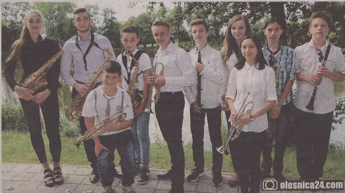
Big Band to prawdziwa wizytówka oleśnickiej Szkoły Muzycznej