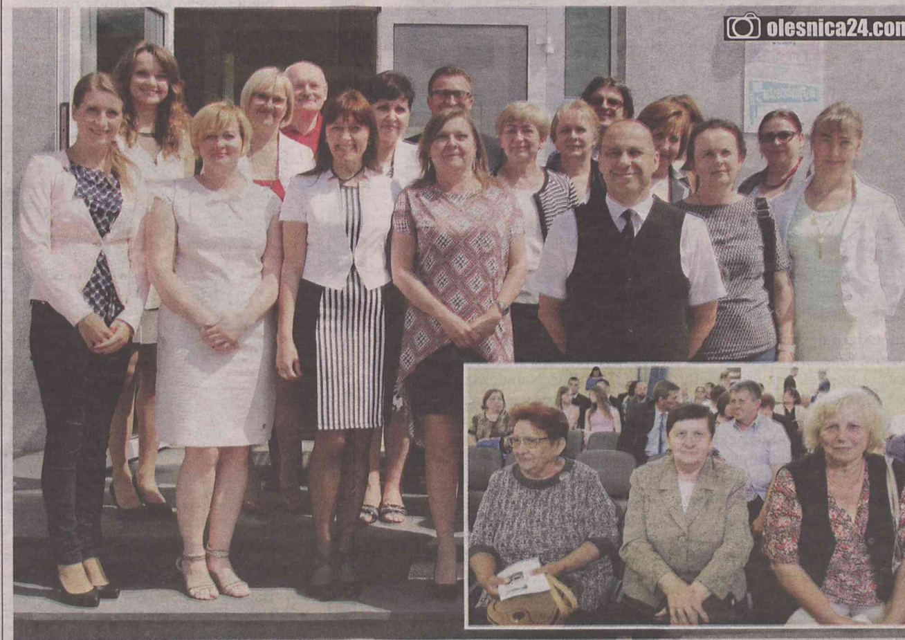
Takie spotkanie to gratka dla fotoreportera

WSZECHŚWIĘTE. Publiczna Szkoła Powszechna została otwarta we Wszystkich Świętych - bo tak wtedy nazywała się wieś - 5 listopada 1945 r. Przez 70 lat kierowało nią 15 dyrektorów, a 101 nauczycieli wykształciło setki absolwentów.