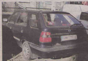
Skoda - ul. Paderewskiego