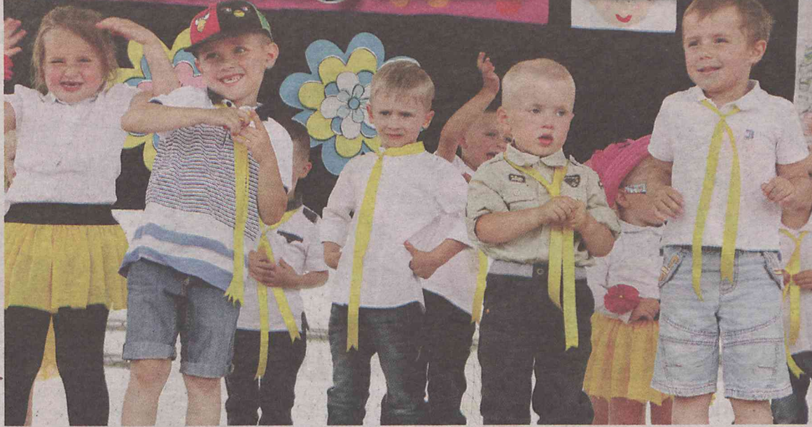
Maluchy dały popis wokalnych umiejętności

W miniony weekend społeczność Katolickiej Szkoły Podstawowej w Oleśnicy nie mogła narzekać na brak atrakcji. W sobotę w ramach czerwcowego święta szkoły zorganizowano V Samochodowy Rajd Krajoznawczy, a w niedzielę tradycyjny piknik rodzinny.