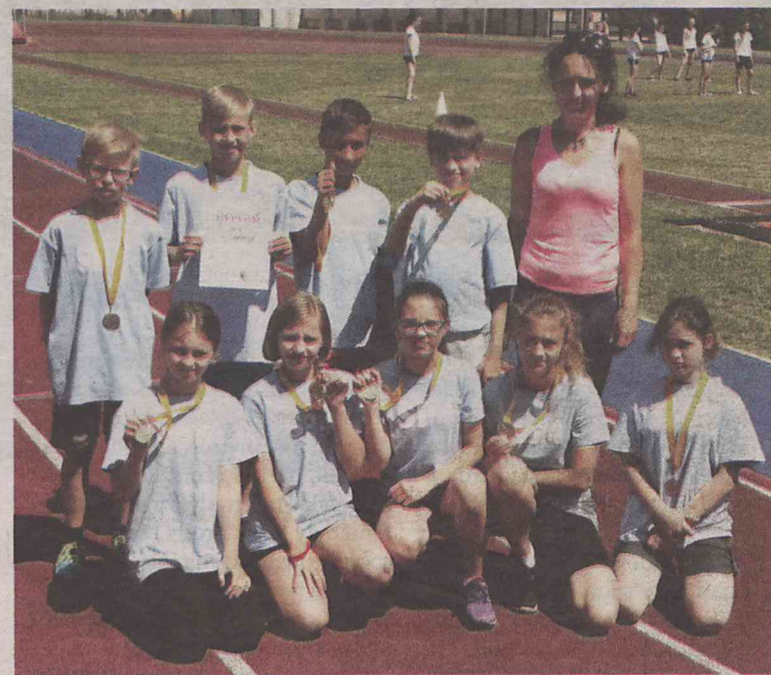
Są medale i jest satysfakcja