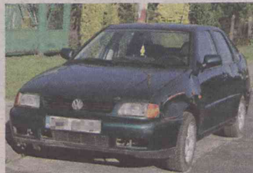
Volkswagen polo - ul. Reymonta