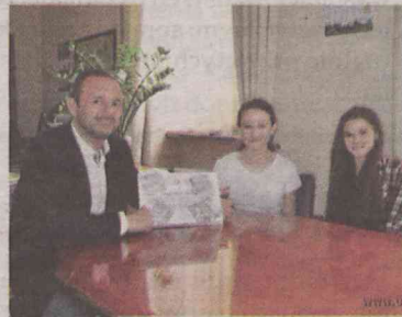
wała się znakomicie, zdobywając drugie miejsce na kontynencie

Oleśnicka drużyna Odysei Umysłu dzięki wsparciu miasta, powiatu, okolicznych firm i osób prywatnych miała okazję uczestniczyć w Eurofestiwalu - największego konkursu kreatywności na świecie. Nasza ekipa zaprezen-