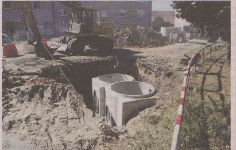
Pojawiły się nieprzewidziane problemy

- Rozmawiałem z kierownikiem budowy. Z jego zapewnień wynika, że prace nie zostały przerwane i cały czas trwają, zgodnie z harmonogramem. W przyszłym tygodniu, o ile nic nie wyniknie dodatkowego i pogoda pozwoli, jest planowane przetrzymanie etapu w drugą stronę