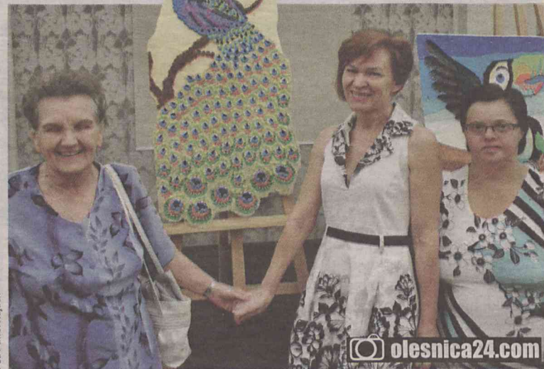
Ptaki jak malowane. I satysfakcja twórców!...

OPTYK LUX SFERA SOCZEWKI PROGRESYWNE - 10% BADANIE WZROKU - PIĄTEK TWÓJ WIEK = TWÓJ RABAT