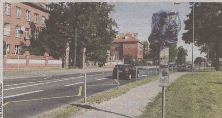
Roboty spowodowały przeniesienie przystanku autobusowego

W ramach zadania na istniejącej jezdni i zatokach parkingowych w