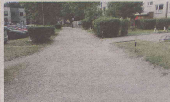
Tu konieczna jest kompleksowa wymiana nawierzchni

- Dookoła wszystkie chodniki zostały elegancko zrobione, położono kostkę. A ten od tyłu lat po prostu straszy. Nie wiadomo, czy to chodnik, czy to zapomniana przez wszystkich droga - mówi nasza czytelniczka.