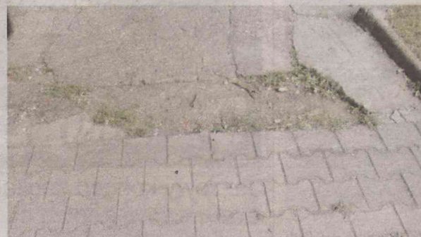
Ten chodnik za blokiem wymaga pilnego remontu

Co z chodnikami po obu stronach wieżowca na Klonowej 12? Terazniejszość jest taka, że wszystkie trzy wymagają kapitalnego remontu. A jaka będzie ich przyszłość?