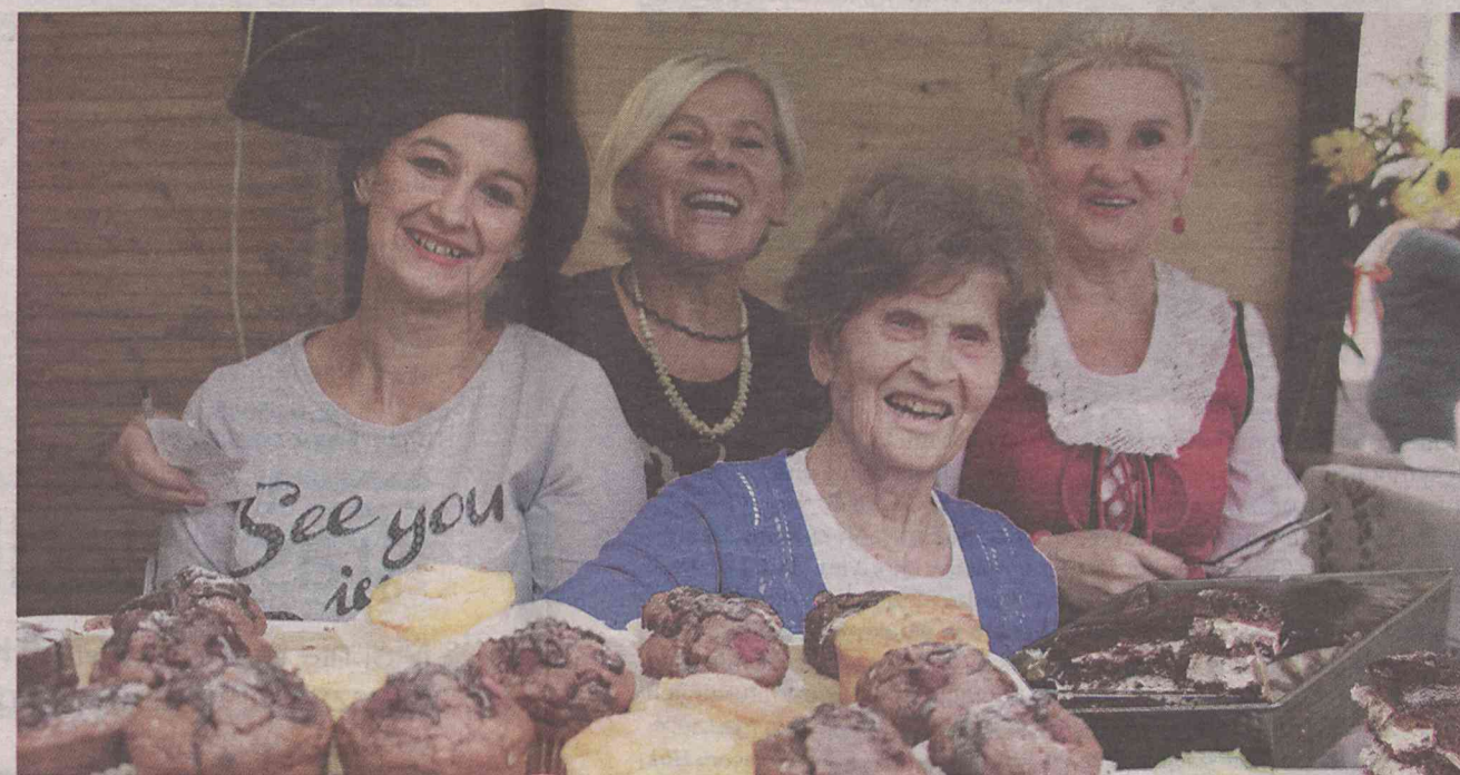
Nie sposób było przejść obok i nie skosztować