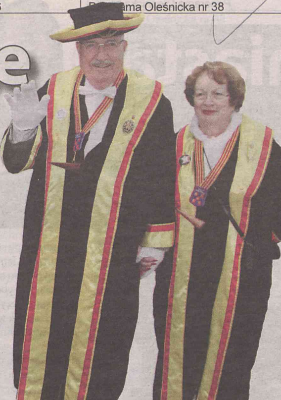
Goście z Warendorfu