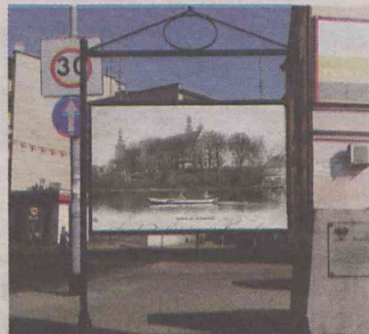
Tak mogą wyglądać tablice ze starą Oleśnicą

Pomysł radnego został zaakceptowany przez burmistrza oraz dyrekcję Biblioteki i Forum Kultury. Forma i treść prezentowanych