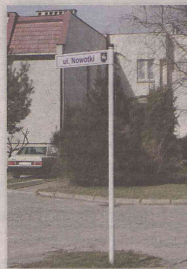
Skansen PRL-u w Sycowie

Ale ustawa z kwietnia tego roku nie pozostawia samorządowi wyjścia. „Jednostki samorządu terytorialnego albo związki jednostek samorządu terytorialnego i związki metropolitalne mają ustawowy obowiązek - w terminie 12 miesięcy od dnia wejścia w życie ustawy - zmienić nazwy budowli, obiektów i urządzeń użyteczności publicznej, w tym dróg, ulic, mostów i placów, upamiętniające oso-