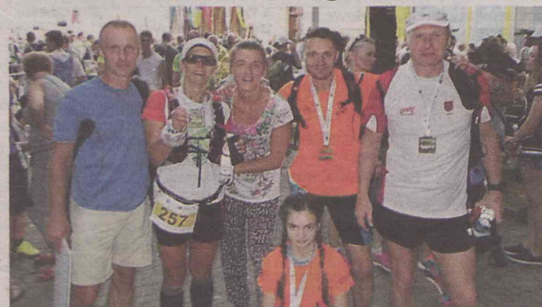
Reprezentacja biegowej Oleśnicy