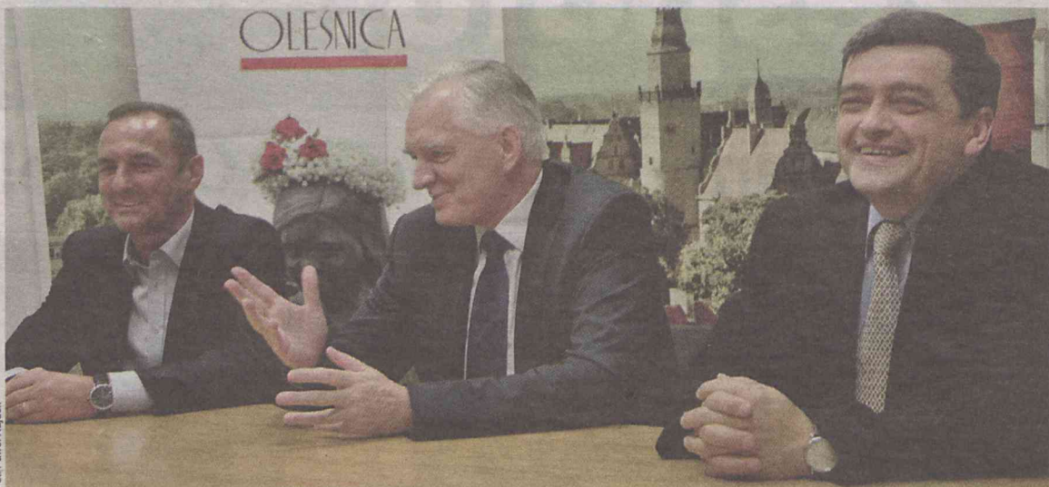
Czy obecność wicepremiera przyspieszy decyzje w sprawie lotniska?

Dzięki wicepremierowi dowiedzieliśmy się, że zainteresowanie Politechniki Wrocławskiej naszym lotniskiem jest nadal aktualne.