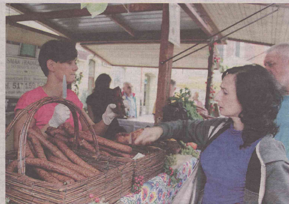
Czujecie ten zapach swojskiej kielbaski?