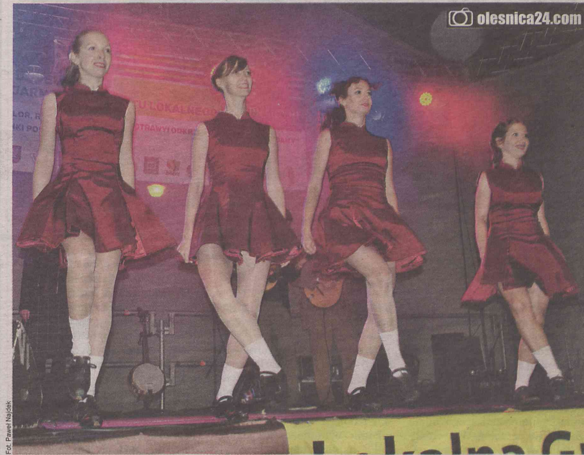
Krótkie spódniczki noszą na Wyspach nie tylko Szkoci

Dodatkową atrakcją były pokazy taneczne w wykonaniu dziewczyn z zespołu tańca irlandzkiego – Ellorien z Wrocławia.