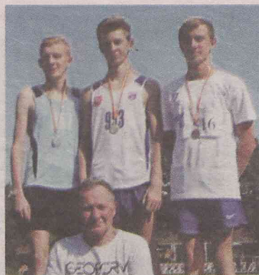
Medaliści i ich trener