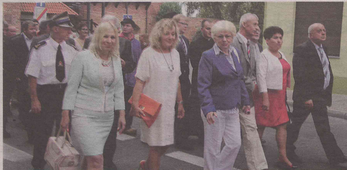
W dożynkowym korowodzie znaleźli się dyrektorzy powiatowych jednostek, radni...