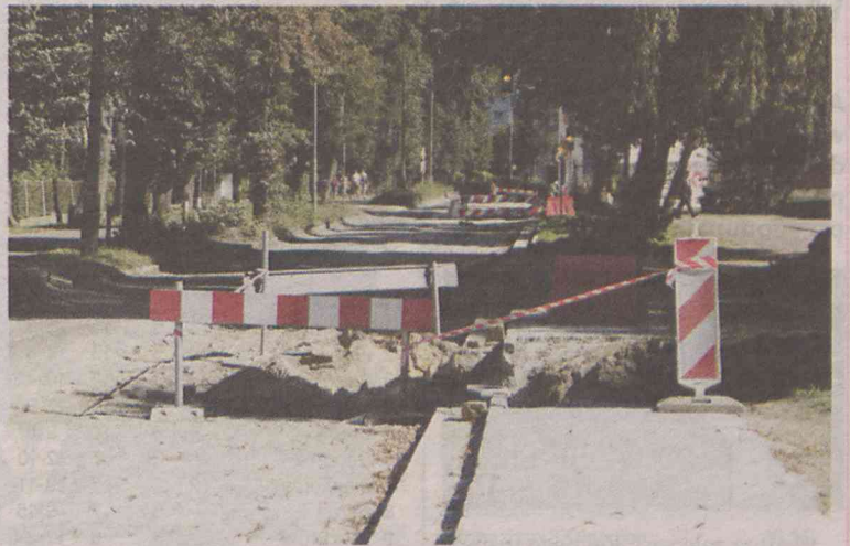
Kierowcy czekają na finał remontu