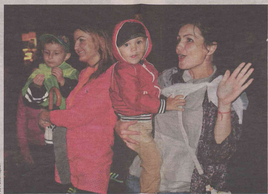
A i pod sceną emocji nie brakowało