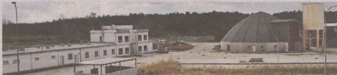
Inwestycja zakończy się w tym roku