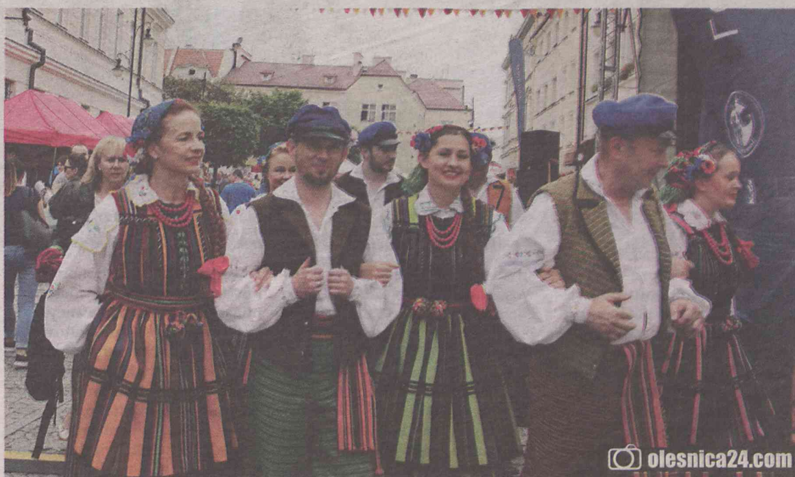
Europa Europa, a my Słowianie folklor kochamy