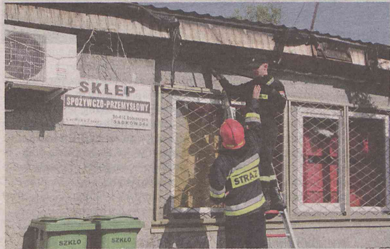
Sklep będzie nieczynny

Mieszkańcy Sadkowa mają kłopot, bo sklep szybko nie zostanie otwarty. Teraz na zakupy muszą jechać do pobliskich Strzelec albo oddalonej o kilka kilometrów Łuczyny. (hag)