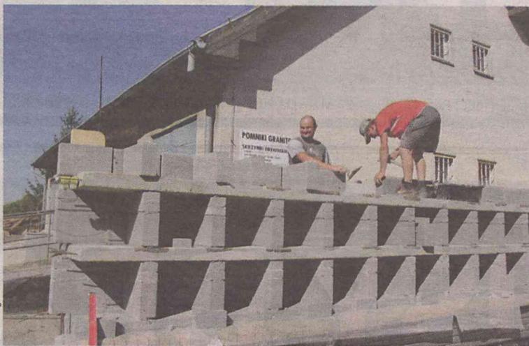
Będzie tu miejsce dla 117 urn

O tym, że powstaje kolumbarium w Oleśnicy, już w Panoramie pisaliśmy. Niedługo zostanie ono oddane do użytku. - Rozbudowa cmentarza nr 3 i budowa kolumbarium przy Wileńskiej