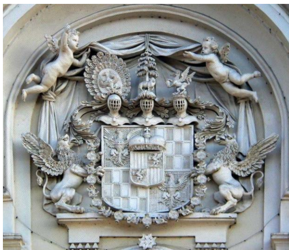
Herb Schaffgotschów na fasadzie pałacu w Cieplicach Zdrój (Bad Warmbrunn) nad głównym wejściem (owca stoi pod sosną).