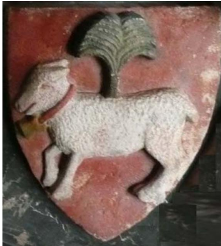
Herb Schaffgotschów na tumbie Bolka II († 1368) w krypcie książęcej kościoła klasztornego w Krzeszowie (Grüssau)