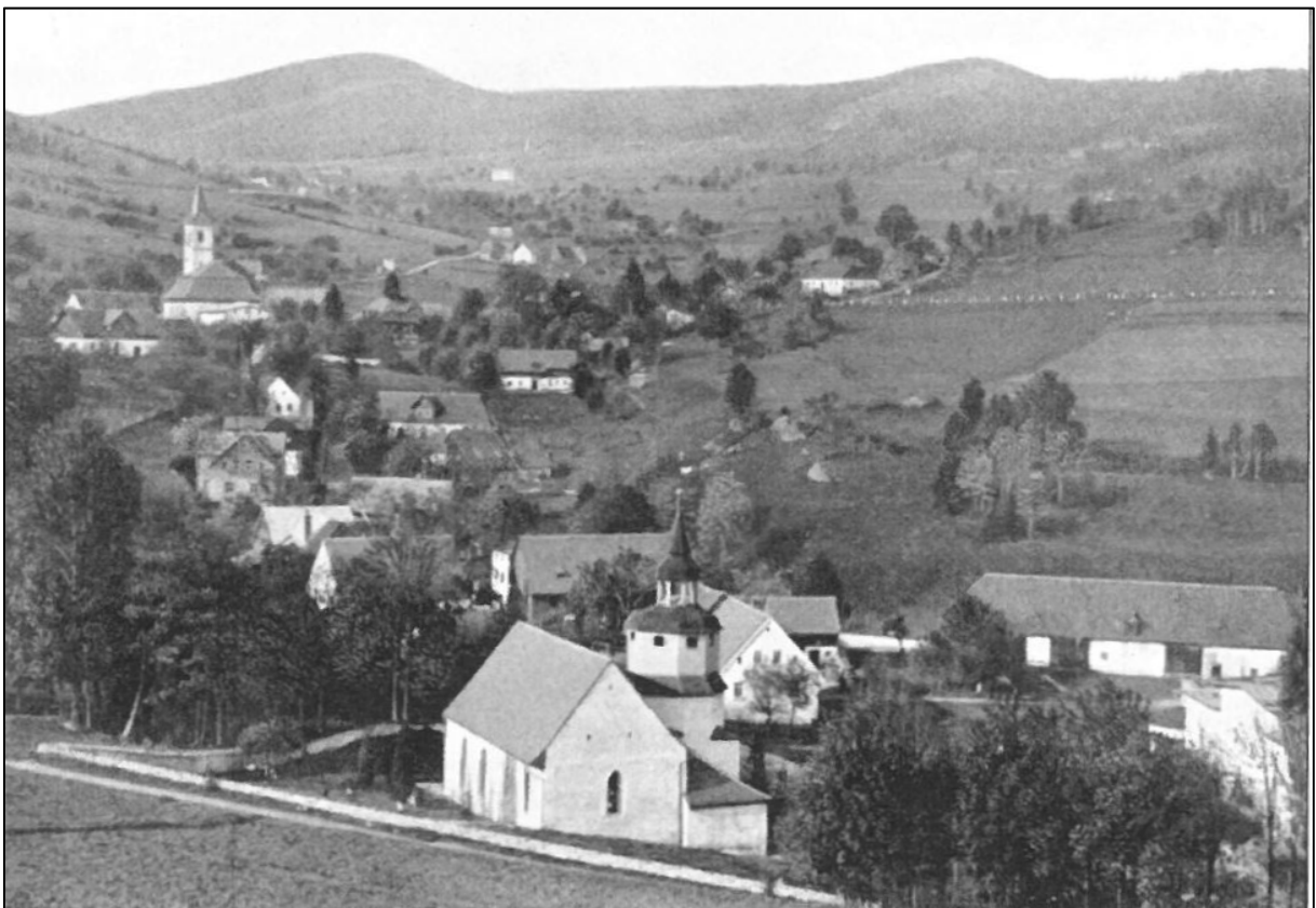
Ansicht von Nieder-Schreiberhau mit der alten katholischen Kirche (Marienkirche, vorne) und dem evangelischen Bethaus