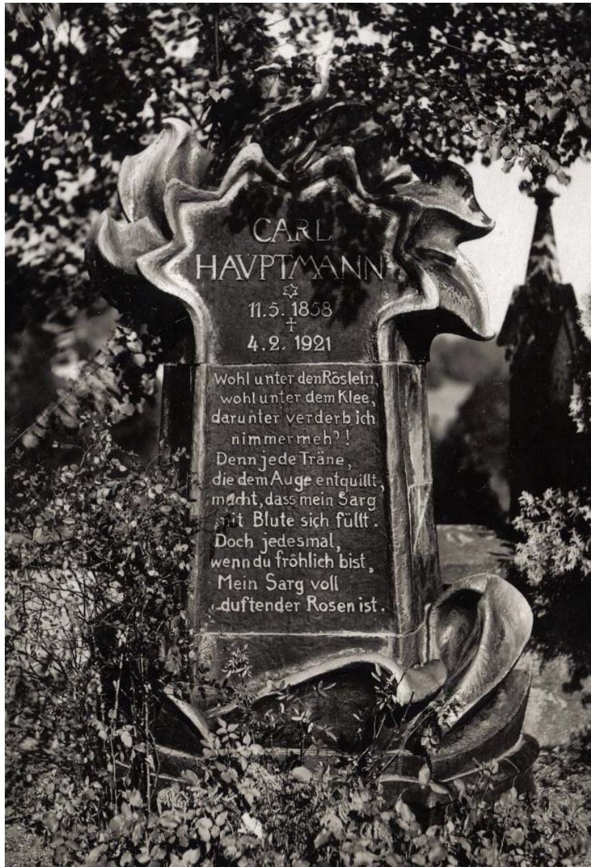
Grabdenkmal für Carl Hauptmann, nach der Restaurierung steht es heute im Garten des >Dom Carla i Gerharta Hauptmannow<.