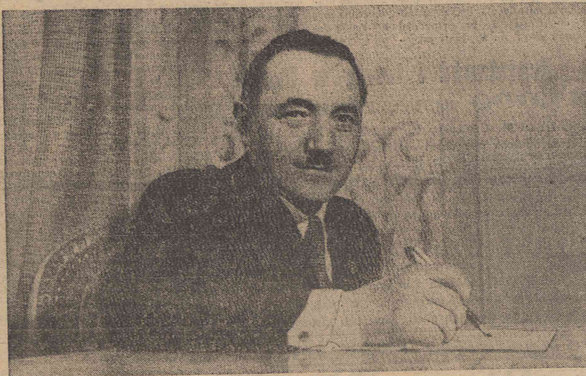
Prezydent Rzeczypospolitej Polskiej, Bolesław Bierut, obchodzi dziś dzień swych imienin. Cały Naród śle w tym dniu Pierwszemu Obywatelowi Rzeczypospolitej jak najserdeczniejsze życzenia.

Najtrudniejszy, jak zwykle był początek. Manifest Lipcowy dał wielki impuls, ruszył naprzód koło rozpędowe polskiej historii. Toczyć się ono będzie dalej, choćby zrywały się odosobnione protesty, choćby ktoś chciał sabotować reformę rolną, spekulować na cenach, szukać łatwych zarobków czy kariery. Plewy odpadną, bo muszą opaść. Naród, który raz wybrał właściwą drogę, z drogi tej nigdy już nie zawróci.