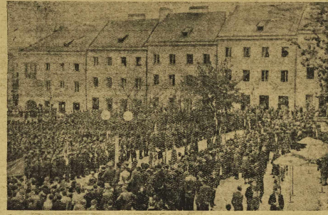
W rocznicę uwolnienia Warszawy ludność Warszawy manifestacyjnie witała na rynku Marien-Placzie uwolnioną przez wojska polskie.

Program unowocześnienia wojska, program unowocześnienia wojska, program unowocześnienia wojska, program unowocześnienia wojska, program unowocześnienia wojska.