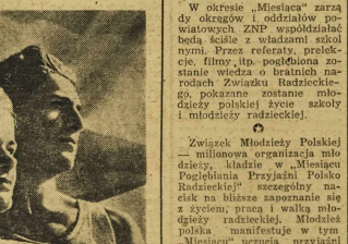
IDEALY TWORCÓW PARTII RADZIECKIEGO WIELKA W ZW. GŁ. MŁODZIEŻ — WYRAZICIEL SIŁY I TRZYJNY NARODÓW ZSRR.

Wiemy, jakie owce ta polityka zdrady przyniosła narodowi polskiemu. Ona to dała nam pięć i pół lat niewoli, śmierci zniszczenia kraju i półtora setki milionów ludzi. Dalszy rozwój wydarzeń był taki, jaki przewidywać nie ludzie, którzy w narodzie naszym byli panami. Polska oddzieliła się po raz drugi od siłom, powstałym z rewolucji socjalistycznej. Wol-