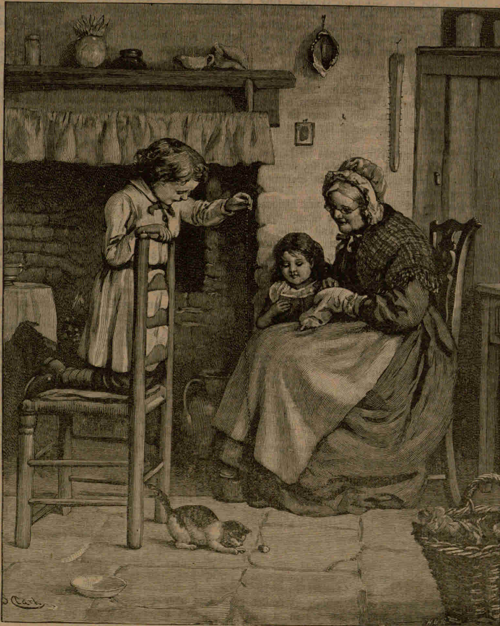
Bei der Großmutter.

Staunen betrachteten. Es ließ sich gar nicht ausdenken, daß unsere Mutter einmal so klein gewesen. Und dabei tickte die bunte Schwarzwälderuhr so gemüthlich, und die Bratäpfel im Ofen zischten den ganzen Winter hindurch so verführerisch, daß uns Großmutter's Stübchen immer wie ein halbes Paradies erschien, aus dem verbannt zu sein für uns die härteste Strafe war. Nun schlummert die liebe Alte schon längst im stillen Grabe, aber ihr freundliches Bild und ihre guten Worte werden noch lange in den dankbaren Herzen ihrer Enkel fortleben. S. N.