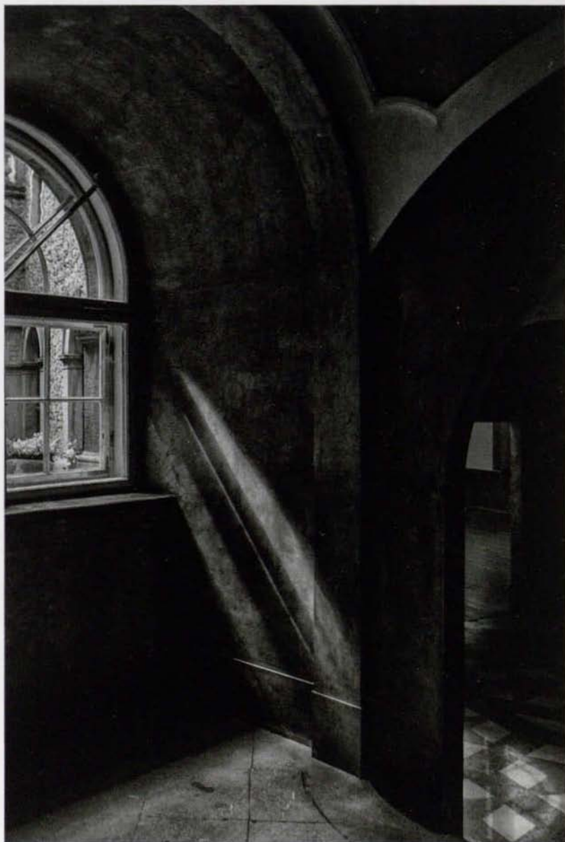
Zamek Książ, 2013 r.