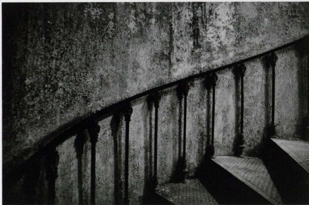
Cieplice – Pałac Schaffgotschów, 2015 r.