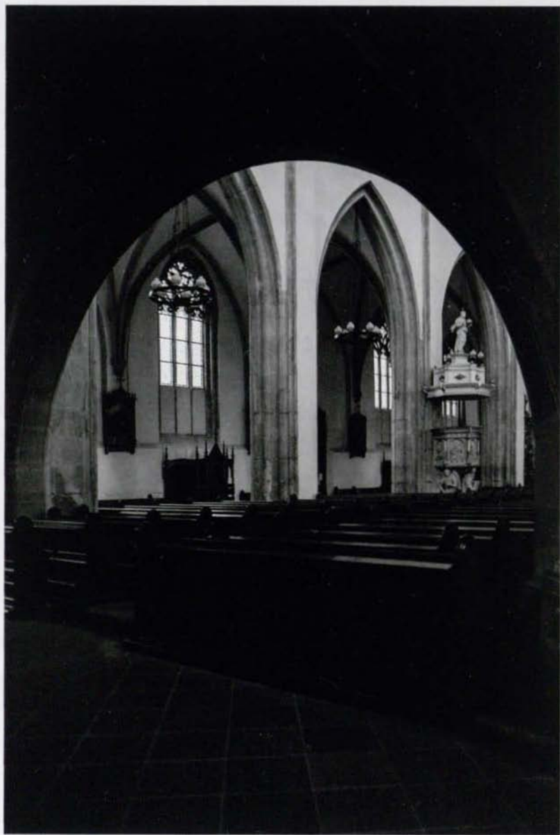
Strzegom, Bazylika Mniejsza św. App. Piotra i Pawła, 2010 r.