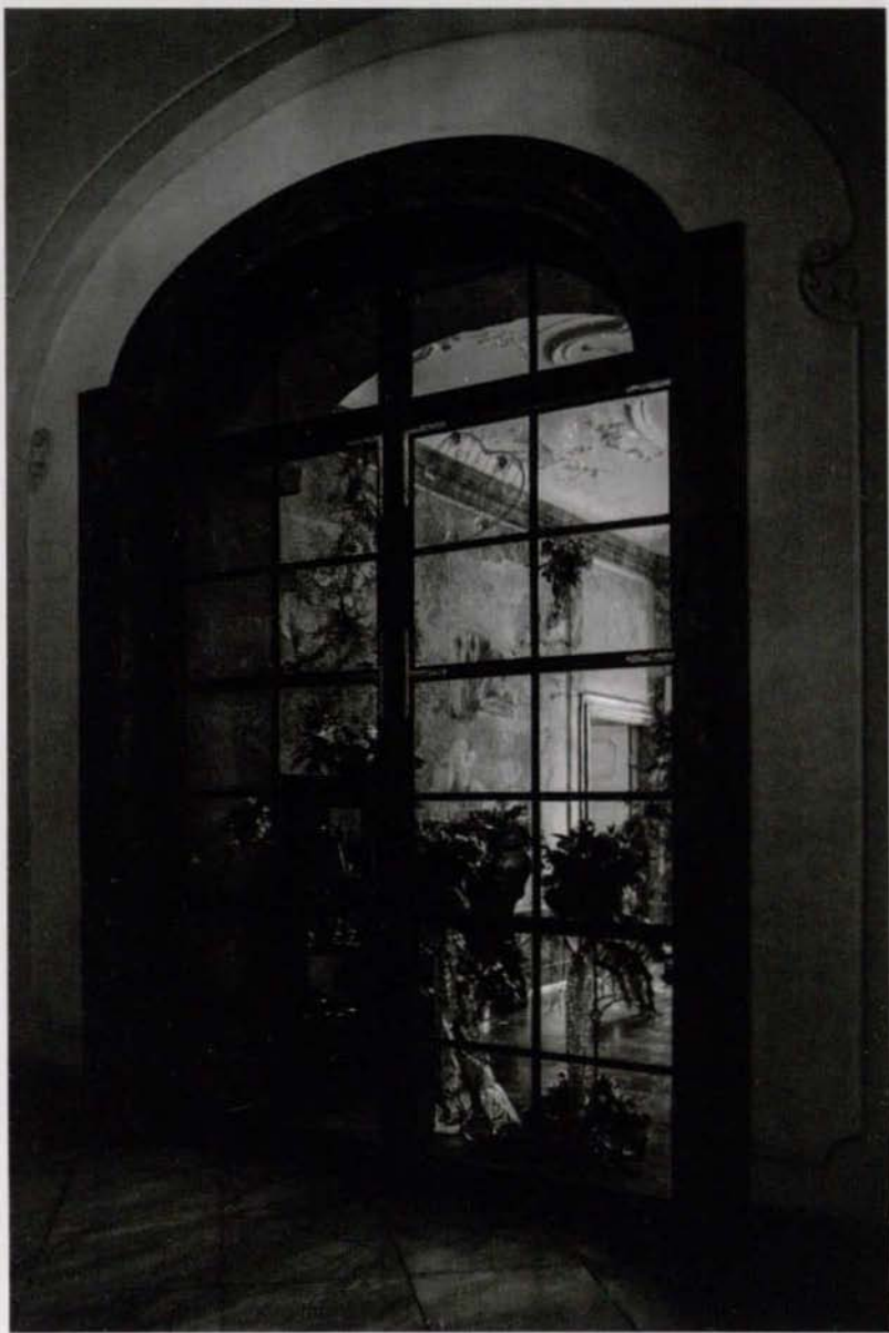
Zamek Książ, 2013 r.