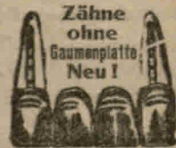
Schloßplatz Nr. 4.

Sprechstunden 8-6 Uhr, Sonntags 8-2 Uhr.