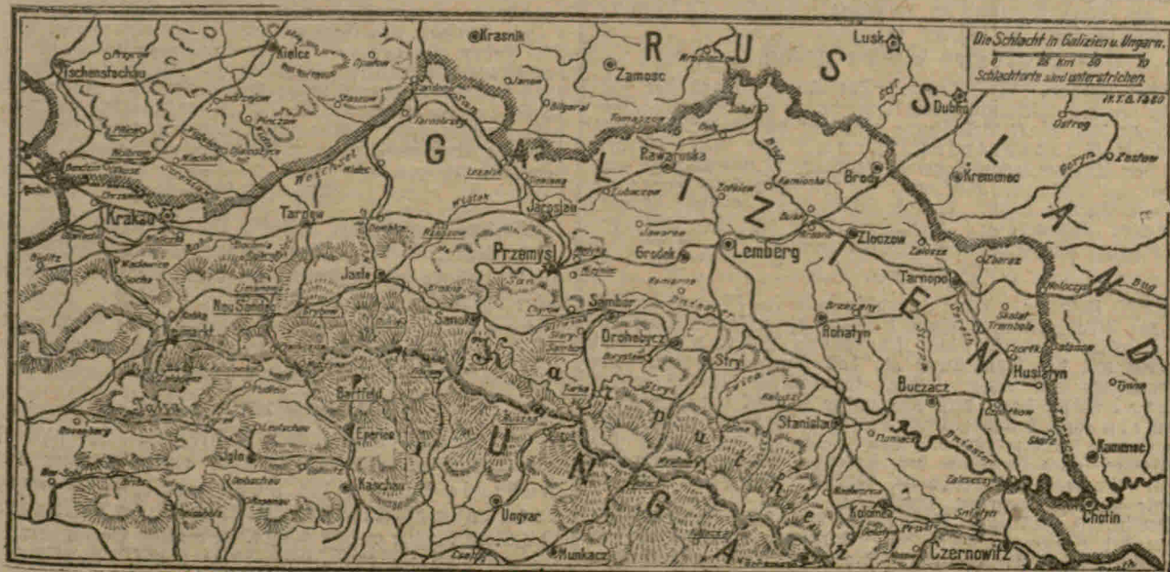
Zu den Kämpfen in den Karpathen.

wb. Konstantinopel, 8. Februar. Der Senat beriet heute in Gegenwart des Thronfolgers, der hervorragendsten Kabinettsmitglieder, vieler Abgeordneter der Kammer und eines zahlreichen