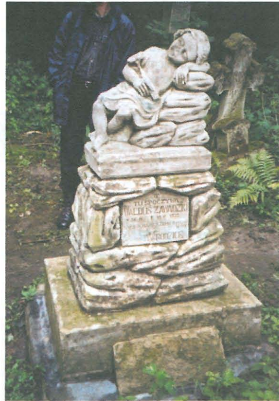
Berezowica Mała – grób na cmentarzu grzebalnym