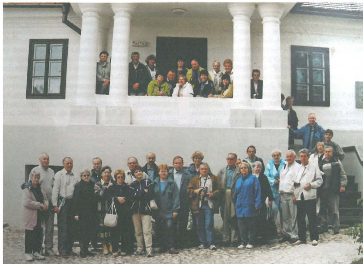
Muzeum Juliusza Słowackiego w Krzemieńcu na Wołyniu. Wycieczka członków TMLiKPW w Lublinie

Wzrost zainteresowania Kresami i ich tradycją sprawił, że w 2004 r. aż pięć osób wyjechało na kolejny „Opłatek Lwowski” do Lwowa.