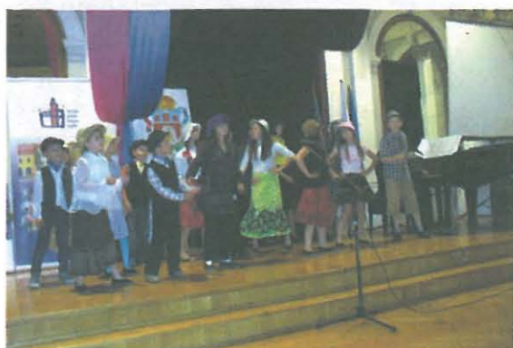
Orlęta z Brzozówki hulają po Łyczakowie.