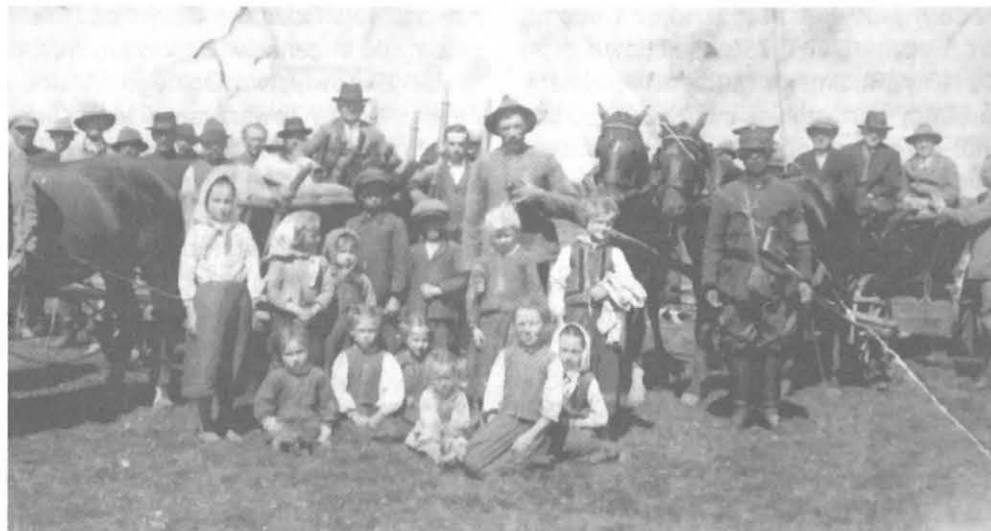
Ewakuacja rodzin z Połonic do Biłki Królewskiej, 1943 r.