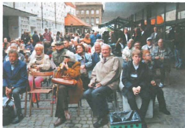
Występy na Rynku

W samo południe, na Starym Rynku, Młodzieżowa Orkiestra Dęta z Tarnowa Podgórnego dała sygnał do