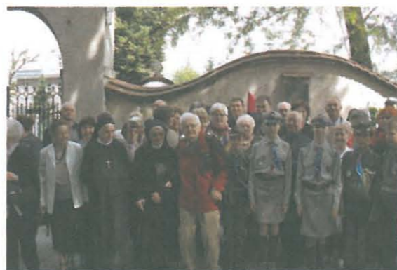
Po wspólnej modlitwie pod Lwowskim Kurhanem na Starym Cmentarzu w Tarnowie

A na zakończenie, przekazane słowami M. Hemara przesłanie: