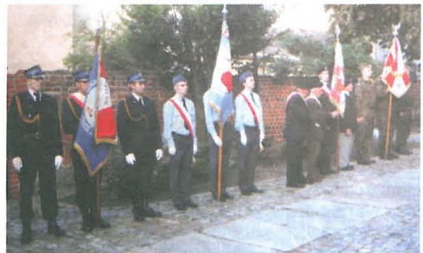
W Gnieźnie 11 lipca wspominano ofiary rzezi na Wołyniu

Terror ludności polskiej na Wołyniu i południowo-wschodniej części II Rzeczypospolitej rozpoczął się