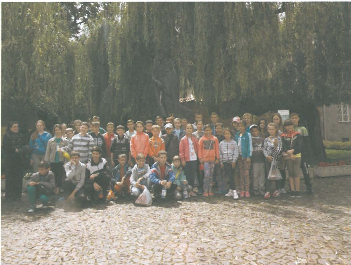
Tarnowianin, generał Józef Bem, to postać znana uczestnikom kolonii.

temat wojennych losów Polaków na Kresach, narodzin polskiego skautingu.