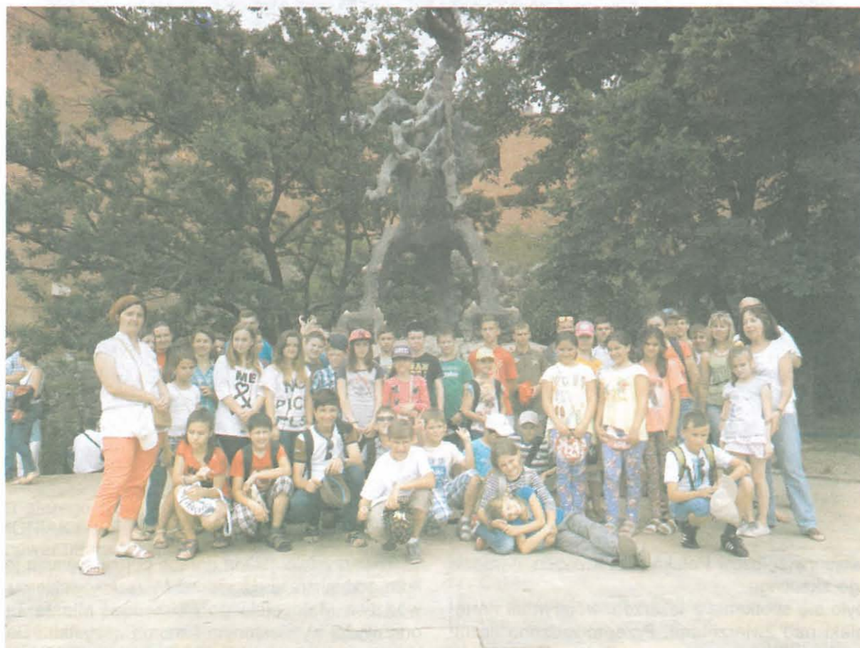
Smok Wawelski nikomu nie straszny

Wiadomo że sytuacja gospodarcza i polityczna na Ukrainie Stwarza ludziom szereg poważnych uciążliwości, które skutkują niepokojem, trudnościami ekonomicznymi u szeregiem ograniczeń. Dodatkowo, liczne rodziny dotknęły i nadal dotyczą wielkie tragedie. Uwzględniając fakt, że wielu naszych Rodaków zamieszkuje na Ukrainie i nawet w warunkach spokojnych nie wiodło się im najlepiej, można poważnie obawiać się o ich los. Smutne, ale prawdziwe jest także to, że wobec trudów dnia codziennego inne sprawy, jak dbanie o tożsamość narodową, pielęgnowanie tradycji narodowej wschodzą na dalszy plan.