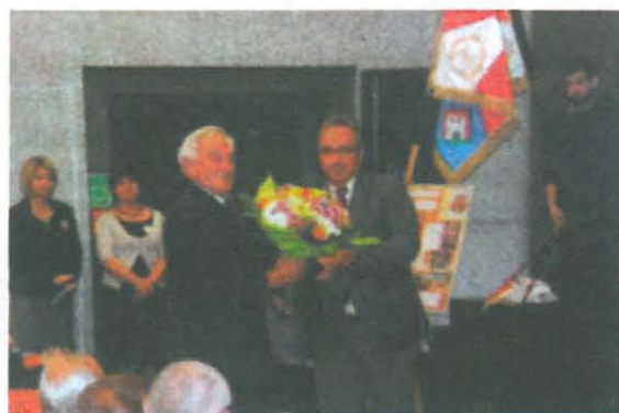
W CIK „Orzeł” odbyło się posiedzenie ZG TMLiKPW, promocja książki oraz wystawa

oraz licznie zgromadzonych Kresowian i mieszkańców Bolesławca.