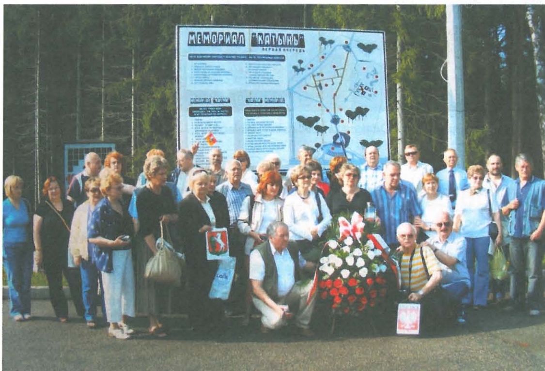
Członkowie lubelskiego oddziału TMLiKPW w Katyniu w 2008 r.

W ubogiej powojennej rzeczywistości nasi rodzice z miłością mówili o czasach przedwojennych i o Lwowie. I choć znali to miasto tylko z opowieści, byli nim zachwyceni. Śpiewali piosenki o pannie Franciszce, „Tylko we Lwowie”, „Czerwony pas”, „Za Niemen”, „Polesia czar”, „Na ulicy Kopernika”, „Czerwony kapelusik”, „Sokoły”. Utwory te były również wykonywane na weselach. Jako dzieci słuchaliśmy utalentowanych krewnych, podziwialiśmy ich wykonanie i uczyliśmy się ich na pamięć. Rodzice śpiewali pieśni kresowe do późnej