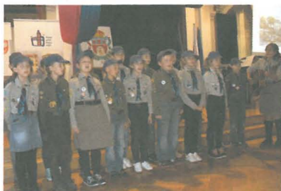
Pieśń „Harcerska dola radosna” w wykonaniu druhow ze Szkoły Orłąt w Tarnowie

Coraz tu ktoś upada obok. Coraz topnieją nasze rzędy i dawnej słycać krzyk komendy „SZLUSUJ!” I ścieśnia się czworobok I zamykają się szeregi, bez przyjaciela, bez kolegi.