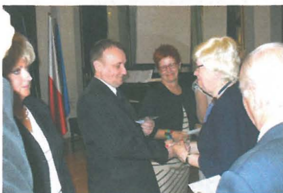
Odznaczenia otrzymują pracownicy Urzędu Miasta Tarnowa, za wiele lat współpracy z Oddziałem.

owników administracji współpracujących od wielu lat z Towarzystwem, nauczycieli szkół z Tarnowa i Brzozówki oraz zasłużonych członków TMLiKPW.