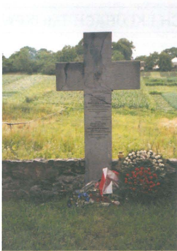
Berezowica Mała – zbiorowa mogiła pomordowanych przez OUN-UPA na cmentarzu grzebalnym

Pogrom mieszkańców Berezowicy Małej nastąpił w nocy z 22 na 23 lutego 1944 r. Od strony Wołynia furmankami i saniami nadciągnął oddział UPA, który poprzedniego dnia dokonał masakry na Polakach w wołyńskim Wiśniowcu. Akcja nacjonalistów ukraińskich rozpoczęła się od wymordowania mieszkańców przysiółka położonego kilometr od wsi. Banderowcy podchodzili w ciszy, wykorzystując w ten sposób element