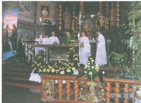
Msza św. koncelebrowana przez Proboszcza Parafii św. Apostołów Piotra i Pawła w Bydgoszczy

wian w życiu gospodarczym, naukowym i kulturalnym Bydgoszczy i Regionu. Co roku mowę w imieniu organizacji kresowych wygłasza przedstawiciel innego stowarzyszenia. W kościele były sztandary, m.in. Związ-