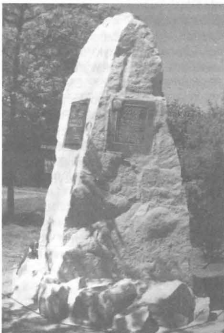
Obelisk poświęcony mieszkańcom przybyłym do Bolesławca w 1945 r.