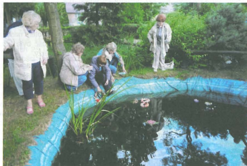
Puszczanie wianków na wodę