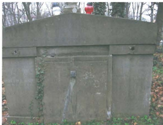
Grób Gertrudy Teodorowiczowej przed remontem

W grobowcu Antoniego Stefanowicza konieczny był demontaż wierzchniej części, z powodu wykruszenia