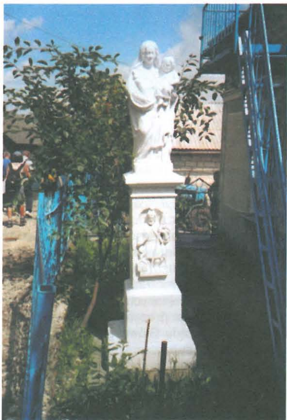
Dubowce – figura Matki Boskiej z Dzieciątkiem

W lutym 1944 r. mieszkańcy Berezowicy Małej byli wykorzystywani przez Niemców do budowy umocnień przeciwko nadciągającej Armii Czerwonej. Z powodu zmęczenia tymi pracami członkowie samoobrony nie mieli siły pełnić jeszcze wart, tym bardziej, że liczono