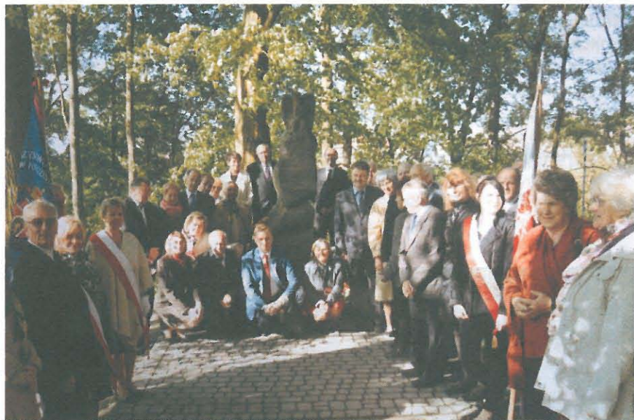
Towarzystwo przy pomniku Orłąt na urzędowskich wałach