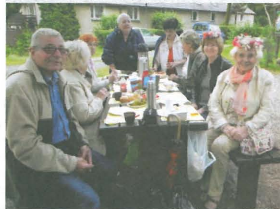
Jeden z ośmiu stołów biesiadnych dookoła ogniska – na „wiankach”

Już od ponad dwudziestu lat w tym dniu Towarzystwo nasze organizuje „tradycyjne wianki” w zaprzyjaźnionej Leśniczówce „Białe Błota”, koło Bydgoszczy. Panie przygotowują i plotą piękne wianki i razem z palącymi świeczkami puszczamy je na wodę.