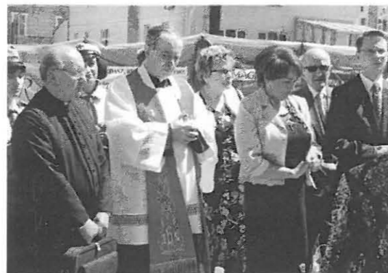
Przed poświęceniem tablicy

Od pierwszych lat istnienia naszego Klubu staramy się pomagać rodakom pozostałym na zabranych nam ziemiach na wschodzie. O formach tej pomocy pisałam w poprzednich artykułach umieszczanych na łamach „Semper Fidelis”.