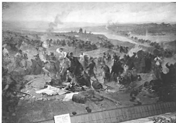
Zborów – Muzeum Bitwy Zborowskiej, diorama bitwy

W 1727 roku król Józef I Sobieski ponawiając ustawy cechu kuśnierskiego i krawieckiego zabronił partaczom wykonywać swoje zajęcia w promieniu dwóch mil od miasta. Żydzi należący do cechu, jako starozakonni nie uczestniczący w mszach cechowych, zobowiązani zostali do przekazywania dlań po funkcie wosku na Boże Narodzenie i Boże Ciało.