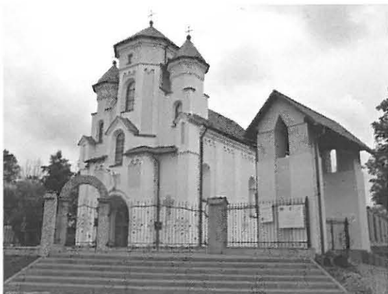
Cerkiew greckokatolicka pw. Świętego Dymitra, obecnie kościół filialny pw. św. Maksymiliana Kolbe w Korytnikach

Od końca XVIII w. w Korytnikach istniał tu zajazd. Po zakończeniu II wojny światowej Ukraińcy zostali wysiedleni na teren obecnej Ukrainy. Ich miejsce zajęli polscy repatrianci z tzw. kresów wschodnich.