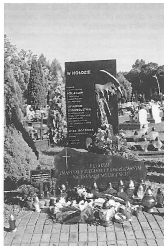
Tablica ludobójstwa na cmentarzu w Tychach

– Dlaczego nie wspominało o tym na salonach pańskich (tam, gdzie mówiono o Sybirze, Katyniu, obozach koncentracyjnych, ale nic o Wołyniu?)