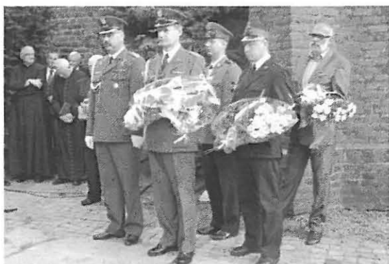
Kwiaty składają delegacje służb mundurowych

ców, ogarnia człowieka przerażenie porównywalne jedynie z tym jakie budzi zbrodnia Holocaustu. Często pokazywany jest tragiczny los Żydów, czy to w filmach dokumentalnych, czy w prasie, a o rzezi na Wołyniu zapominamy. Przed kilkoma dniami rząd Wielkiej Bryta-