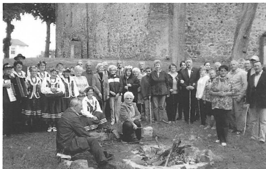
Uczestnicy „Pikniku Kresowego 2015”