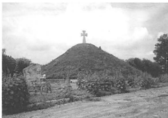
Kurhan z krzyżem na mogile Kozaków Zaporoskich poległych w Bitwie Zborowskiej 1649 roku

Kamila Sarosińska, Piotr Szal (Muzeum Narodowe Ziemi Przemyskiej w Przemyślu)