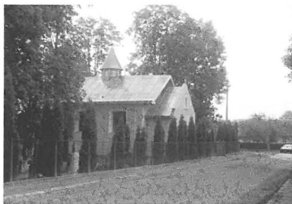
Kosów – kaplica rzymskokatolicka pw. MB Różańcowej

W okresie międzywojennym w Kosowie odbywały się malownicze targi i jarmarki, podczas których można było spotkać Huculów w barwnych strojach ludowych. Targi tygodniowe odbywały się w środy, zaś jarmarki w czwartek po Popielcu według kalendarza juliańskiego.