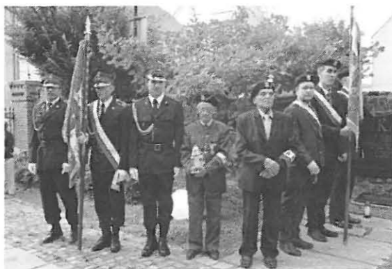
Początki sztandarowe KP PSP i AK