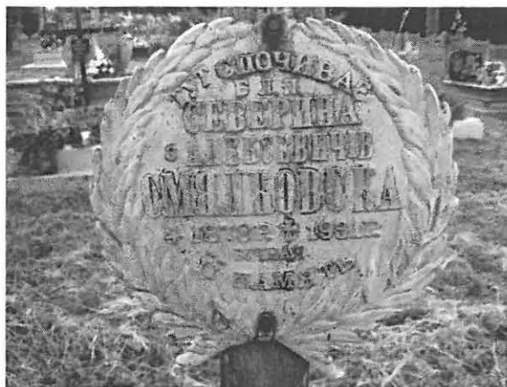
Tabliczka nagrobna umieszczona na drewnianym krzyżu. Cmentarz w Korytnikach

Po chwili jednak wszystko się zaczęło. Najpierw pojedyncze wystrzały kul palących, a następnie serie