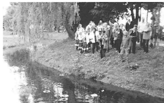
Uczestnicy pikniku puszczażą wianki na rzekę Regę