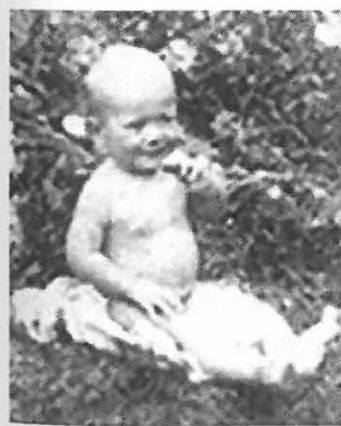
Zdjęcie autora w 1935 r.