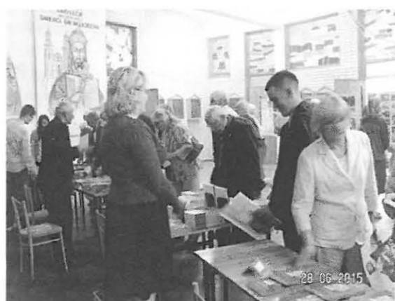
Stoiska z książkami i wydawnictwami. Nasze pierwsze od lewej strony.

niającą wywózkę na Syberię, są tabliczki z nazwiskami tych, co już nie powrócili, względnie zmarli po powrocie, jest wysoki krzyż upamiętniający Polaków zamordowanych przez nacjonalistów ukraińskich spod znaku OUN-UPA i wiele innych kamieni, głazów i tabliczek z nazwiskami ofiar.