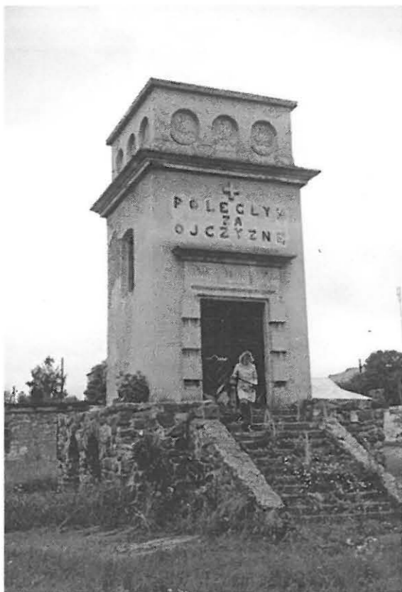
Zborów – cmentarz grzebalny, kaplica w kwaterze żołnierzy polskich poległych w latach 1914 –1920

czaka. Stylem nawiązuje do architektury obronnej. Ma kształt czworobocznej wieży o wysokości 9 m, zwieńczonej attyką i dekorowanej arkadowymi wnękami, w których umieszczono główki aniołków. Na ścianie