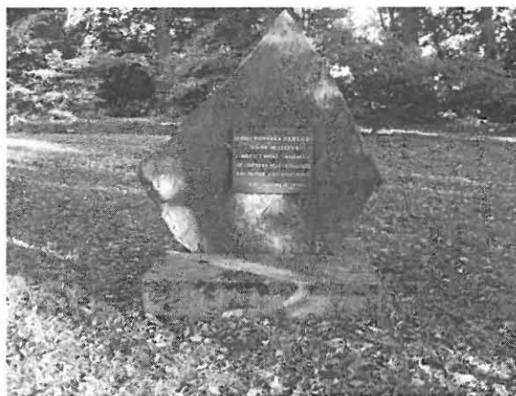
Pomnik w miejscu dawnego cmentarza austro-węgierskiego poświęcony jeńcom wojennym