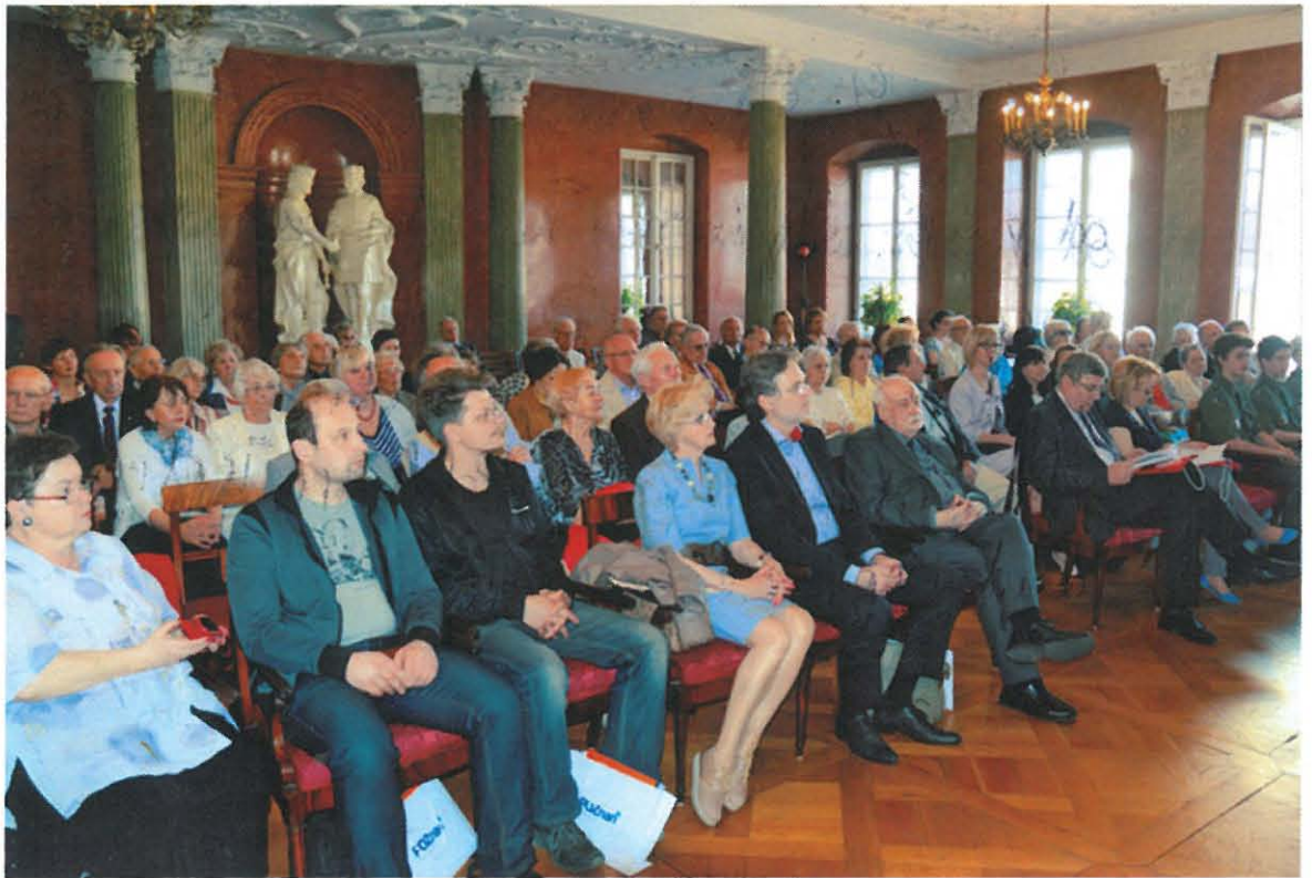
Sala Czerwona Pałacu Działyńskich w Poznaniu. Inauguracja XVIII Dni Lwowa i Kresów – 2015 r.