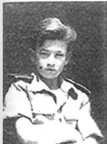
Zdjęcie autora w 1947 r.

Ponieważ podczas pobytu w Palestynie zazwyczaj byłem najmłodszy i najmniejszy w gronie polskich dzieci, wybierano mnie do delegacji, aby witać wizytujących nas generałów. W 1943