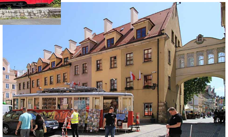
Die Straßenbahn dient als Touristeninformationspunkt auf dem Marktplatz Jelenia Góra. Unter dem Verbindungsbogen wurde eine Straßenbahn als historisches Denkmal erhalten.

Die Erinnerung daran blieb jedoch erhalten. In Podgórzyn Górny, an der ehemaligen Endstation „Niebiański Raj“, wurde eine Straßenbahn aufgestellt.