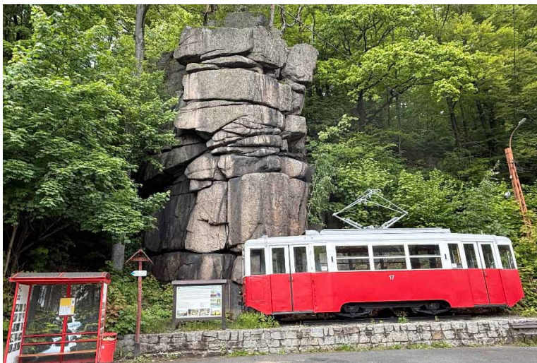
Die Endstation „Himmelreich“ (Himmlisches Paradies) in Podgórzyn.

Die erste Kutsche dient heute als Denkmal mit einer Gedenktafel. Die zweite Kutsche hat ihren Platz auf dem Marktplatz von Jelenia Góra gefunden – sie steht stolz neben dem Rathaus und dient heute als Informationspunkt für Touristen.