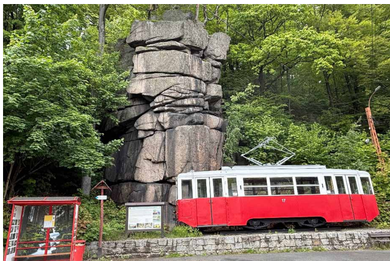
Stacja końcowa „Himmelreich” (Niebiański Raj) w Podgórzynie.

wy pełniący rolę pomnika wraz z tablicą pamiątkową. Drugi z wagonów odnalazł swoje miejsce na jeleniogórskim rynku – stoi dumnie obok ratusza, służąc dziś turystom jako punkt informacji.