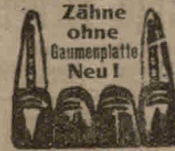
Schloßplatz Nr. 4.

Hauptkhaltestelle d. Elektrisch. Sprechstunden 8-6 Uhr, Sonntags 8-2 Uhr.