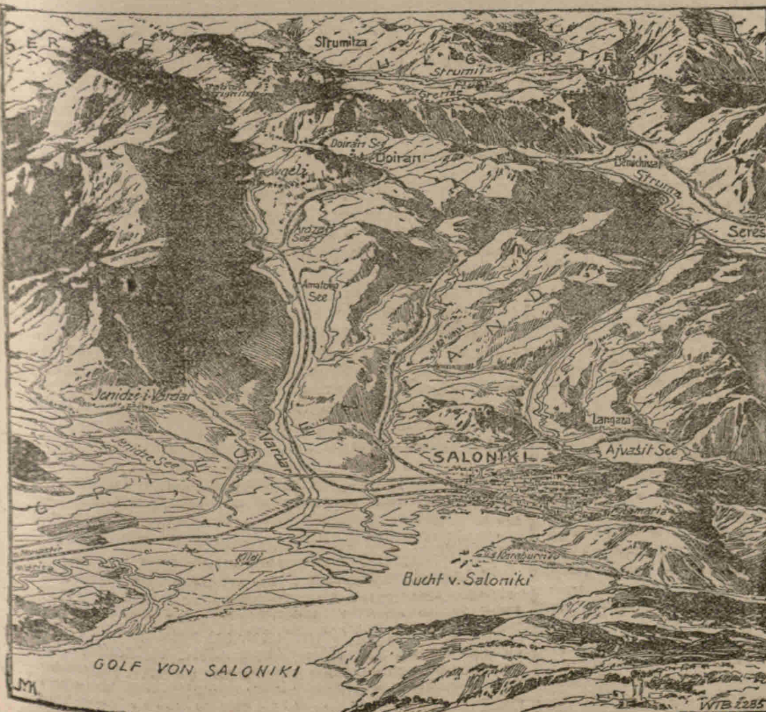
RELIEFKARTE VON SALONIKI U. HINTERLAND

wb. Paris, 10. November. „Reit Journal“ meldet aus Rom, das die italienische Regierung eine halbamtliche Note veröffentlicht habe, das die Bulgaren, indem sie Albanien bedrohen, um die Adria zu erreichen, die italienischen Interessen gefährden. Italien werde die erforderlichen Maßnahmen ergreifen, um der Gefahr zu begegnen.