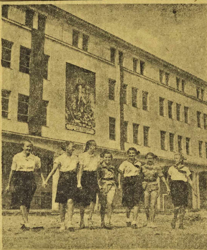
W całym kraju rozpoczął się rok szkolny. Na zdjęciu: Dziewczęta ze szkoły im. Jarosława Dąbrowskiego w Warszawie.

Przypominamy, że mecz odbędzie się jutro o godz. 18.30.