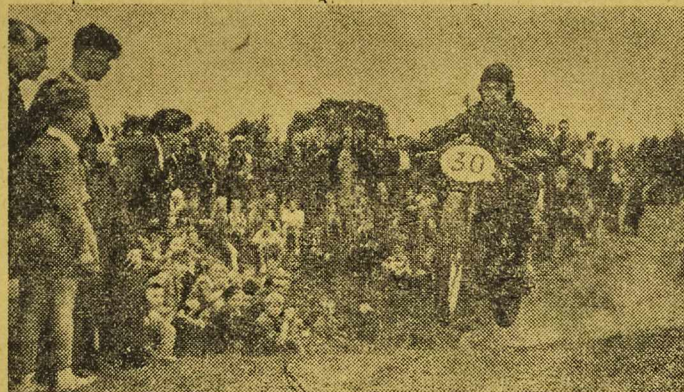
Moto-Cross był doskonałą propagandą sportu motorowego. Na zdjęciu: SHL-ki zdają egzamin techniczny.

NIEDZIELNY Moto - Cross zorganizowany przez Stal Pafawag był doskonałą propagandą sportu motorowego. Nie też dziwnego, że na trasie zawodów zebrało się około 10.000 widzów, obserwujących zacięte pojedynki najlepszych motocyklistów Dolnego Śląska. Start i meta Moto - Cross-u znajdowały się na Niskich Łąkach. Zawodnicy musieli przejechać sześć okrążeń w obwodzie zamkniętym, o długości 1.800 m. Trasa niezwykle trudna, wymagająca