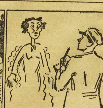
Obywatelka Gniazdko winna jest uszkodzenia sieci i powstania strat w gospodarce narodowej.