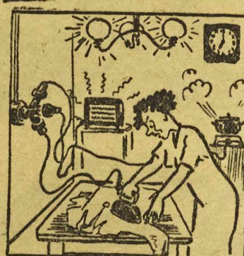
Godziny, w których używanie energii jest zakazane. Nikt jednak nie widzi...