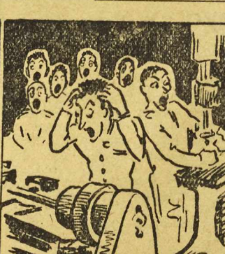
I znów maszyny stanęły... Plan zawalony.