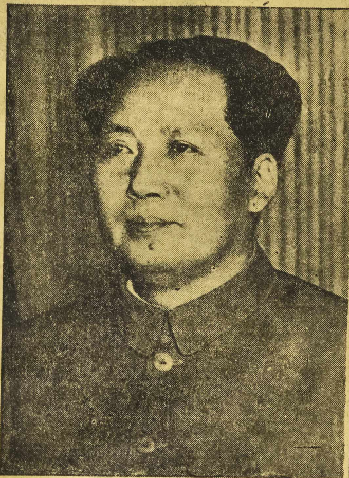
W CZORAJ wielki wódz narodu chińskiego, Mao-Tse-tung obchodził 58 rocznicę urodzin.

Pod wodzą tow. Mao-Tse-tunga Chińska Armia Ludowa odniosła historyczne zwycięstwo, pokonując czterokrotnie silniej uzbrojone i dowodzone przez Amerykanów wojska Kuomintangu.