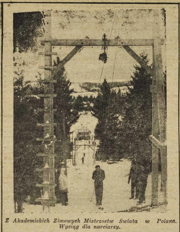
Z Akademickich Zimowych Mistrzostw Świata w Poiana. Wyciąg dla narciarzy.