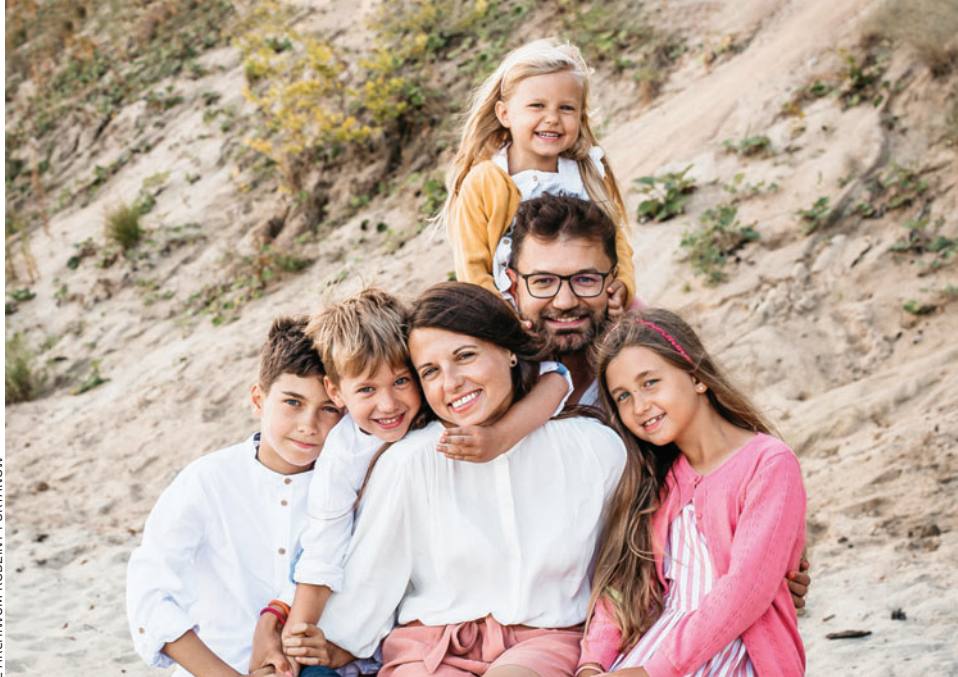
Z ARCHIWUM RODZINY FURTANÓW

Napisałaś również: „Naszego «zewnętrznego» domu poszukiwaliśmy i wybraliśmy go wraz ze św. Józefem. Wiele kwestii związanych z jego zakupem i wykończeniem odczytywaliśmy i nadal odczytujemy w kategoriach Jego prowadzenia. Dom został poświęcony w czwartą dobę od zamieszkania. Czuliśmy się w nim bardzo dobrze, czuliśmy Bożą Obecność. Był spełnieniem jednej z obietnic płynących z Ewangelii z naszego ślubu: «Starajcie się naprzód o królestwo Boga i o Jego sprawiedliwość, a to wszystko będzie wam dodane» (Mt 6, 33)».