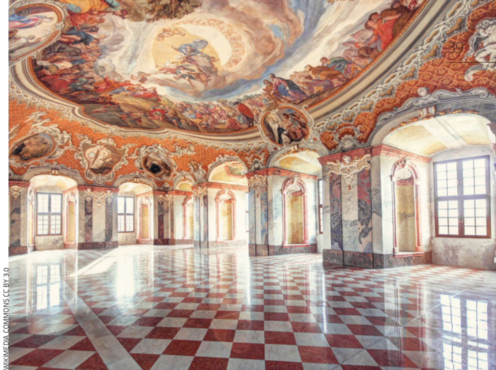
Refektarz letni z malowidłami Michała Willmanna, poświęconymi wyższości życia cnotliwego nad marnością i rozkoszami życia ziemskiego

Wokół budynku klasztoru wzniesiono też liczne zabudowania pomocnicze. Między innymi budynek bramny, w którym urządzono później klasztorny szpital, obok budynek kancelarii klasztornej z zegarem słonecznym, kuźnię, dom klasztornych oficjalistów. Dalej w zachodniej części placu klasztornego wzniesiono wozownię, a w głębi browar z piekarnią i budynek świeckich pracowników klasztoru oraz kościół św. Jakuba, którego budowę zakończono w 1697 r., zastępując tym