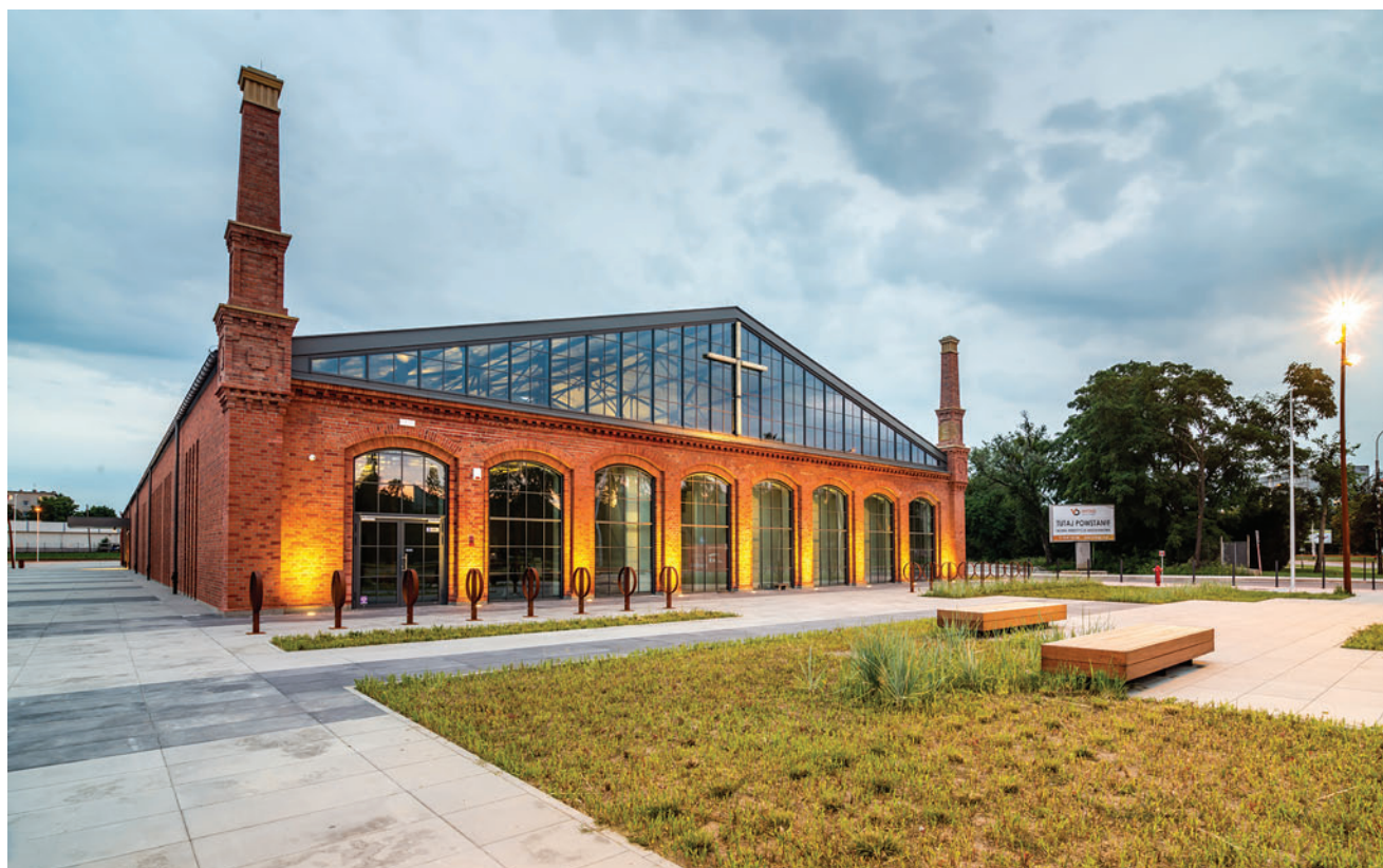
Centrum Historii Zajezdnia