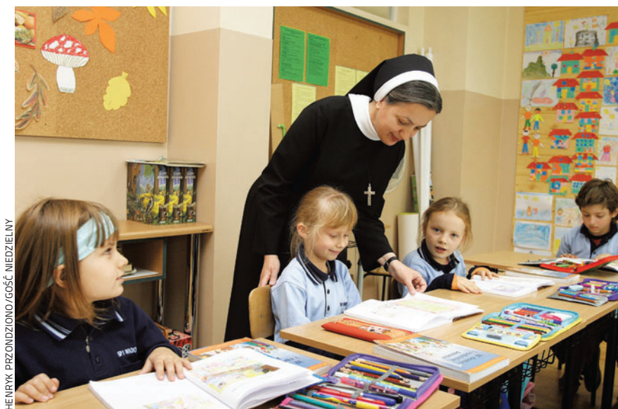
HENRYK PRZONDZIONO/GOŚĆ, NIEDZIELNY

Lekcje religii w szkole są niezbędne, ale tylko wspierają rodziców w wychowaniu ich dzieci do wiary