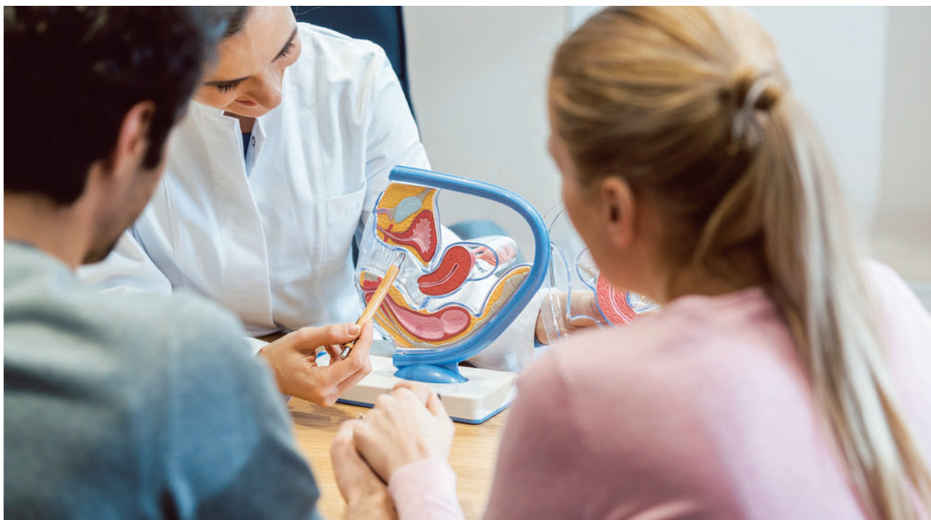
Podstawą naprawczej medycyny prokreacyjnej (RRM) jest szczegółowa diagnostyka przyczyn niepłodności, której częścią są obserwacje prowadzone przez samą kobietę

Informacje o ośrodkach i lekarzach zajmujących się przyczynowym leczeniem niepłodności można znaleźć na stronie: https://www.fertilitycare.pl/ . ●