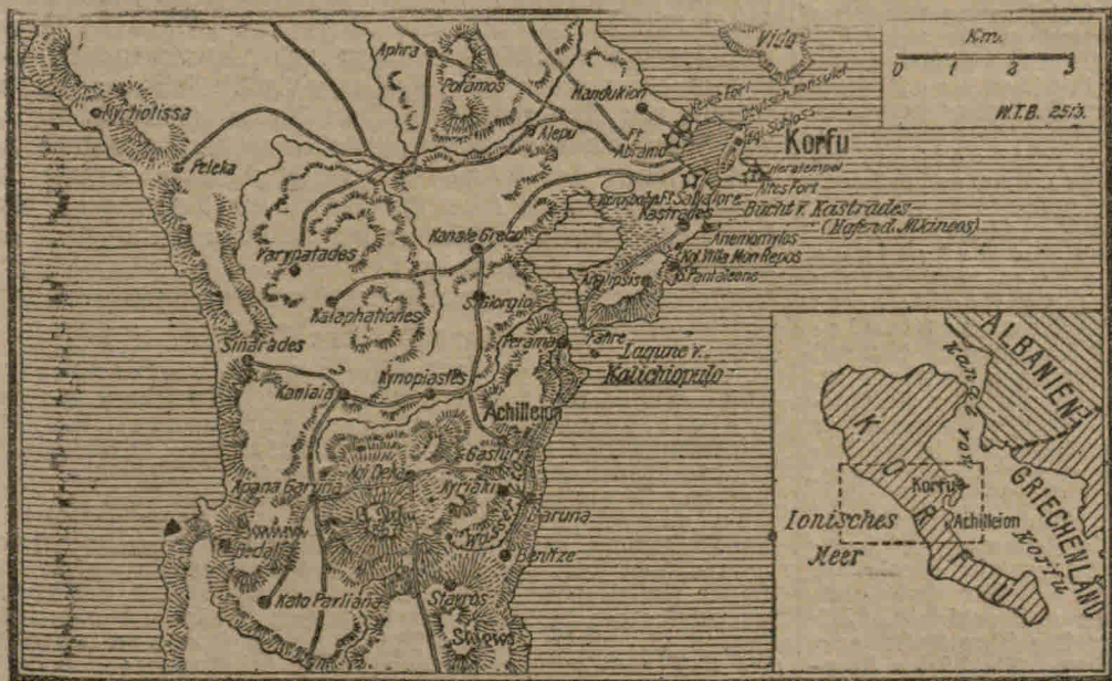
Zur Besetzung von Korfu durch die Franzosen.

Der Bote a. d. Riesengebirge empfiehlt sich zur Anfertigung von Plakaten in künstlerischer Ausführung, Etiquetten, Briefköpfen für die gesamte Industrie, Rechnungen, Programmen usw. Prospekten, Statuten, Formularen aller Art.